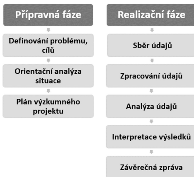
Obrázek 1 - Fáze marketingového výzkumu