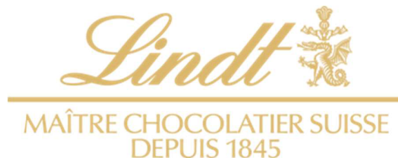
Obrázek 3 - Logo společnosti

Společnost Lindt & Sprüngli, zkráceně Lindt, je švýcarská čokoládová a cukrářská společnost založená v roce 1899 Davidem Sprüngli a jeho synem Rudolfem Sprüngli-Ammannem. Už v roce 1845 vytvořili první pevnou tabulku čokolády v německy mluvící části Švýcarska. Postupným vývojem se společnost Lindt & Sprüngli stala jedničkou na světovém trhu s prémiovou čokoládou a je také známá nejen svými klasickými čokoládami, ale i pralinkami, bonboniérami, čokoládovými figurkami jako velikonoční zlatý zajíček a vánoční zlatý medvídek. Celé tajemství těchto krémově jemných čokolád je v míchání tzv. konšování. Je to rovnoměrné a dlouhodobé promíchávání kakaového másla, kakaové hmoty a dalších ingrediencí. Tato technika stvořila vysněnou "rozplývající čokoládu", tak jemnou a chutnou, že jí nelze odolat (Lindt 2023b).