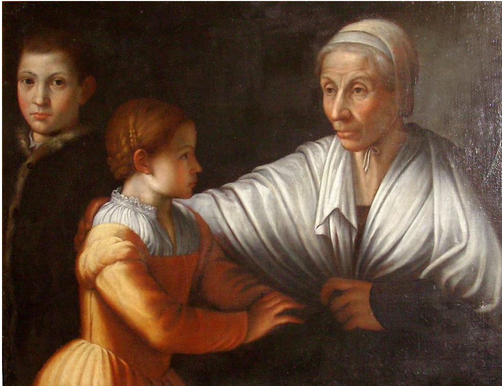
3) Sofonisba Anguissola, Podobizna stařenky se dvěma dětmi, plátno, 72 × 94 cm, Kolowratská obrazárna v Rychnově nad Kněžnou (č. kat. 163).