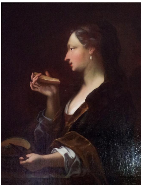
26) Michael Václav Halbax, Alegorie chuti, kolem roku 1700, plátno, 86,5 × 66 cm, Kolowratská obrazárna v Rychnově nad Kněžnou (č. kat. 48).