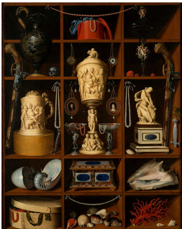
14) Johann Georg Hinz, Regál se starožitnostmi, 1666, plátno, 127,5 × 101 cm, Kolowratská obrazárna v Rychnově nad Kněžnou (č. kat. 280).