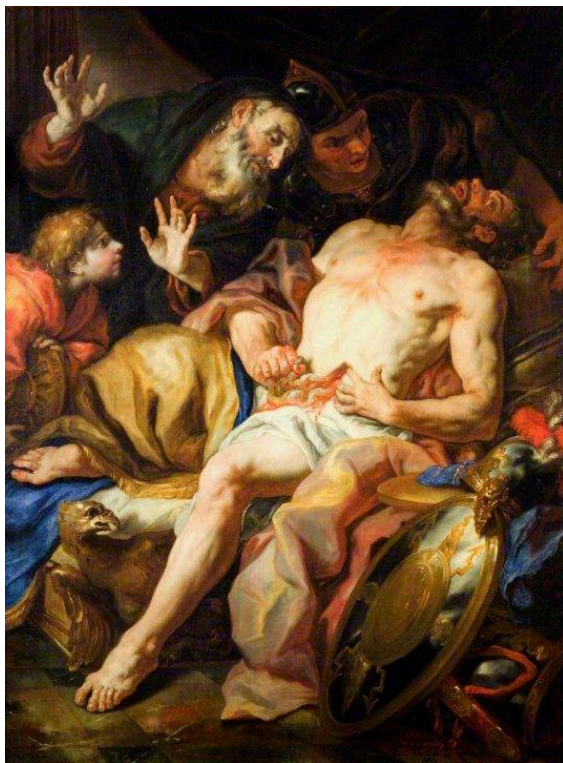
19) Johann Michael Rottmayr, Sebevražda Catona Utického, 1692, plátno, 128 × 96 cm, Kolowratská obrazárna v Rychnově nad Kněžnou (č. kat. 54).