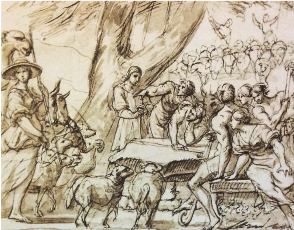
9) Karel Škréta, Jákovův příchod k Lábanovi, III. kresba, Sacramento, Crocker Art Gallery. Převzato z: Neumann 2000, s. 33.