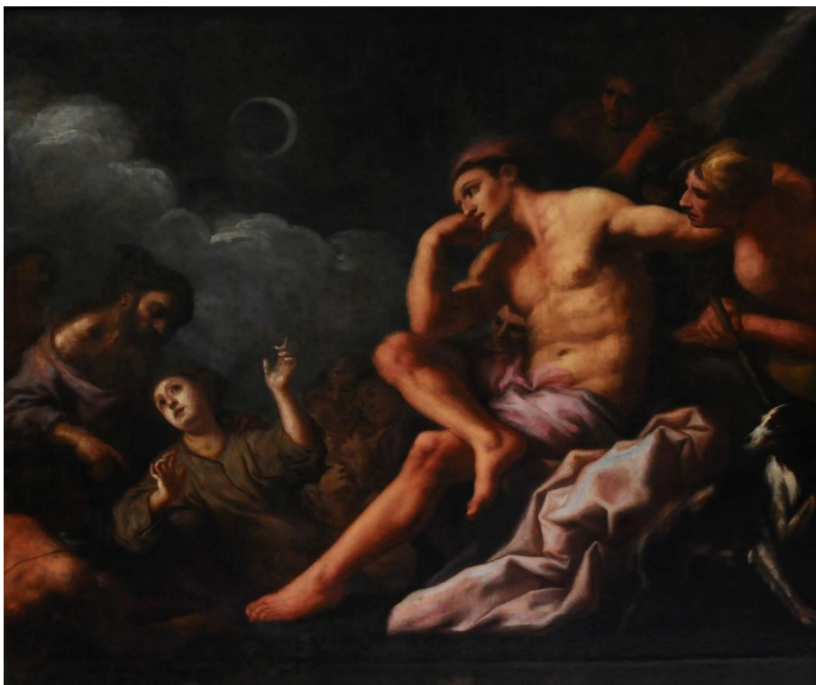
15) Antonio Zanchi, Jákob mezi svými syny, plátno, 230 × 260 cm, Kolowratská obrazárna v Rychnově nad Kněžnou (č. kat. 6).