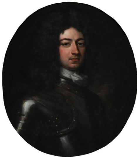
30) Philip Christian Bentum, Podobizna neznámého člena rodiny Kolowratů, kolem roku 1730, plátno, 72 × 62 cm (ovál), Kolowratská obrazárna v Rychnově nad Kněžnou (č. kat. 161).