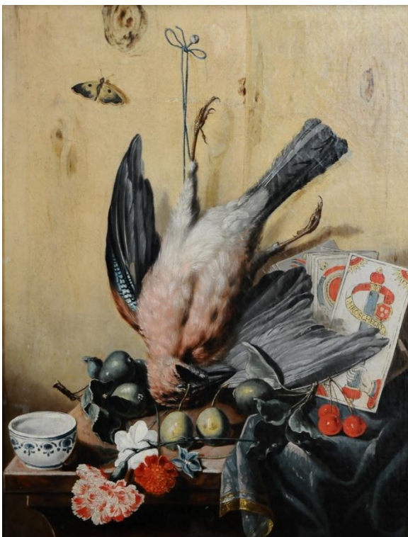
32) Jan Antonín Vocásek-Hrošecký, Zátiší se sojkou, ovocem, květinami, kartami a miskou, kolem roku 1740, plátno, 52 × 40 cm, Kolowratská obrazárna v Rychnově nad Kněžnou (č. kat. 293).