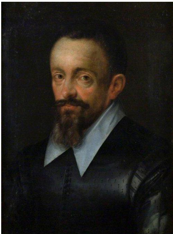
4) Hans von Aachen, Podobizna muže, možná Johanna Keplera, před rokem 1612, plátno, 51,5 × 38,5 cm, Kolowratská obrazárna v Rychnově nad Kněžnou (č. kat. 158).