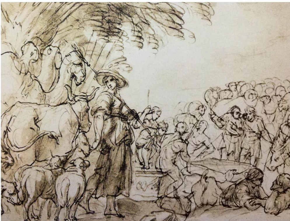
8) Karel Škréta, Jákovův příchod k Lábanovi, II. kresba, Berlín, Kupferstichkabinett.