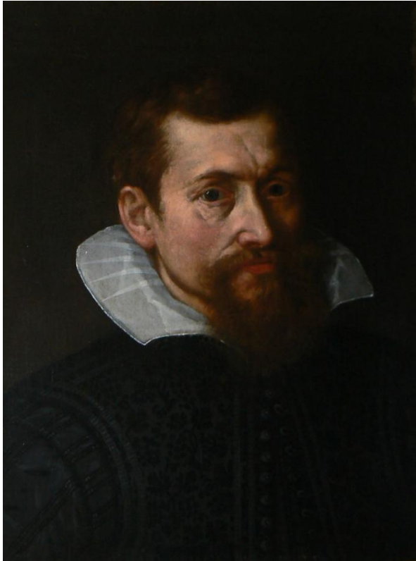
5) Hans von Aachen, Podobizna šlechtice II, plátno, 51,5 × 38,5 cm, Kolowratská obrazárna v Rychnově nad Kněžnou (č. kat. 164).