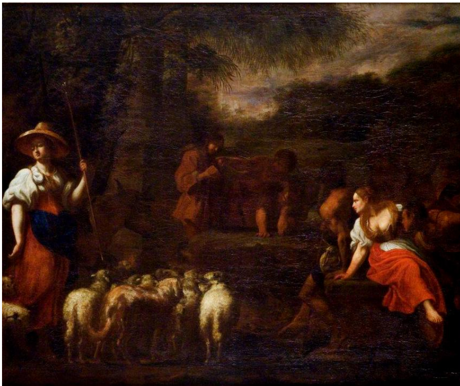
6) Karel Škréta, Jákobův příchod k Lábanovi, 1643, plátno, 87,5 × 107 cm, Kolowratská obrazárna v Rychnově nad Kněžnou (č. kat. 7).