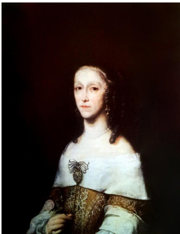
13) Daniel Schultz, Podobizna Magdaleny Ludmily Liebsteinské z Kolowrat, 1659, plátno, 87,5 × 71,5 cm, Kolowratská obrazárna v Rychnově nad Kněžnou (č. kat. 157).