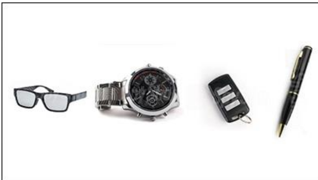
Obrázek 4 - ukázka sledovacích prostředků dostupných na e-shopech 22