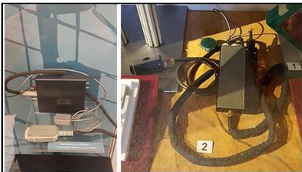
Obrázek 1 - VKV radiostanice Hvězda V používané skrytě v 60-70.letech 19

Spojovací technika, do které patří radiová spojení pracovní skupiny, radiové spojení ve služebních vozidlech, služební mobilní telefony. Tato technika je důležitá pro komunikaci mezi pracovníky pracovní skupiny, mezi pracovní skupinou a zároveň slouží jako spojení mezi vedoucím pracovní skupiny s pracovníkem stálé služby, vedoucím specializovaného pracoviště i s oprávněným vyžadujícím policistou pro předávání důležitých informací souvisejících s probíhající akcí.