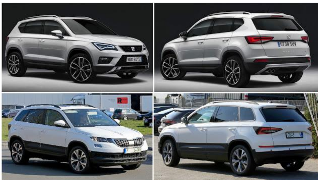
Obrázek 5 - ukázka podobnosti vozidel 23

Například v případě, že by pracovní skupina měla složení vozidel stejné značky, nebo značek příliš podobného vzhledu, podobných odstínů barev, je pravděpodobné, že v takovém případě by zde existovala možnost dekonspirace nebo by mohla nastat taková situace, ve které by sledovaná osoba nabyla podezření, že je sledována. Lze tedy říci, že některé značky vozidel jsou si velice typově podobné, a pokud mají i podobný barevný odstín a pokud osoba není znalec automobilových značek, lze si takové druhy vozidel splést a označit je za jedno a totéž vozidlo. (pozn. níže uvedená podobnost je pouze ilustrativní)