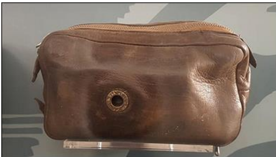
Obrázek 3 - pouzdro na skrytý fotoaparát tzv. kamoufl užíván v 60.letech 21

Camcordery jsou prostředky, které patří mezi základní vybavení pracovní skupiny, a jsou využívány oběma způsoby, tj. otevřeným i skrytým použitím.