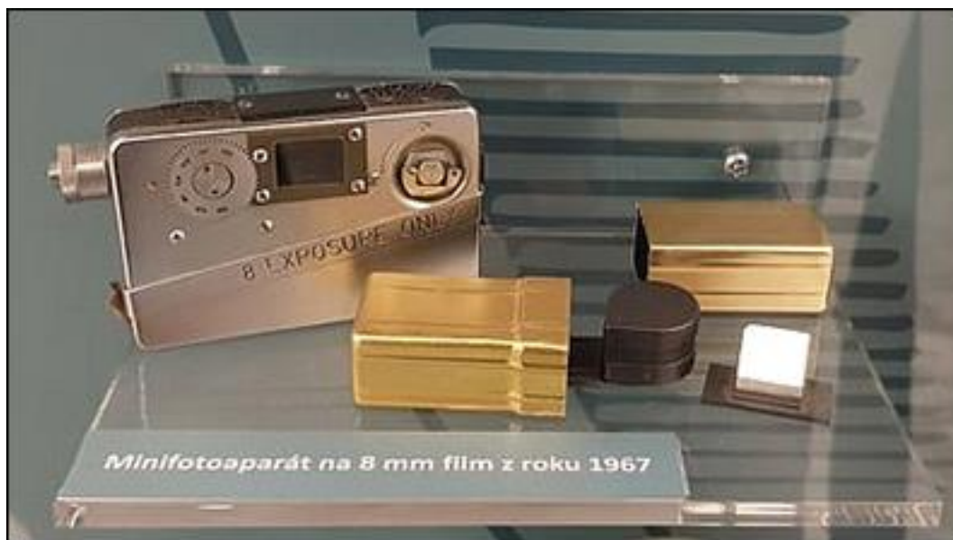
Obrázek 2 - mini fotoaparát pro skryté užití, r. 1967 20

o fotoaparáty menších rozměrů, či přímo o mini kompaktní fotoaparáty, které se často zabudovávají do prostředků, které jejich použití skrývají. V takovém případě se jedná o tzv. "kamufly".