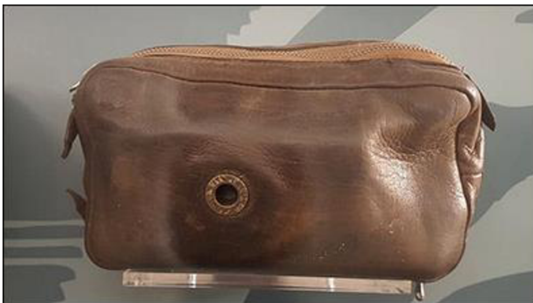
Obrázek 3 - pouzdro na skrytý fotoaparát tzv. kamufli užíván v 60. letech 21

Camcordery jsou prostředky, které patří mezi základní vybavení pracovní skupiny, a jsou využívány oběma způsoby, tj. otevřeným i skrytým použitím.