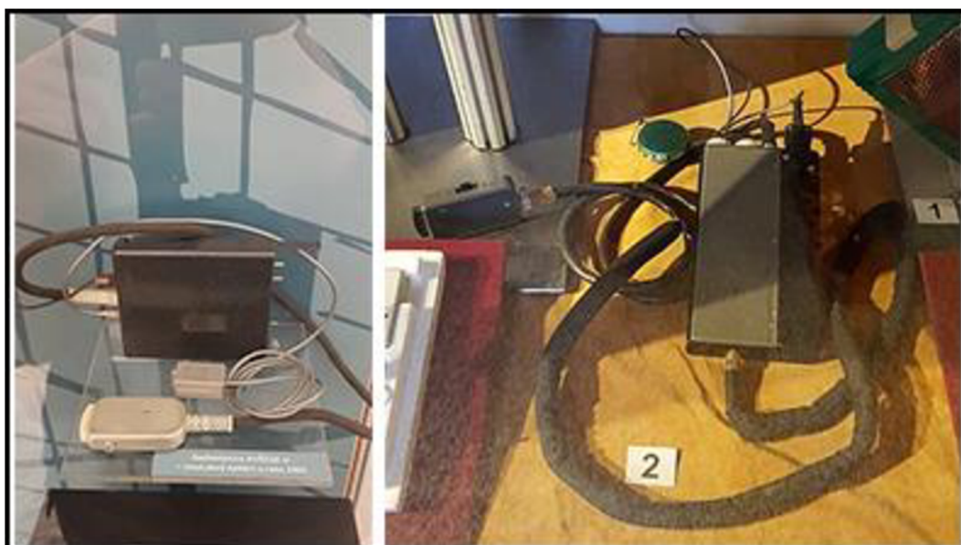
Obrázek 1 - VKV radiostanice Hvězda V používané skrytě v 60-70.letech 19

Spojovací technika, do které patří radiová spojení pracovní skupiny, radiové spojení ve služebních vozidlech, služební mobilní telefony. Tato technika je důležitá pro komunikaci mezi pracovníky pracovní skupiny, mezi pracovní skupinou a zároveň slouží jako spojení mezi vedoucím pracovní skupiny s pracovníkem stálé služby, vedoucím specializovaného pracoviště i s oprávněným vyžadujícím policistou pro předávání důležitých informací souvisejících s probíhající akcí.