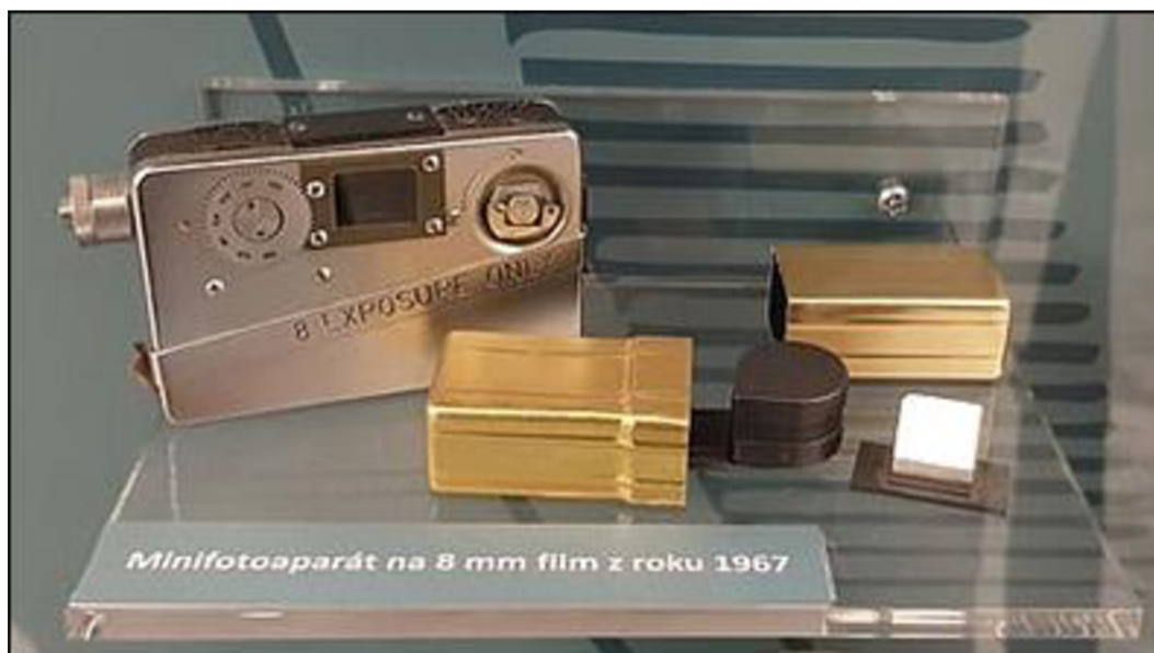
Obrázek 2 - mini fotoaparát pro skryté užití, r. 1967 20

o fotoaparáty menších rozměrů, či přímo o mini kompaktní fotoaparáty, které se často zabudovávají do prostředků, které jejich použití skrývají. V takovém případě se jedná o tzv. "kamufly".