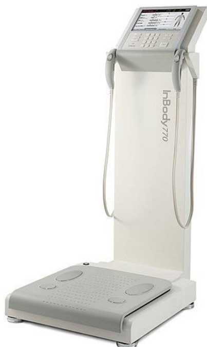
Obrázek 3: InBody 770