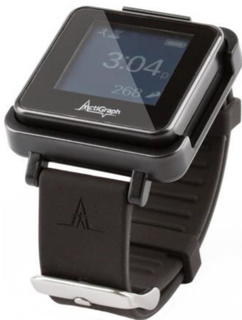
Obrázek 4: ActiGraph GT9X s náramkem

Snímací frekvence byla nastavena na 30 Hz, pro inicializaci a stažení surových dat převedených na 60 sekundové epochy byl využit software ActiLife. Mezní zóny pro stanovení intenzity PA byly nastaveny manuálně (sedavé chování <3000 countů, lehká intenzita 3001-7000 countů, střední intenzita 7001-12000 countů, vysoká intenzita >12001 countů) County jsou dle ActiGraph (2018) výsledkem sečtení dodatečně filtrovaných hodnot akcelerometru a jejich hodnota se bude lišit v závislosti na frekvenci a intenzitě hrubého zrychlení. Z hlediska odfiltrování spánkové aktivity byla zpracována data každý den pouze v rozmezí 7:00-21:00. Sledování hráči měli přístroje umístěny na zápěstí nedominantní ruky. Sledovaná doba byl jeden týden letní přípravy, během kterého všichni hráči strávili 90 minut organizovaným tréninkem denně. Aktivita během spánku není započítána do měření. Sledovaným parametrem byla celková doba strávená v pásmu MVPA.