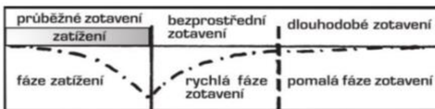
Obrázek 1: Průběh zotavení a zotavné záze (Perič, Dovalil, 2010)