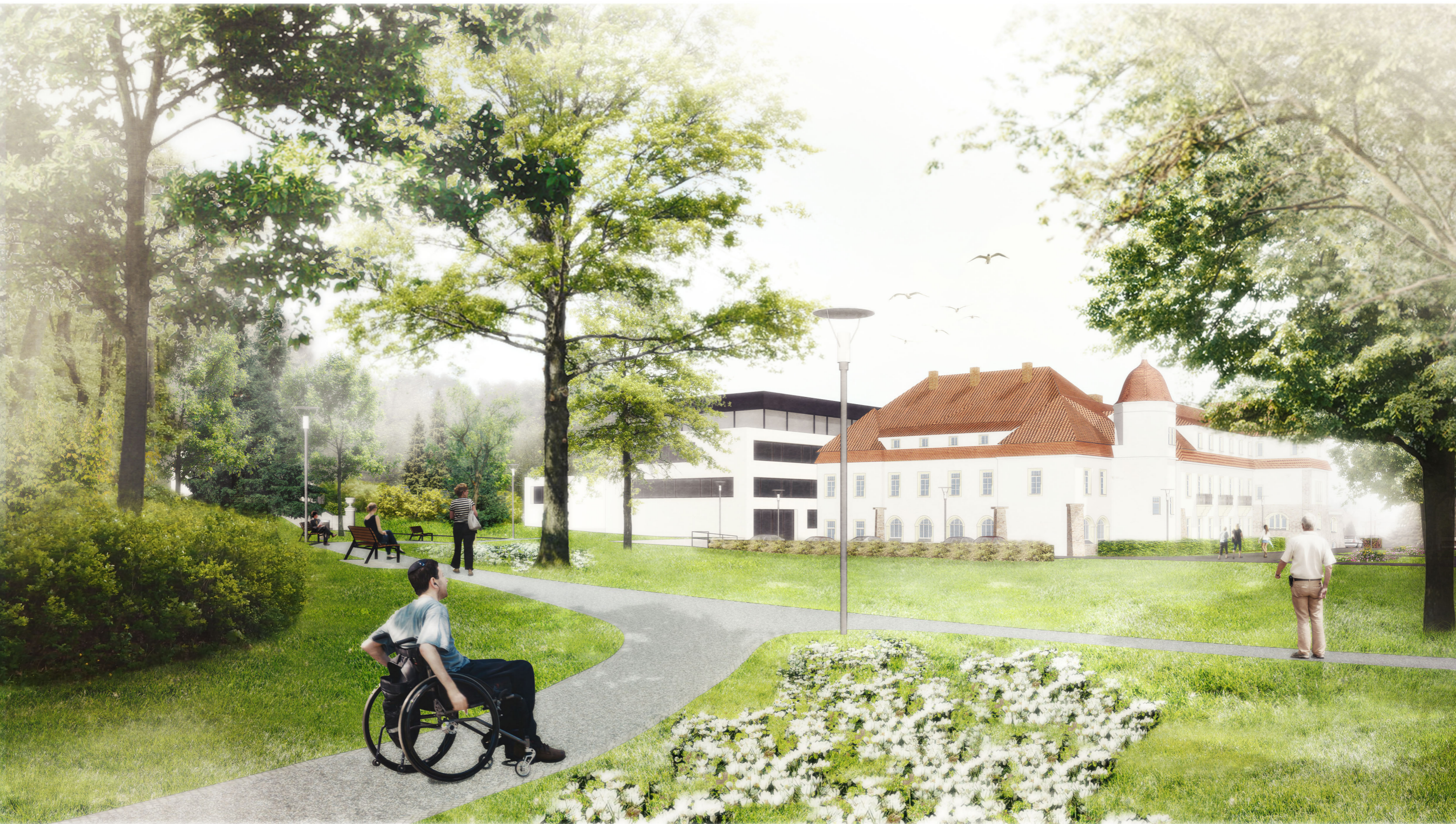
VIZUALIZACE: PARKOVÁ ČÁST