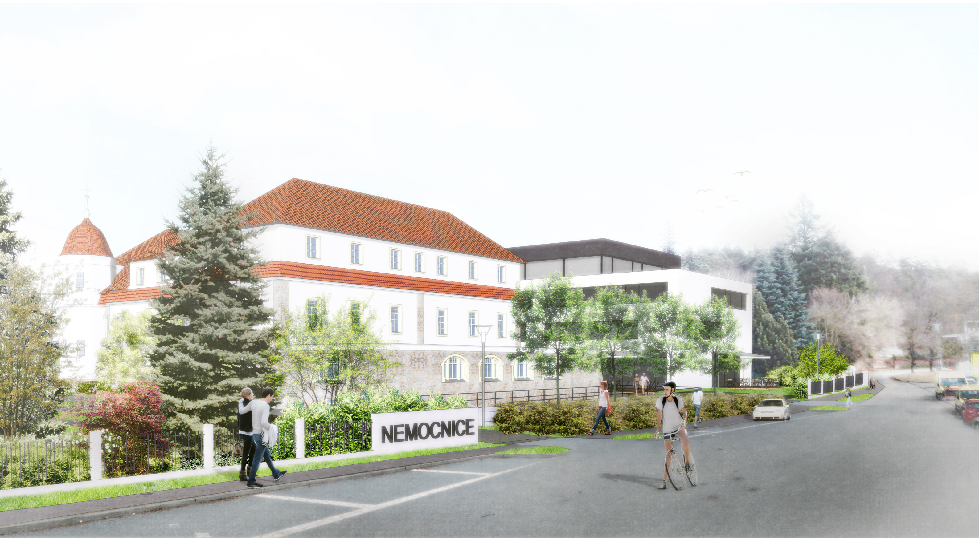
VIZUALIZACE: VSTUP DO AREÁLU NEMOCNICE