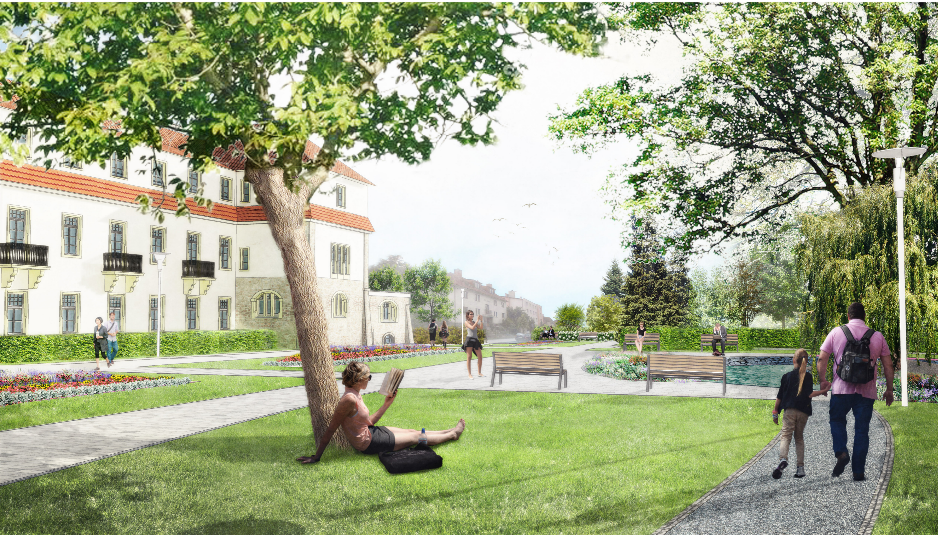
VIZUALIZACE: FORMÁLNÍ PARTER