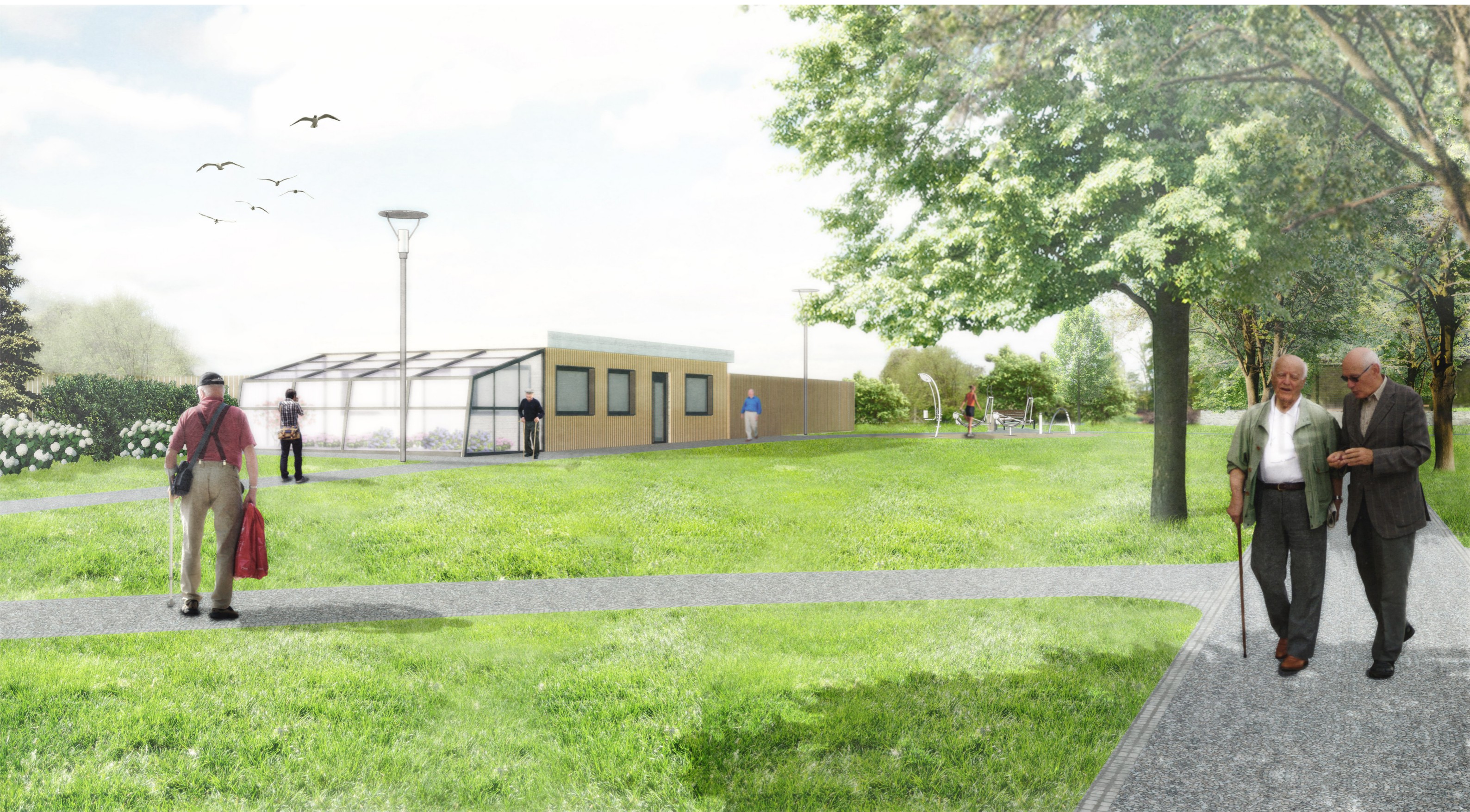
VIZUALIZACE: ZÁZEMÍ ZAHRADNÍKA