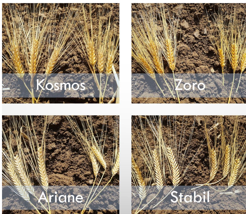
Obr. 3: Stav rostlin 28.6.2023

Na obrázku č. 3 je stav rostlin z 28.6.2023. U každé odrůdy jsou vybrány klasy z výsevku 1,5 a 5,5 MKZ/ha.