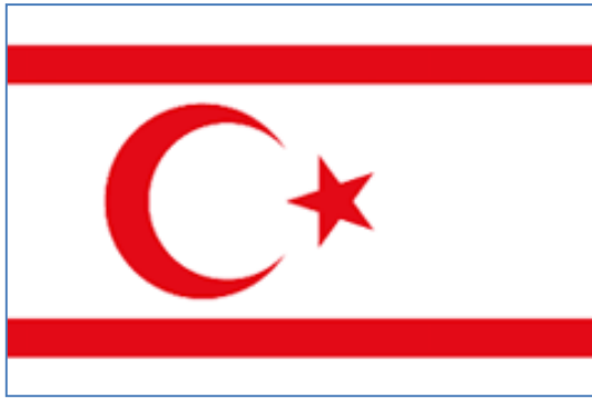
Obr. č.3: Vlajka TRNC.