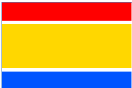
Obr. č. 5: Návrh nové vlajky sjednoceného Kypru.

Annanův plán počítal s rozsáhlou demilitarizací Kypru. Počet tureckých vojáků na severu by se měl po určité době snížit z 30 000 na 6 000. Řecká armáda by mohla mít na Kypru svých 4 000 vojáků (Právo, 2004). Součástí Annanova plánu byla i změna názvu státu (Spojená kyperská republika) a také změna vlajky (Zpravodaj střediska vexilologických informací, 2004).