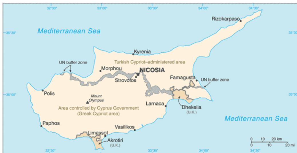
Obr. 1: Mapa Kypru.

má na ostrově 2 své základny (Akrioti a Dhekelia), které pokrývají cca 2,7% plochy ostrova. Velká Británie si ponechala tyto základny na základě ujednání z roku 1960, kdy Kypr získal nezávislost na britské koloniální správě (Tisková a informační kancelář Kyperské republiky, 2008).