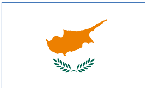
Obr. č. 2 : Vlajka Kyperské republiky

Kyperská republika je mezinárodně uznávaný suverénní stát. Zaujímá jižní část ostrova Kypr, ale de iure má suverenitu nad 97 % území (kromě britských základů). Obyvatelstvo je převážně řecko-kyperského etnika, dále v této části žijí náboženské menšiny (místně vnímané jako etnika) Maronité, Arméni a Latinové, kteří si na základě ústavy z roku 1960 museli zvolit, jestli se připojí k řecké nebo turecké komunitě (Tisková a informační kancelář Kyperské republiky, 2008, 5).