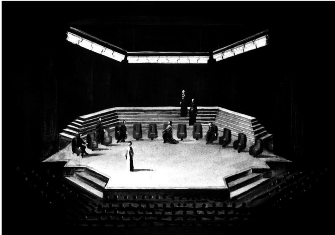
3. Návrh scény Zbyňka Koláře. Uloženo v archivu Národního divadla Praha.