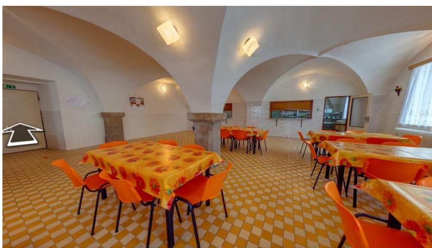
Obrázek 5: Školní jídelna (Zdroj: z důvodu anonymity je zdroj vynechán)