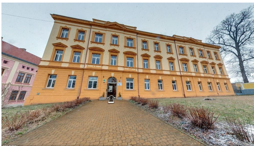
Obrázek 1: Vchod do budovy školy

Technické vybavení třídy- TV lupa, příruční elektronická lupa, dataprojektor značky EPSON, počítač, notebook se zvětšovací programem