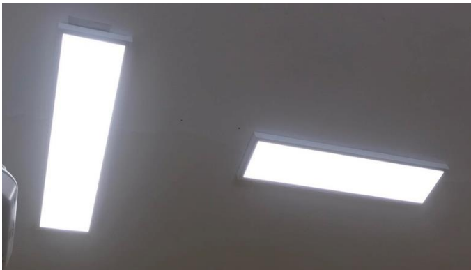
Obrázek 10: Světla