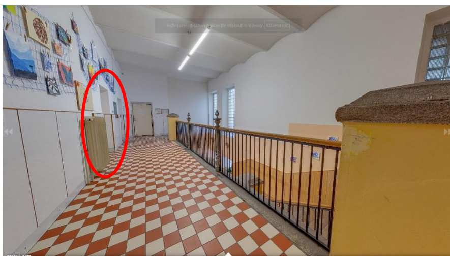
Obrázek 3: Druhé patro a kmenová učebna