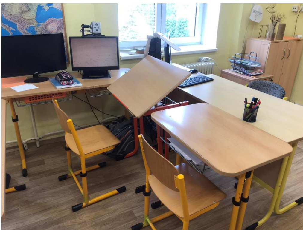
Obrázek 9: Pracovní místo