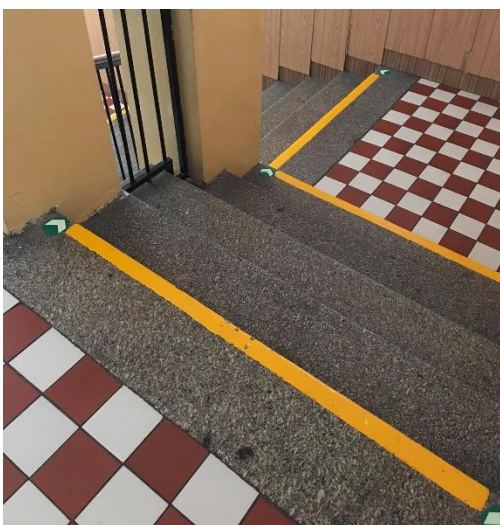
Obrázek 11: Kontrastní označení schodů