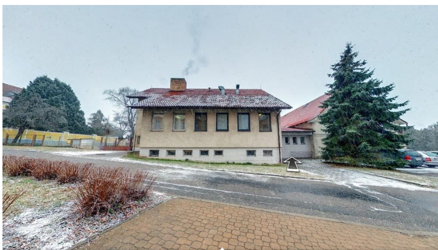
Obrázek 4: Školní jídelna