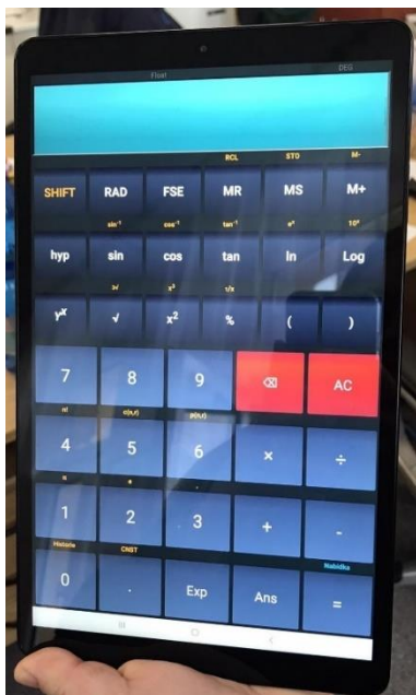
Obrázek 8: Kalkulačka v tabletu