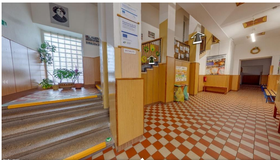
Obrázek 2: Chodba školy a schody