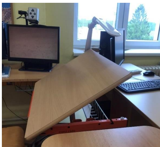
Obrázek 12: Sklopná deska u stolu