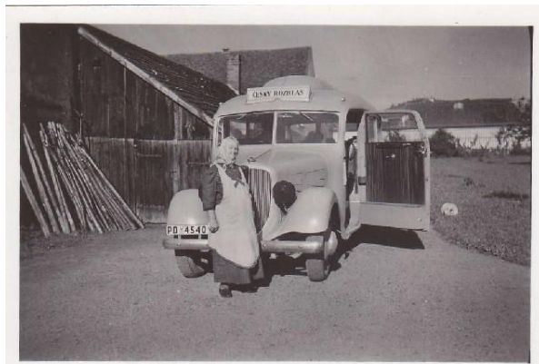
Obr. 7 Anna Havránková, služebná (foto z pozdější doby)