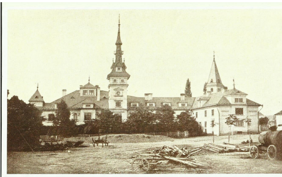
Obr. 3 Zámek kolem r. 1890