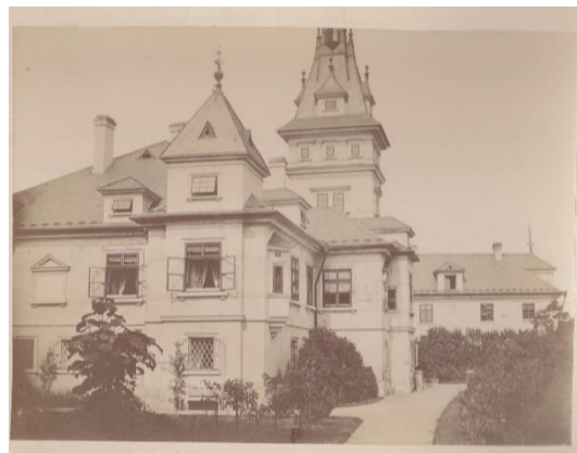
Obr. 2 Zámek kolem roku 1890