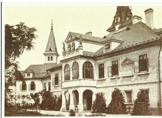
Obr. 1 Zámek kolem roku 1890