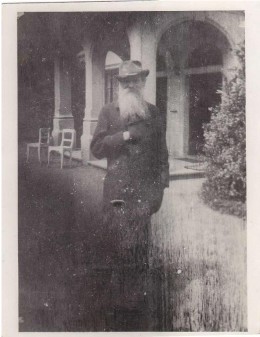
Obr. 4 Josef Hlávka před zámkem