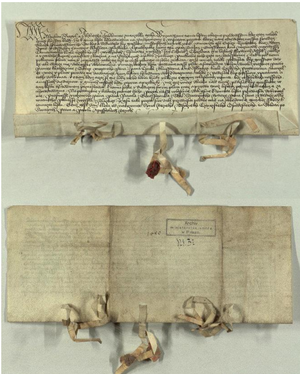
Obr. č. 2.

Kateřina z Okoře je na této listině s pěti pečeti přivěšenými na pergamenových prouzcích dne 1. července 1480 uvedena jako dlouholeté manželka Čenka z Klinštejna.