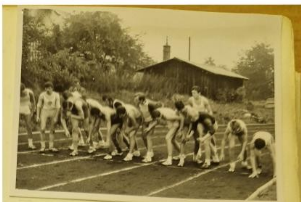
Start na 1.500 m