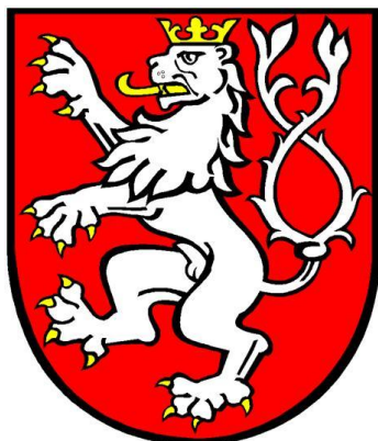
Obrázek 1 Znak města