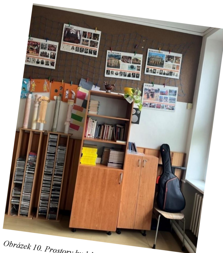
Obrázek 10. Prostory hudební třídy