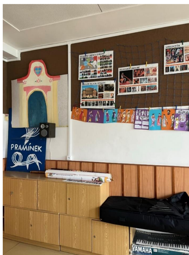
Obrázek 7. Prostory hudební třídy (vlastní zdroj)