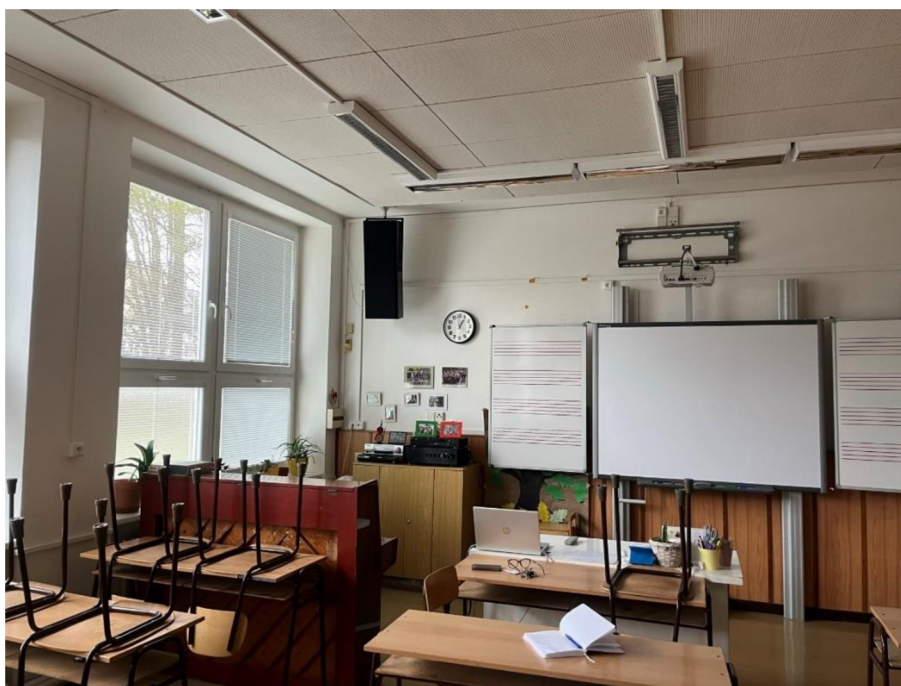
Obrázek 6. Prostory hudební třídy