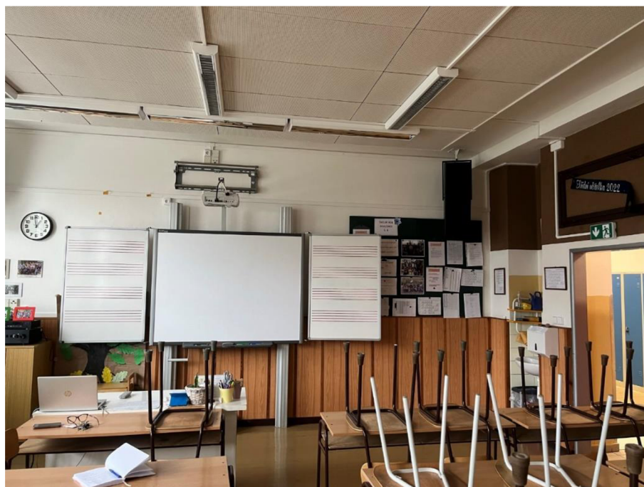
Obrázek 8. Prostory hudební třídy (vlastní zdroj)