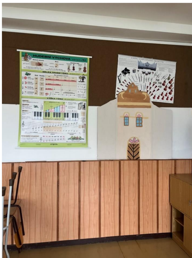
Obrázek 9. Prostory hudební třídy