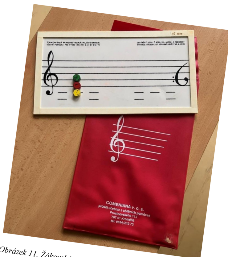
Obrázek 11. Žákovská magnetická klávesnice (vlastní zdroj)