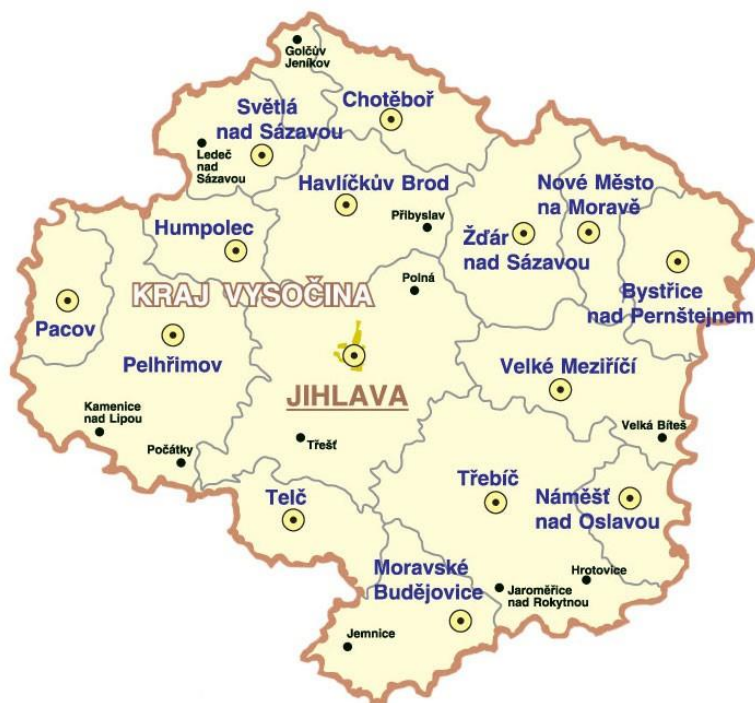
Obrázek č. 2: Mapa Kraje Vysočina