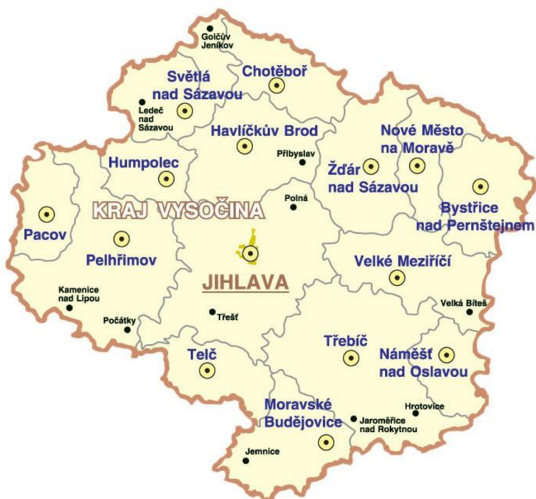
Obrázek č. 2: Mapa Kraje Vysočina