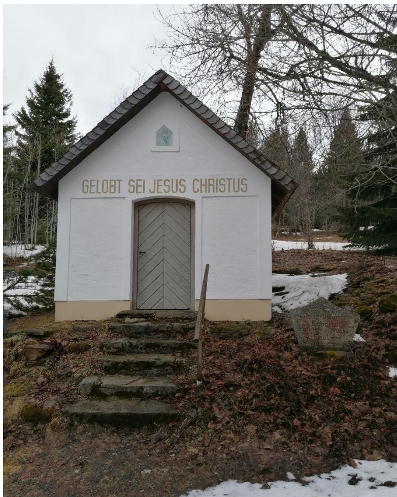
Obrázek 3.8: Kaple sv. Michala

a to do původní podoby. Následně téhož roku v říjnu byla kaple vysvěcena. Další opravu potřebovala v roce 2017, kdy kvůli nepříznivým vlivům počasí na Bučině spadl na kapli strom, který způsobil značné škody. Kaple je v současné době zděná a má šindelovou střechu. Pozemek, na kterém kaple stojí, je pod správou Národního parku Šumava. Došlo také ke vzniku česko-německé tradiční poutě, která je s touto kaplí, ale také celkově se zaniklou obcí Bučina, spojena. Tato tradice vznikla v roce 2006 a koná se každoročně druhou červencovou sobotu. Poutníci, kteří tuto cestu absolvují, vychází od stavby kostela sv. Štěpána, který stojí na Kvildě, a následně pokračují kolem pramene Vltavy až na Bučinu. Celá tato trasa je dlouhá okolo 13 kilometrů. Ve chvíli, kdy dorazí na Bučinu, shromáždí se všichni poutníci před touto kaplí, kde se koná poutní mše svatá.