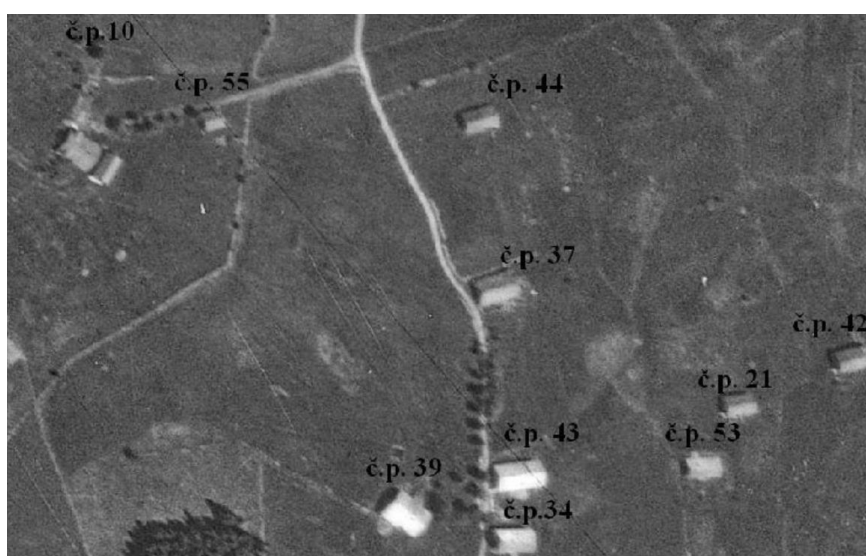
Obrázek 3.6: Rozmístění domů v zaniklé osadě Na Mlýnské Mýtině v roce 1949

Druhou osadou, která náležela k Bučině, byla osada Na Mlýnské Mýtině (viz. obrázek 3.6). Německý název pro tuto osadu je Mühlreutherhäuser. Okolí, kde osada vznikla, bylo dříve porostlé hustými lesy. Tento les se následně vykácel a vznikly zde holé mýtiny, dle kterých dostala osada své jméno. Nacházelo se zde 10 domů, škola, Seewaldova pila a mlýn. Mlýn, který zde stál, byl pro obyvatele osady, ale také pro obyvatele Bučiny a Chaloupek, velmi důležitý. Zejména proto, že se zde zpracovávala mouka.