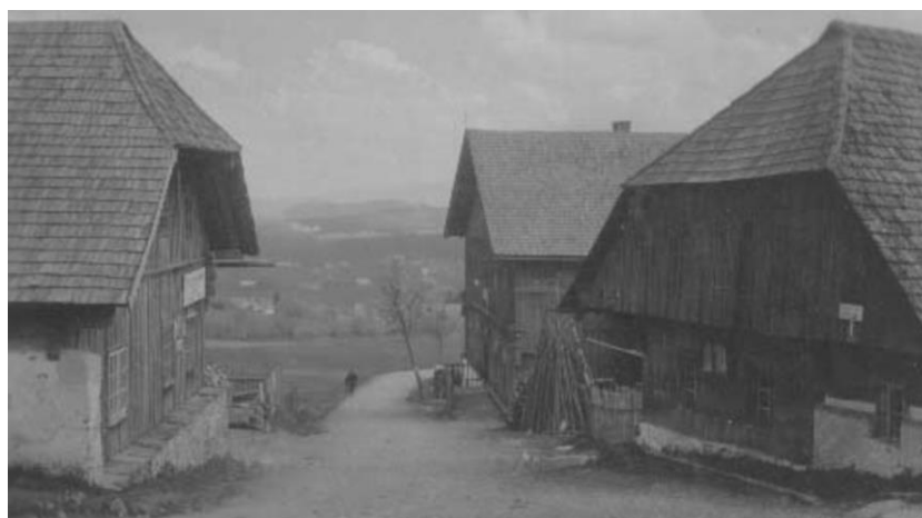
Obrázek 3.15: Skupina stavení v zaniklé obci Bučina

Důležité je si umět udělat představu také o tom, jak vypadal interiér takového stavení. Interiér venkovského stavení, které se nacházelo právě také na Bučině, byl ve většině případů velmi jednoduchý a nacházela se zde pouze jedna obytná místnost, tedy jizba. Právě v této místnosti docházelo ke všem událostem, které rodinu provázely. Tato místnost pak byla nejvíce využívána právě v zimě, kdy nebylo možné pobývat většinu času venku. V tomto období se všechny práce, které bylo třeba udělat, přesouvaly sem, takže se v této místnosti například tkalo, pletly se košíky, dralo peří či se zde vyráběly další výrobky, které se následně také prodávaly.