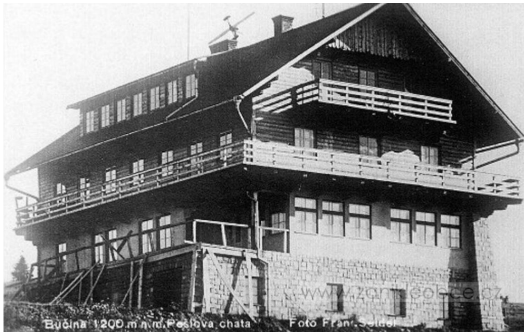
Obrázek 3.4: Pešlova chata

Aby zde stála česká konkurence tomuto hotelu, vznikla zde také Pešlova chata (viz. obrázek 3.4), která je pojmenována dle svého zakladatele a řadí se k nejmladším hotelům zde.