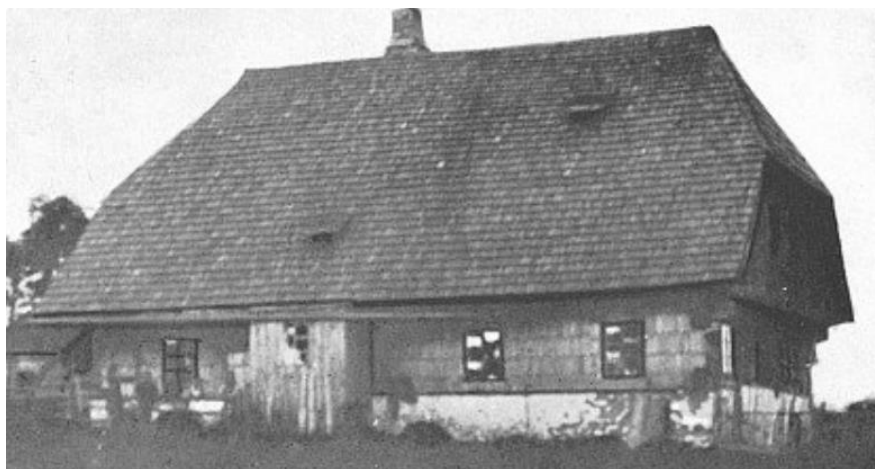
Obrázek 3.14: Stavení v zaniklé obci Bučina

Pro porovnání jsou zde vloženy dvě historické fotografie, dle kterých byl model vytvořen (viz. obrázky 3.14 a 3.15).