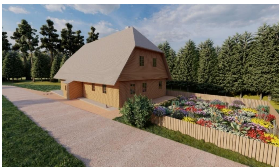
Obrázek 3.13: Vytvořený model domu z jiného pohledu