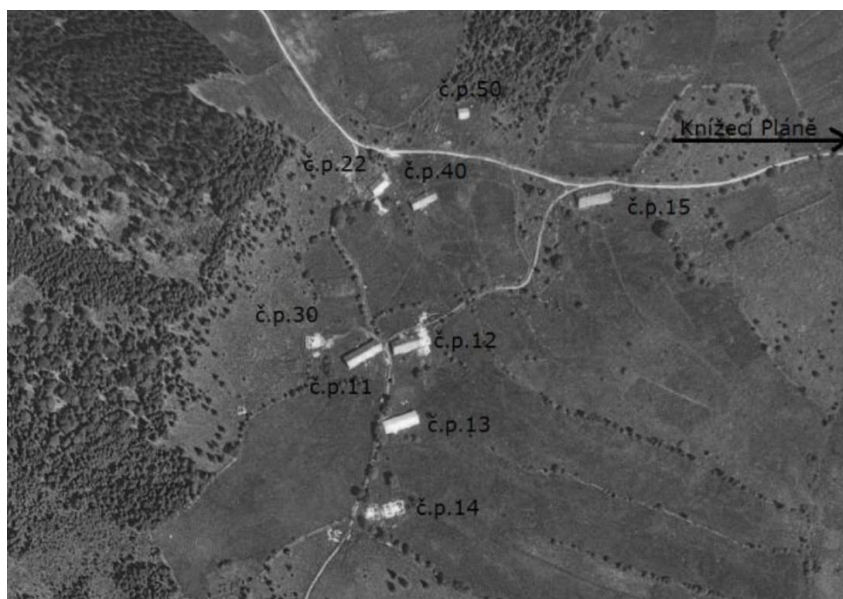
Obrázek 3.5: Rozmístění domů v zaniklé osadě Chaloupky v roce 1949

Druhou osadou, která náležela k Bučině, byla osada Na Mlýnské Mýtině (viz. obrázek 3.6). Německý název pro tuto osadu je Mühlreutherhäuser. Okolí, kde osada vznikla, bylo dříve porostlé hustými lesy. Tento les se následně vykácel a vznikly zde holé mýtiny, dle kterých dostala osada své jméno. Nacházelo se zde 10 domů, škola, Seewaldova pila a mlýn. Mlýn, který zde stál, byl pro obyvatele osady, ale také pro obyvatele Bučiny a Chaloupek, velmi důležitý. Zejména proto, že se zde zpracovávala mouka.