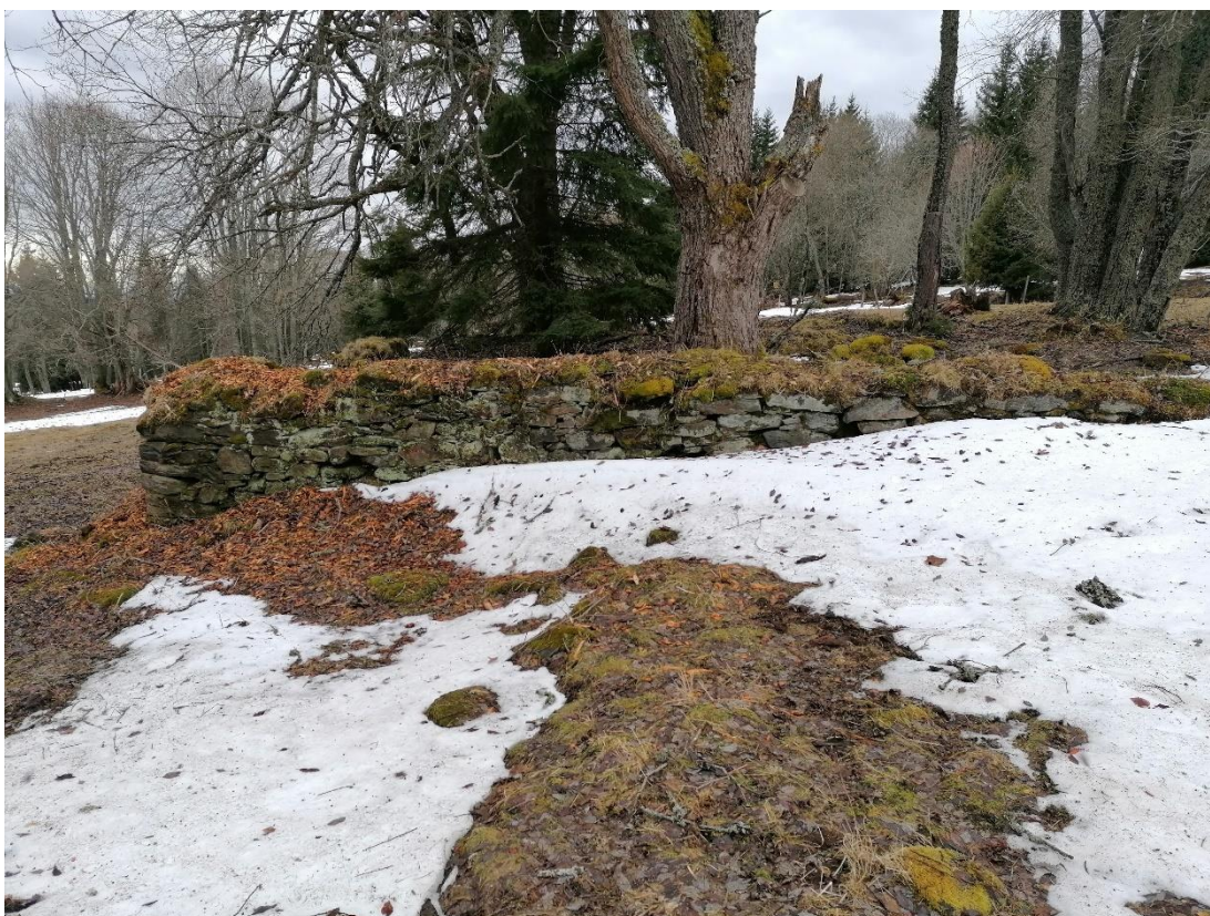
Obrázek 3.7: Pozůstatky domu

Jelikož se jedná o zaniklou obec, je zřejmé, že z původních objektů se zde dochoval pouhý zlomek. Při průzkumu území, kde se dříve obec rozprostírala, můžeme naleznou mnoho znaků (viz. obrázek 3.7), které nám ukazují, že právě v tomto místě stál například nějaký dům. Přesto, že jsou zde patrné ve většině případů pouze základy, které nám připomínají minulost, najdeme zde ale také objekty, které vzali lidé do svých rukou a dali jim druhou šanci. Mezi takové patří například kaple sv. Michala nebo hotel Alpská vyhlídka.