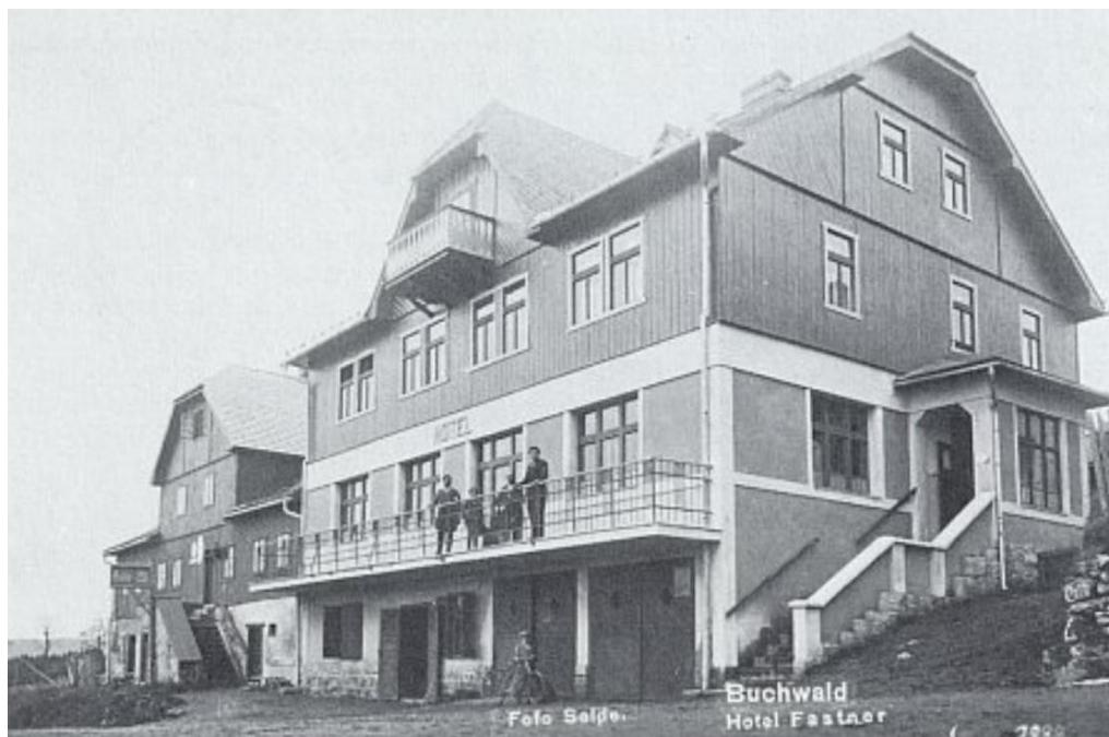
Obrázek 3.3: Hotel Fastner

Aby zde stála česká konkurence tomuto hotelu, vznikla zde také Pešlova chata (viz. obrázek 3.4), která je pojmenována dle svého zakladatele a řadí se k nejmladším hotelům zde.