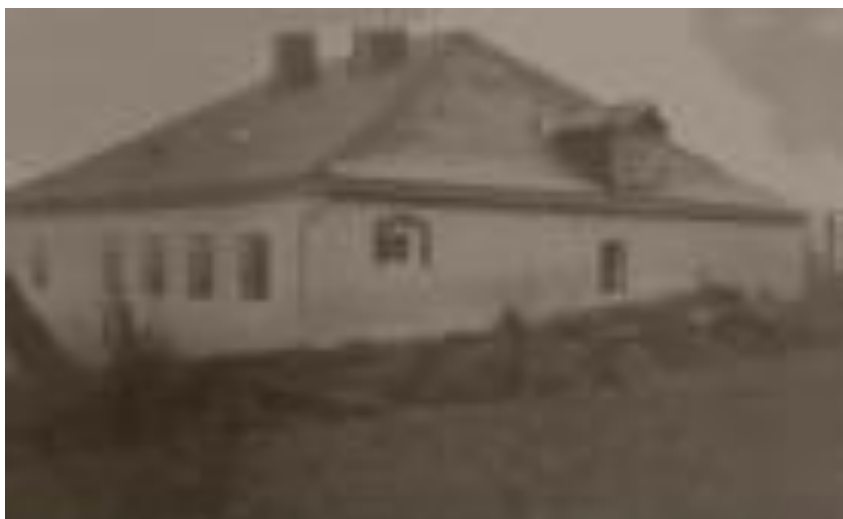
Obrázek 3.2: Škola v zaniklé obci Bučina

K zásadní změně došlo v roce 1867. Tehdy se stala obec Bučina, spolu s Chaloupkami a osadou Na Mlýnské Mýtině, obcí s vlastní samosprávou. S touto změnou přišel i další rozvoj v území. Okolí Bučiny zasáhla kalamita, kdy došlo k velkým škodám v lesích. Aby došlo k rychlému vyčištění lesa, byly najaty další pracovní síly také z ciziny. Cizinci, kterých zde bylo až 400, byli převážně z Tyrolska, ale také z Chorvatska. Někteří z nich zde poté zůstali, díky čemuž došlo k nárůstu obyvatel v území. V době během kalamity v okolí obce Bučina existovalo několik pil, které se využívaly ke zpracování dřeva. Jednalo se o Kufnerovu pilu na Bučině, Seewaldovu pilu v osadě Na Mlýnské Mýtině a Reichardovu pilu v Chaloupkách. V roce 1890 měla Bučina největší počet obyvatel vůbec, kdy zde žilo 466 obyvatel a bylo zde postaveno 30 domů. O rok později zde nechal Michael Fastner vystavit kapli sv. Michala.