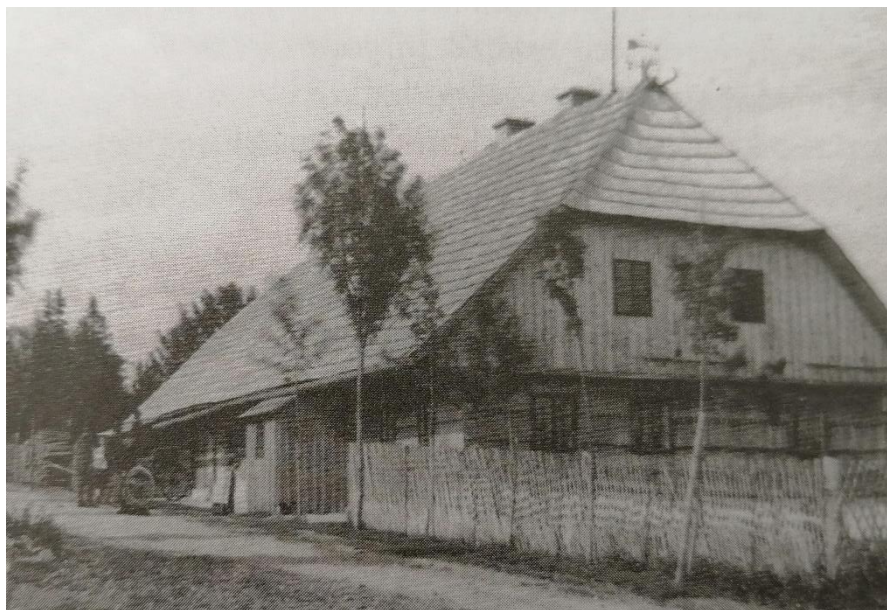
Obrázek 3.1: Myslivna v zaniklé obci Bučina

sv. Janu Křtiteli. V roce 1793 došlo k prvnímu sčítání obyvatel. Na Bučině v této době žilo již 100 obyvatel a bylo zde vystavěno 13 domů. Mezi první domy, které zde byly postaveny, patřila myslivna (viz. obrázek 3.1).