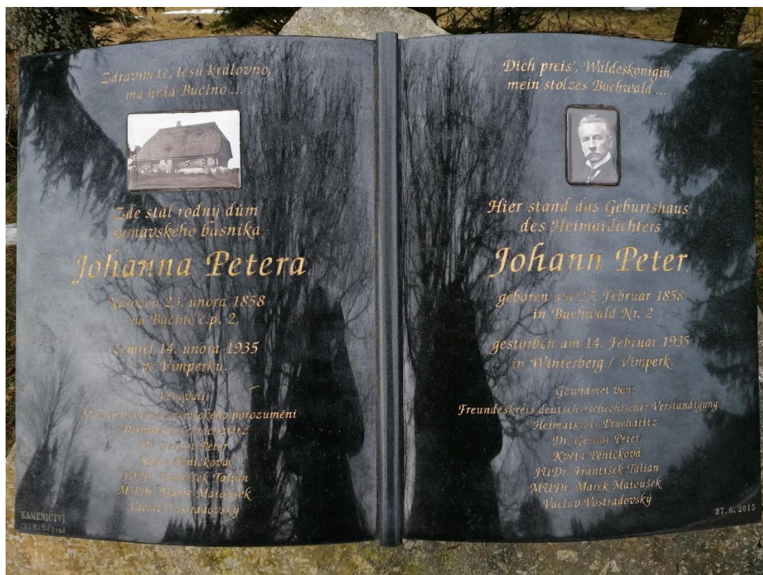
Obrázek 3.11: Pomník věnovaný spisovateli Johannu Peterovi

Oblast Bučiny je velmi vyhledávána turisty, a to nejen pro její zajímavou historii, ale také pro její krásnou přírodu, kdy se lze kochat krásnými pohledy na Alpy. Bučina je pro turisty zpřístupněná pouze pěšky či na kole. V případě zájmu mohou využít „zelené autobusy“, které jedou z Kvildy na autobusovou zastávku v Bučině. Nachází se zde mnoho turistických a cyklistických tras, ale je zde také naučná stezka Národní park. Tato stezka začíná i končí na hraničním přechodu Finsterau – Bučina, kde se nachází první informační panel. Další panely jsou rozmístěny na stezce značené obrázkem motýla. Stezka je dlouhá okolo 7 kilometrů a je zaměřena na bývalé objekty, které v území stály, ale také na zajímavosti hraničního přechodu, železnou oponu či získání informací o Národním parku Šumava a ochranu přírody. Na jedné z pěších tras se nachází krytá studánka, která je v současné době bohužel zanedbaná. V severní části území vybudovala Správa Národního parku Šumava nouzové nocoviště, které lze využít k přespání v přírodě.