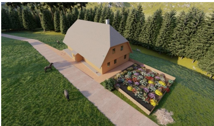
Obrázek 3.12: Vytvořený model domu

Na základě informací o tom, jak dům na Bučině vypadal, vznikl tento 3D model (viz. obrázky 3.12 a 3.13). Jedná se o dům pobitý dřevěnými prkny s kamennou podezdívkou, který má polovalbovou střechu krytou šindelem a předsazený štít. Ze střechy vystupuje komín a na delší straně si lze všimnout vybudovaného závětrí, které chránilo vchod do domu před nepříznivým počasím. Ke stavení náleží také zahrádka, kde lidé pěstovali okrasné květiny či zeleninu.