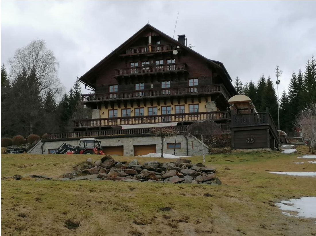
Obrázek 3.9: Hotel Alpská vyhlídka

Pro Bučinu a její přilehlé osady byly také velmi významné pily. Byla to Kufnerova pila na Bučině a Seewaldova pila v osadě Na Mlýnské Mýtině. Tyto pily poskytovaly pracovní místa a v době, kdy byl v lesích kůrovec a bylo potřeba se rychle postarat o nemocné a spadané stromy, tyto pily dřevo zpracovávaly. Poté, co pily zanikly, najdeme na dnes již opuštěných místech, kde dříve stály, pouze jejich pozůstatky, a to v podobě základů těchto staveb, pohozených náčiní či předmětů denní potřeby.