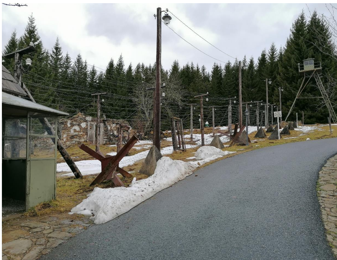
Obrázek 3.10: Replika železné opony

Replika se nachází v těsné blízkosti hotelu Alpská vyhlídka a také nedaleko turistického hraničního přechodu Bučina – Finsterau. Replikou je myšlen prostor dlouhý kolem 100 metrů, který obsahuje prvky železné opony, tedy dvojitý zátaras s ostnatým drátem a uhrabaným pásem zeminy. Vyskytuje se zde také strážní věž s jehlanovými zátarasy. U repliky se nachází informační tabule, která obsahuje informace o studené válce, ale také je zde řada fotografií z té doby. S replikou je spojeno také odpočívadlo, které bylo postaveno pro turisty. Právě zde pokračuje povídání o událostech, které se na tomto místě odehrály.