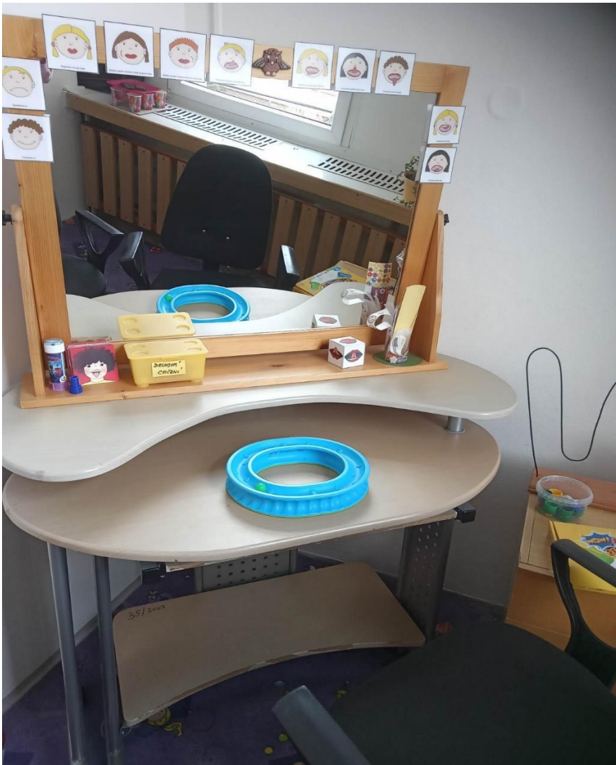
logopedické zrcadlo