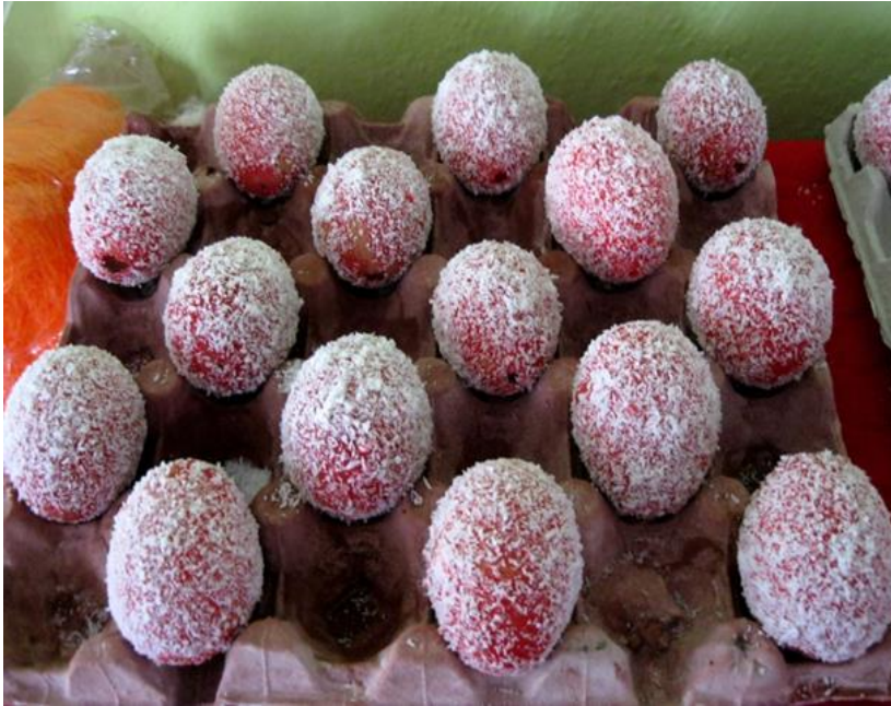
Příloha č. 11 Kokosová vajíčka 37