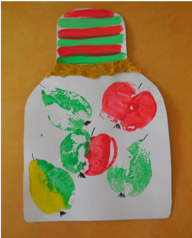
Příloha 3: Kompot 29