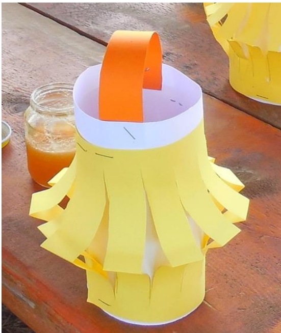
Příloha 4: Lucerna 30