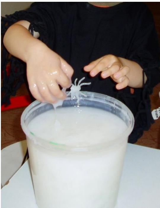
Příloha č. 14 Lovení pavouků ve slizu 40