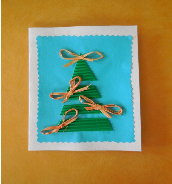
Příloha 5: Vánoční přání 31