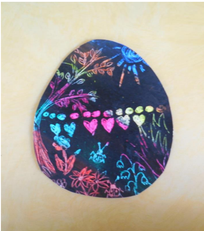
Příloha č. 12 Vosková technika-kraslice 38