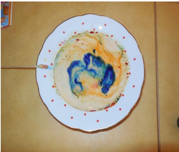
Příloha 6: Kouzlení s mlékem 32