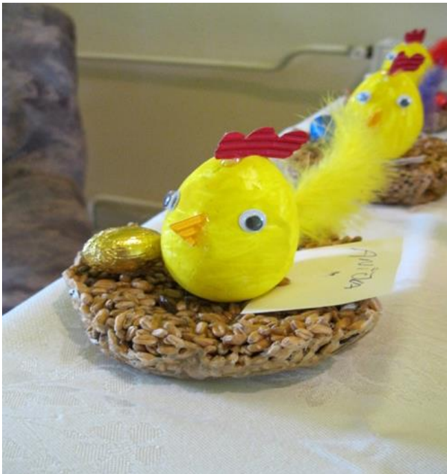
Příloha č. 10 Velikonoční kuřátko 36