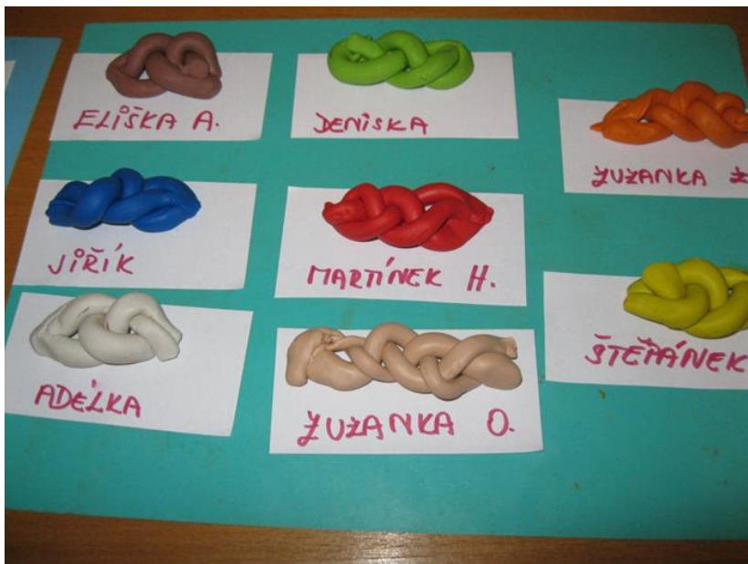
Příloha č. 8 Pletené housky 34