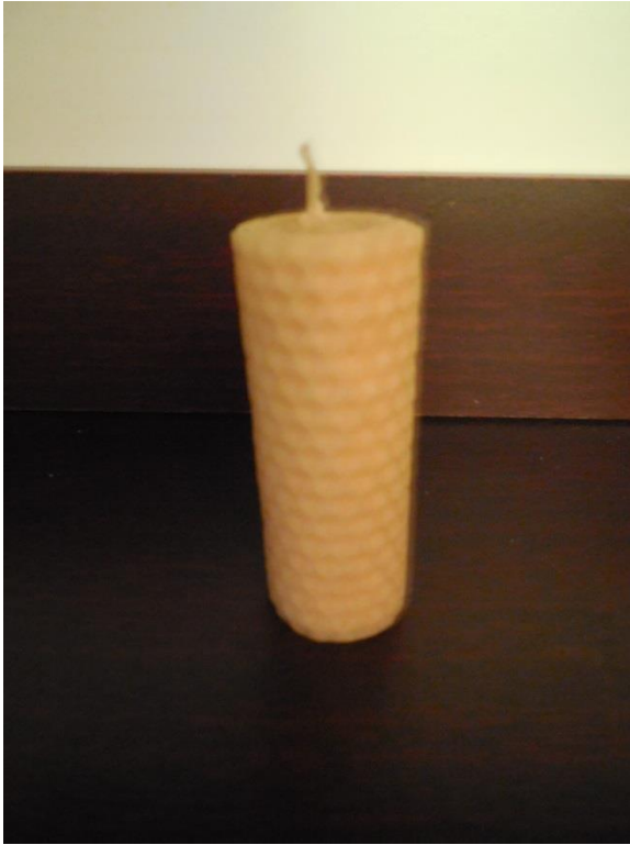
Příloha č. 13 Medová svíčka 39