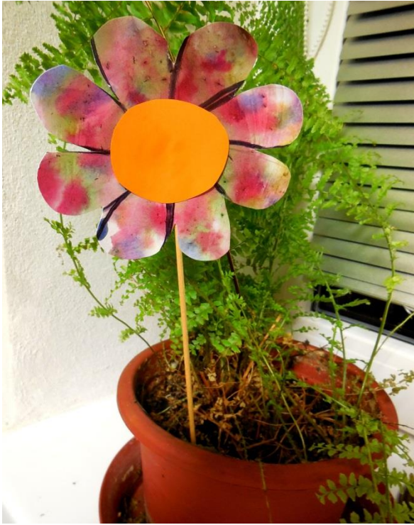
Příloha č. 9 Květinka 35