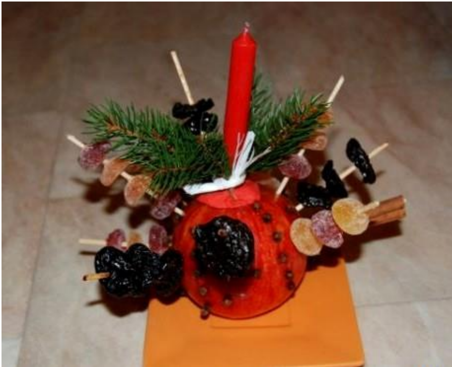
Příloha č. 7 Svícen 33