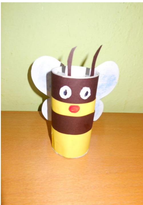
Příloha 1: Včelička 27