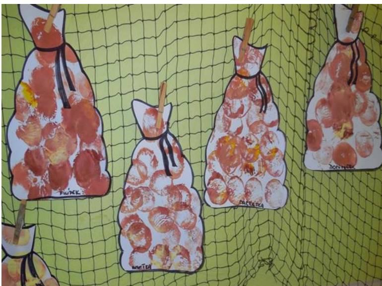
Příloha 2: Pytel brambor 28