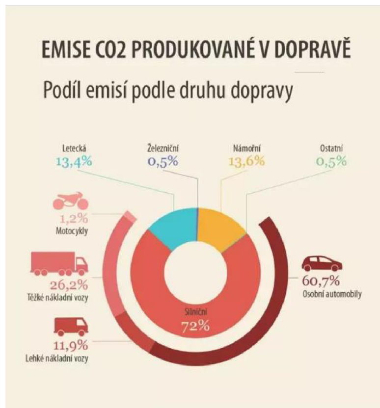
Obr. 4.1 Emise CO 2 produkované v dopravě

Prvním předpisem, který byl přijat Evropskou unií byl předpis EHK (ECC) 15.01, který stanovoval limity emisí na základě městského jízdního cyklu. Limity byly následně zpřísnovány až do přijetí předpisu EHK 15.04, který nabyl platnosti v roce 1982. Tato norma 15.04, je dle dostupných zdrojů označena jako norma EURO 0, respektive se jednalo o tzv. základní normu před přijetím normy EURO 1. Při zavedení normy EURO 1 byla pro výrobce vozidel nutnost použít katalyzátor, který slouží ke sňožování škodlivin vypouštěných z výfukového potrubí. Tato norma byla nařízena v roce 1992. Následné kroky vedly k zavedení normy EURO 2, při které byla platná 40 vteřinová doba běhu motoru na volnoběžné otáčky před započítáním měření. Tato doba však byla zrušena přijetím normy EURO 3 v roce 2000, po jejím zavedení se tedy měří emise okamžitě po nastartování vozidla. K zavedení normy EURO 4 došlo v roce 2005 a ve srovnání s normou EURO 3 byly nařízeny poloviční možní naměřené hodnoty emisí výfukových plynů.