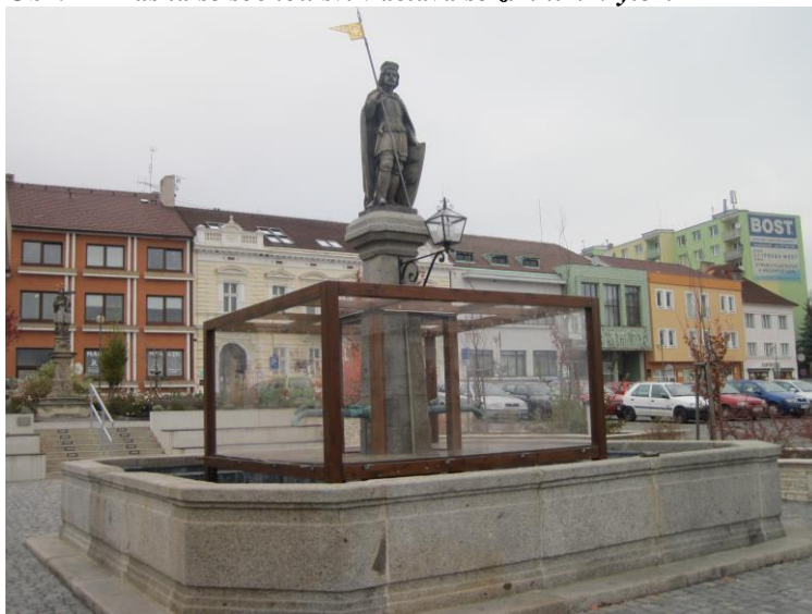
Obr. 11 Kašna se sochou sv. Václava se zimním krytem

Přibližně od listopadu je kašna zazimována ochranným krytem.