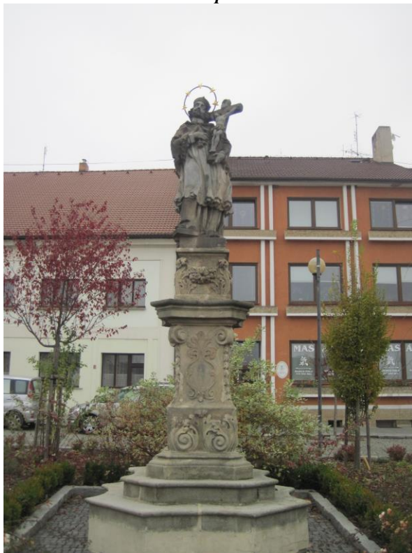
Obr. 12 Socha sv. Jana Nepomuckého

Památka má omšelý povrch a je ve velmi dobrém stavu.