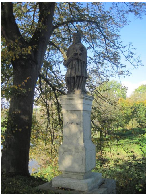
Obr. 7 Socha sv. Jana Nepomuckého

Jedná se již o druhou sochu světce Jana Nepomuckého ve stejné lokalitě. Nachází se u mostu přes řeku Úhlavu na okraji obce Dolní Lukavice, na levé straně u silnice. Socha je z pískovce, v obvyklém postoji s křížem na pravé straně. Sokl je zajímavý, profilovaný a je obílen. V horní části je vyryto datum ANNO 1807.