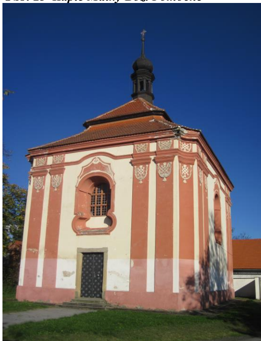
Obr. 15 Kaple Matky Boží Pomocné

V současné době se odlupuje omítka, střešní krytina má viditelné vady. Je potřeba obnovy. Kaple je v uspokojivém stavu.