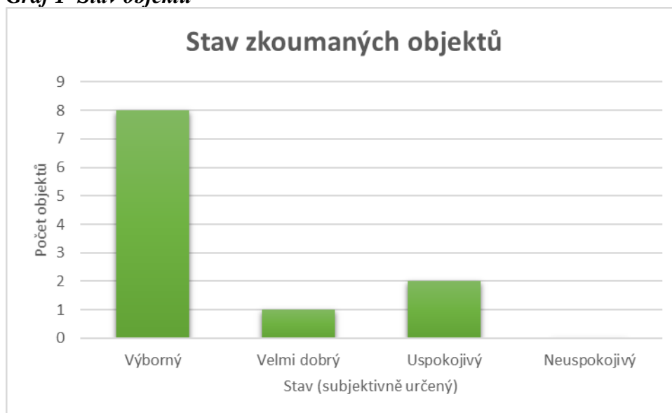
Graf 1 Stav objektů

Výsledný graf znázorňuje stav objektů, které byly popsány a zdokumentovány. Je patrné, že nejvíce objektů je ve výborném stavu. Jedna kulturní památka byla označena stavem velmi dobrým. Nejhorší výsledné ohodnocení získaly dvě památky, jedná se o stav uspokojivý.