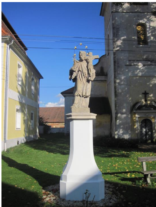
Obr. 5 Socha sv. Jana Nepomuckého

Socha prošla rekonstrukcí v roce 2013, je ve výborném stavu. Financování bylo zajištěno z dotací ministerstva zemědělství.