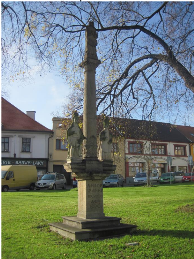
Obr. 10 Mariánský sloup v Přešticích

Na dvou schodech je položen podstavec z pískovce ve tvaru hranolu, nese desku, která ve výšce asi 140 cm nese na každé straně sochu. Vlevo socha sv. Václava, vpravo sv. Vojtěcha. Mezi sochami svatých je vztyčen hladký sloup s hlavicí a na ní postavena socha Panny Marie s kovovou svatozáří.