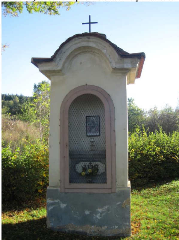
Obr. 9 Výklenková kaplička sv. Jana Nepomuckého

Stav objektu je uspokojivý. Omítka na soklu a v horní části kaple nese známky poškození.