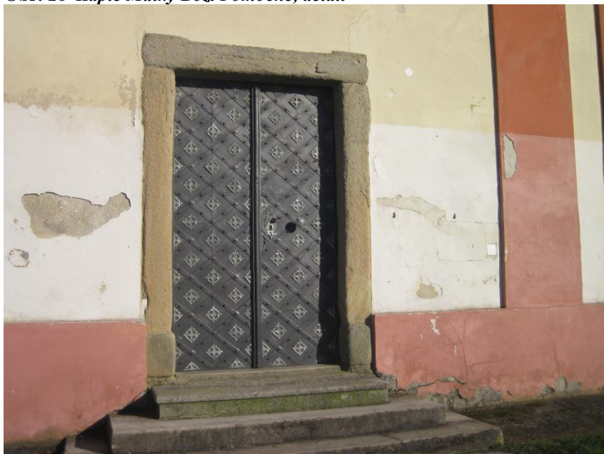
Obr. 16 Kaple Matky Boží Pomocné, detail

Kaple ve vlastnictví obce Chlumčany je kulturní památkou. Její rekonstrukce proběhla naposledy v letech 1993-1994, nebyla příliš zdařilá. Na spodní část stavby byla použita speciální nepropustná malba, která časem zesvětlala oproti ostatnímu nátěru. V okolí stavby byla instalována dlažba, která není propustná. Jedná se o nevhodný a neodborný přístup k historické stavbě, který nerespektuje původní systém odvlčení stavby. V interiéru kaple dochází k odlupování omítky, střešní trámy začínají uhnívat.