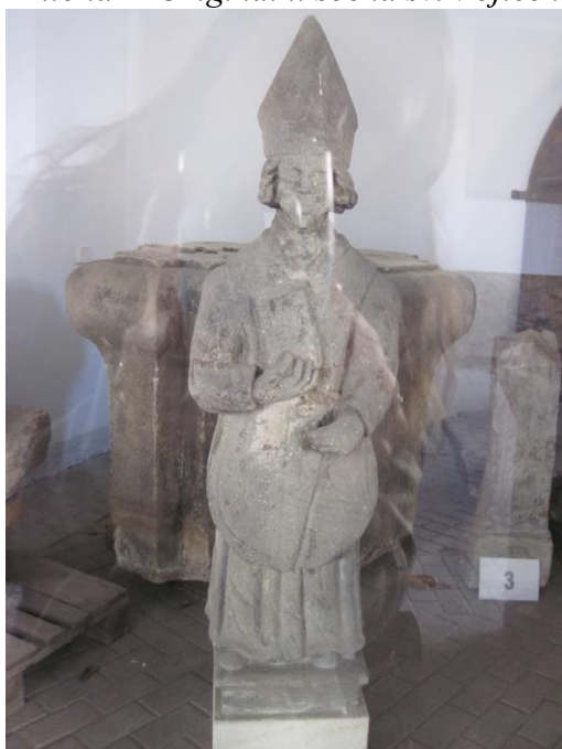
Příloha 4 Originální socha sv. Vojtěcha v depozitáři