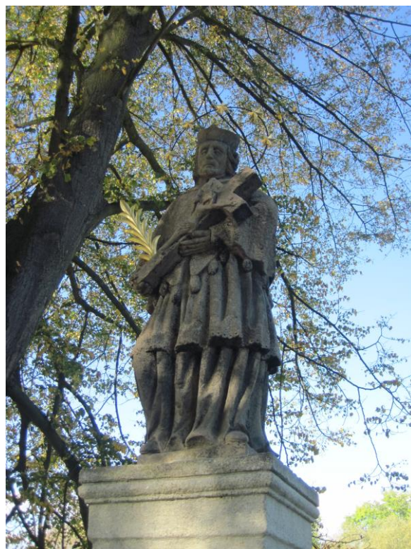
Obr. 8 Socha sv. Jana Nepomuckého