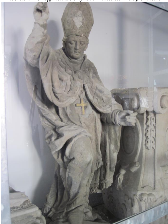
Příloha 3 Originál sochy sv. Kiliána v depozitáři