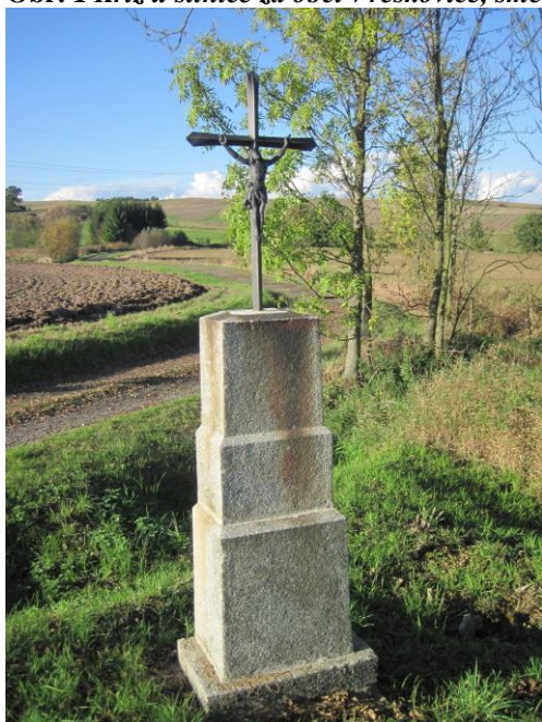
Obr. 1 Kříž u silnice za obcí Vřeskovice, směrem na obec Borovy

Kromě dřeva jsou kříže vyráběny z různých dalších materiálů, například mramor, žula, slitiny kovů.