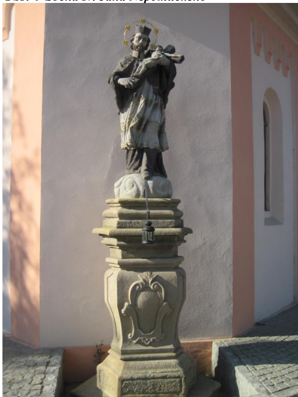
Obr. 4 Socha sv. Jana Nepomuckého

Socha musela projít v nedávné době rekonstrukcí, důvodem byla dopravní nehoda, která se stala v roce 2012. Plastika byla sražena z podstavce a rozlomena na několik částí. 49