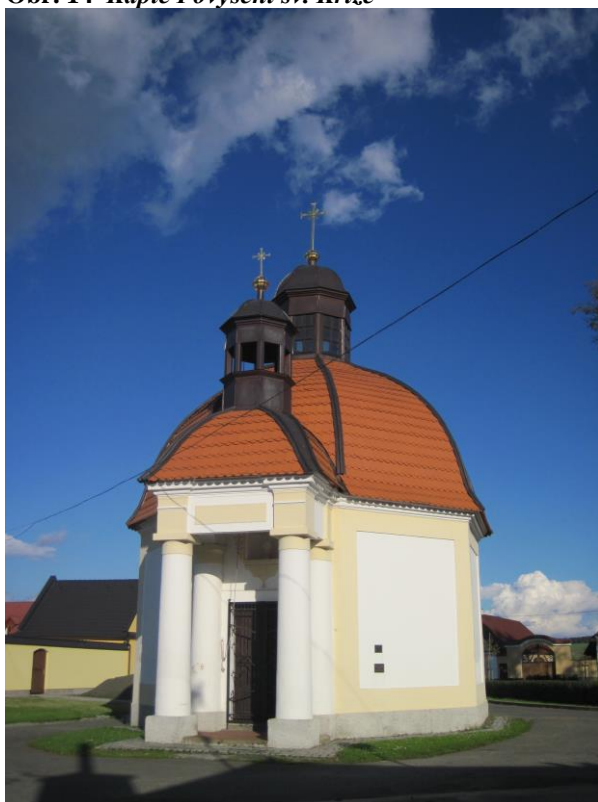
Obr. 14 Kaple Povýšení sv. Kříže

Uvnitř je umístěn oltář s ukřižovaným Ježíšem Kristem. Před ním ze stropu visí nádoba na kadidlo. Na oltář navazuje dřevěný stupínek. Stěny zdobí několik obrazů s náboženskou tematikou. Kaple je ve výborném stavu.