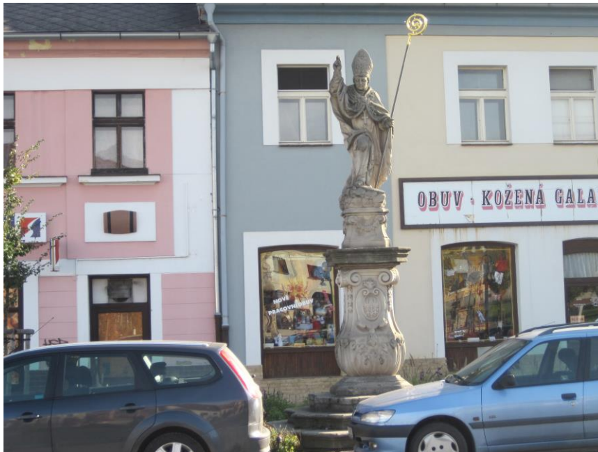
Obr. 13 Socha sv. Kiliána