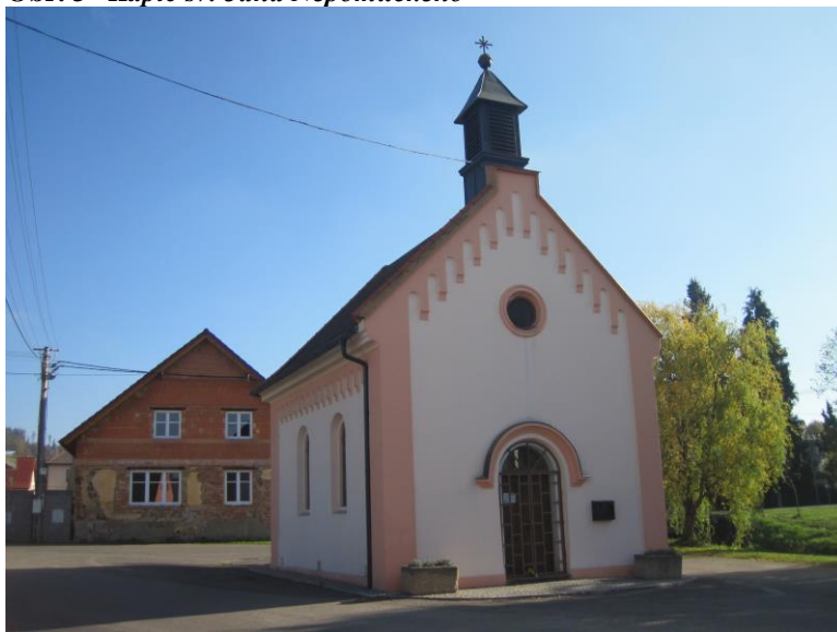
Obr. 3 Kaple sv. Jana Nepomuckého