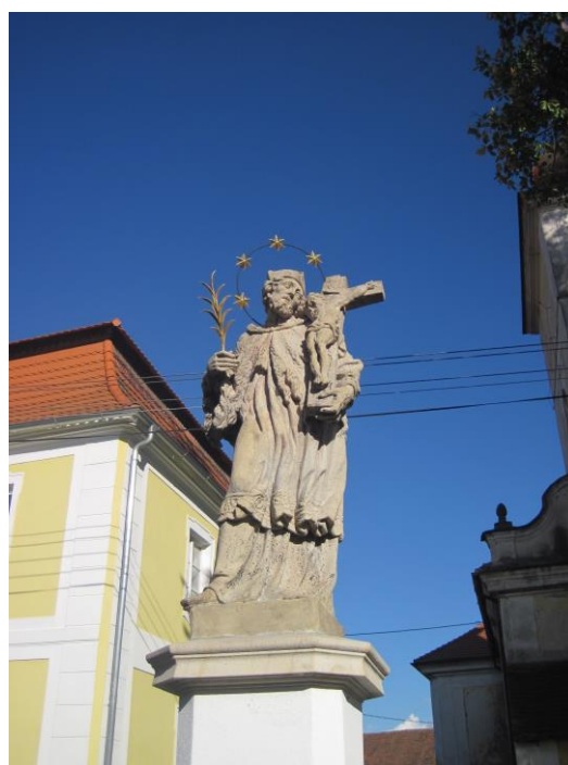
Obr. 6 Socha sv. Jana Nepomuckého