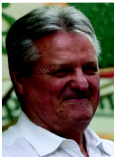
VEDOUCÍ PRÁCE SUPERVISOR