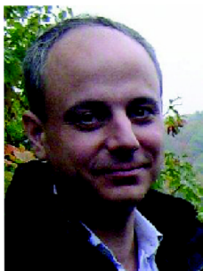
ŠKOLITEL SPECIALISTA CO-SUPERVISOR