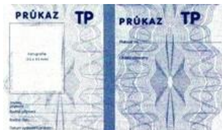
Obrázek č. 1: Průkaz mimořádných výhod TP 43

Uvádíme, vzory průkazů mimořádných výhod. Držitelé těchto průkazů mají povinnost zažádat o výměnu těchto průkazů a to nejpozději do konce roku 2015.