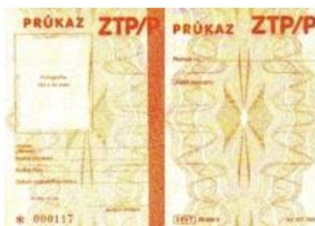
Obrázek č. 4: Průkaz mimořádných výhod ZTP/P 45