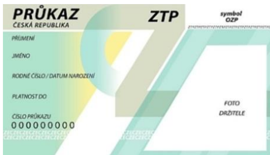
Obrázek 4: Průkaz OZP 72

Následuje ukázka průkazu. Jedná se o novou podobu, kterou do konce roku 2015 budou mít všechny OZP.