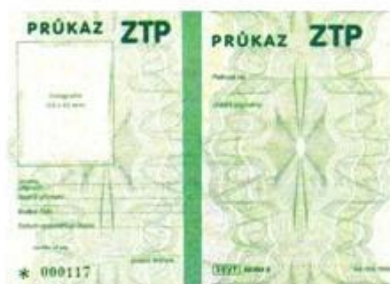
Obrázek č. 2: Průkaz mimořádných výhod ZTP 44