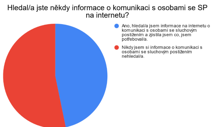
Graf č.3: Vyhledávání informací na internetu

Zajímavým jevem je, že ačkoli by se dalo očekávat, že respondenti, kteří absolvovali nějaké školení, budou spíše připravenější, a většina dat tomuto předpokladu také odpovídá až na kategorii odpovídající znalostem na pomezí jistoty a nejistoty v dovednostech komunikace s klienty se sluchovým postižením.