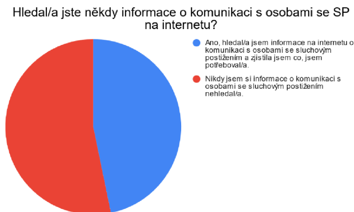
Graf č.3: Vyhledávání informací na internetu

Zajímavým jevem je, že ačkoli by se dalo očekávat, že respondenti, kteří absolvovali nějaké školení, budou spíše připravenější, a většina dat tomuto předpokladu také odpovídá až na kategorii odpovídající znalostem na pomezí jistoty a nejistoty v dovednostech komunikace s klienty se sluchovým postižením.