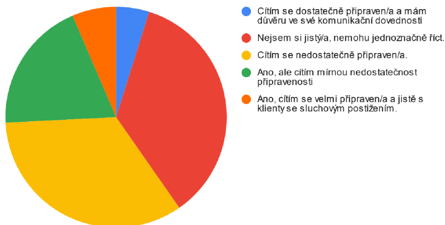
Graf č.1: Připravenost na komunikaci s klienty se sluchovým postižením

Na dotaz v šetření, zda se respondenti cítí dostatečně připraveni na komunikaci s klienty se sluchovým postižením odpovědělo celkem 32% respondentů, že jsou připraveni na tuto komunikaci, ale 66% z nich si je ale vědoma nedostatků v jejich připravenosti. Celých 35% dotazovaných si buď nebo jistých svou připraveností a nebo se ji neodvážila hodnotit.