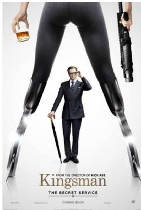
Obrázok 1: Plagát ku Kingsman: The Secret Service .

Niektoré propagačné materiály taktiež prispeli k ironickému dojmu, ktorý filmy Kingsman vyvolávajú vo vzťahu k bondovkám . Jeden z plagátov k prvej kingsmanovke sa nápadne podobá na starý plagát k filmu For Your Eyes Only (1981). Ide o graficky jednoduché plagáty, jeden so starším agentom ( Kingsman ) a druhý s protagonistom ( James Bond ) stojacim v strede pod ženskými nohami, pričom ženská postava drží v pravej ruke strelnú zbraň (viď obrázok 1 a obrázok 2).