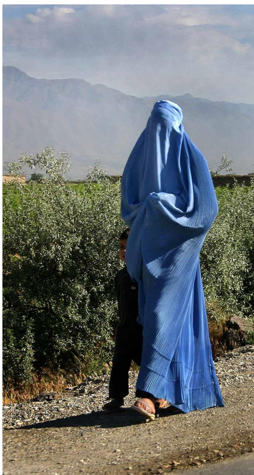
Obrázek 2 Žena v burce 8

Hnutí bylo z počátku velice populární a počet jeho bojovníků rostl.