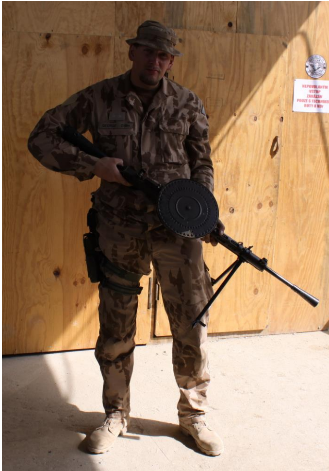
Obrázek 6 Kořistní DP – 28 Děktarjev 19

granát RPG – 7, kulometry DŠK a PKT a různé druhy protitankových a protipěchotních min. Dále pak minomety malých a středních ráží (často vezené na vozidlech) a menší neřízené rakety různých velikostí. Ze zbraní české výroby lze narazit na Sa vz. 58, UK vz. 59 a pistole CZ vz. 52, 82 a 75. Zbraně, kterými Taliban disponuje, jsou srovnatelné s těmi, jaké používá i afghánská armáda. Ve velké míře bylo využito také vyžito trhavin, zejména domácí výroby.