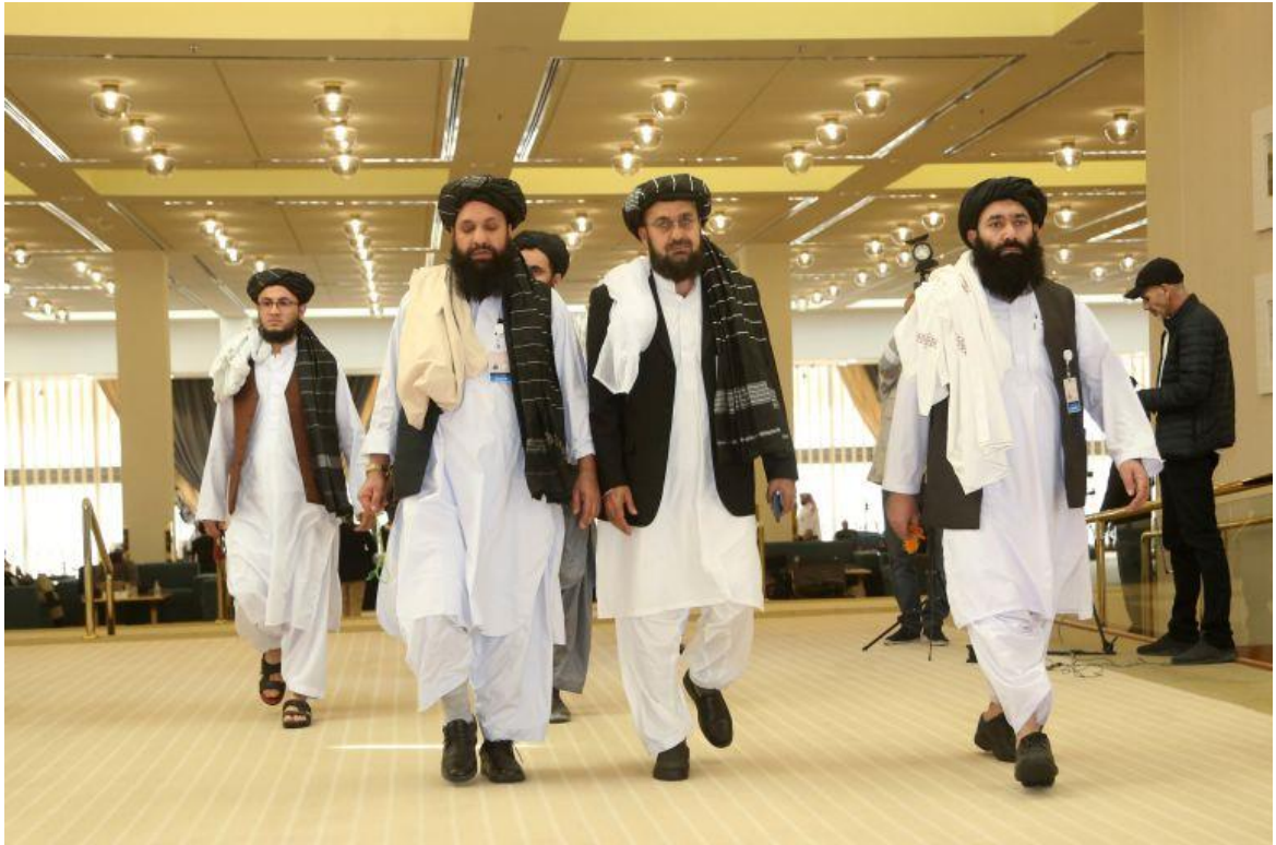
Obrázek 8 Afghánská vláda na konferenci v Oslo 28

Nová afghánská vláda se při své lednové návštěvě Osla 29 zavázala k opětovnému zpřístupnění vzdělání a práce pro dívky a ženy, což je významný rozdíl v porovnání s přístupem, praktikovaným v době jejich první vlády v Afghánistánu. Zároveň požádala o humanitární pomoc pro miliony Afghánců v nouzi.