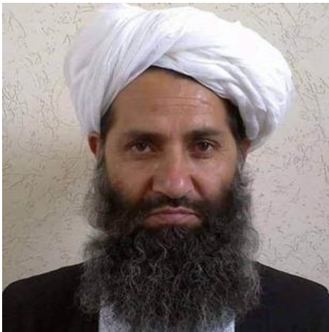
Obrázek 4 Hibatullah Akhundzada 13

Po stažení spojeneckých vojsk a znovu převzetí moci Talibanem v září 2021 došlo k vyhlášení Islámského emirátu Afghánistán a transformaci organizace čímž se její organizační struktura změnila. V současnosti je vůdce hnutí současně i úřadujícím prezidentem emirátu. Dále je ve vedení státu premiér a tři vicepremiéři viz obrázek 5.