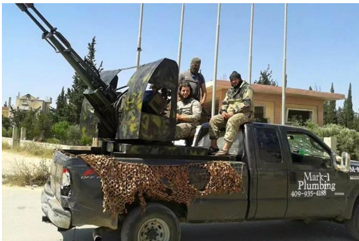
Obrázek 7 Americký Ford F250 ve službách ISIS 22

organizace ISIS objevilo americké vozidlo Ford F250, které mělo stále na dveřích reklamní nápisy americké instalatérské firmy z Texasu, včetně telefonního čísla. 21 Bylo zjištěno, že původní majitel auto prodal firmě, která ho následně prodala v aukci. Vozidlo bylo následně odesláno kupujícímu. Přes další prodejce se pak podle všeho dostalo do rukou teroristů. Předpokládá se proto, že Taliban při obstarávání vozidel postupuje obdobným způsobem.