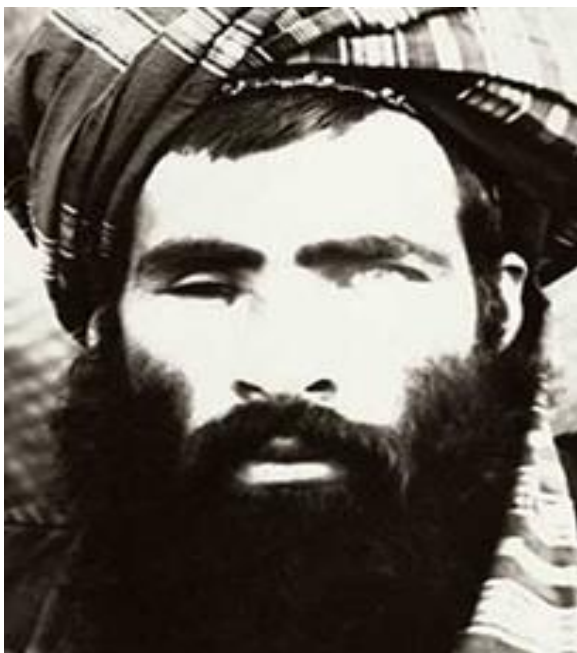
Obrázek 1: Mullah Mohammed Omar 6

Taliban byl za skryté podpory Pákistánské vlády založen na počátku 90. let jako skupina, která měla za úkol bránit Pákistánské konvoje v afghánských horách proti skupinkám afghánských mudžahedínů 3 . Skupinu založil klerik Mullah 4 Mohammed Omar a byla rekrutována z militantních studentů Islámu. Studenti náboženských škol nazývaných Madrass, se pod jeho vedením zhostili tohoto úkolu. Skupina dostala název Taliban (طالبان), což je v jazyce Paštu 5 výraz pro „studenty“. Paštunové jsou v Afghánistánu převládající etnickou skupinou na jihu a východě země. Jsou také významnou etnickou skupinou na severu a západě Pákistánu.