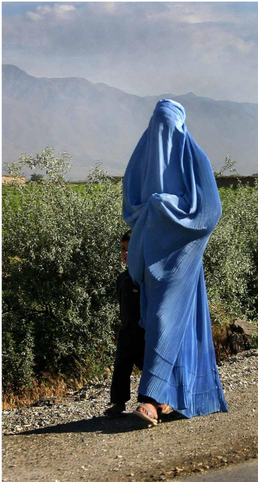
Obrázek 2 Žena v burce 8

Hnutí bylo z počátku velice populární a počet jeho bojovníků rostl.