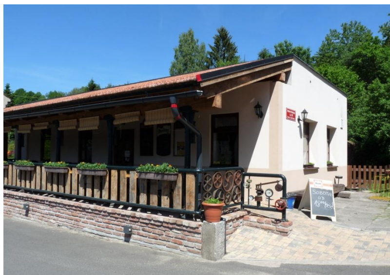
Obrázek 19 - Hostinec „Podmošnou“