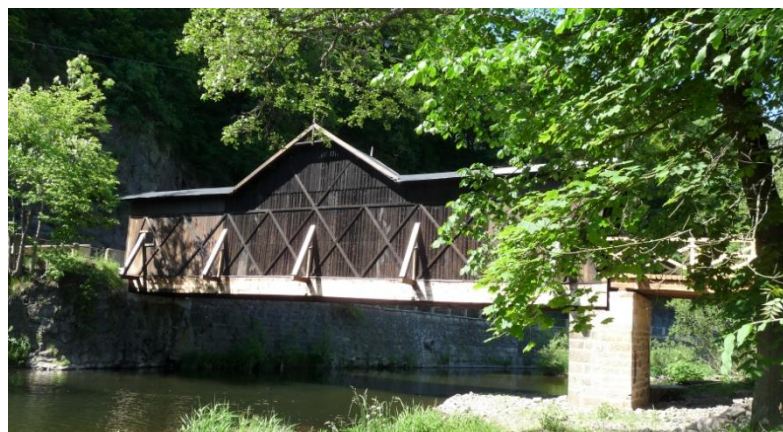
Obrázek 9 - Dřevěný krytý most přes řeku Jizeru