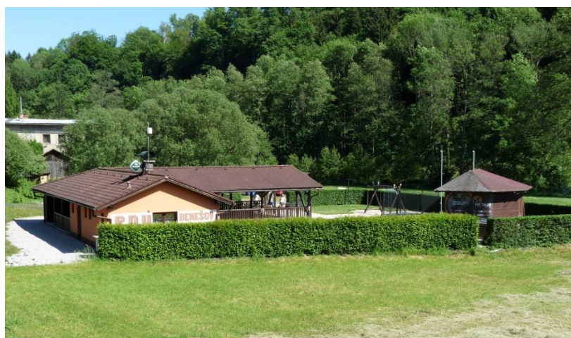
Obrázek 13 - Hasičský areál Podolí