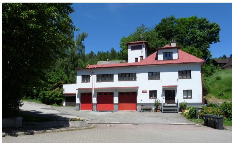
Obrázek 12 - Hasičská zbrojnice