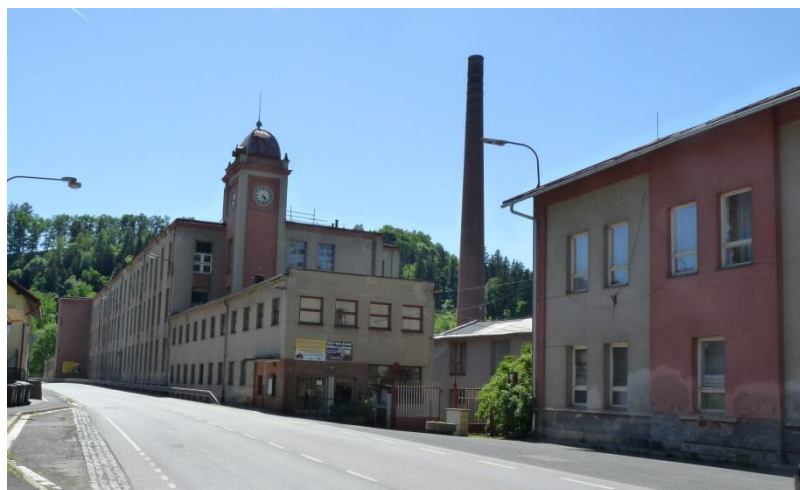
Obrázek 17 - Bývalý textilní závod "Pod Mošnou"