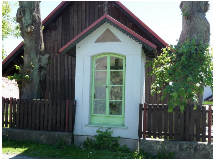
Obrázek 6 - Výklenková kaplička 2