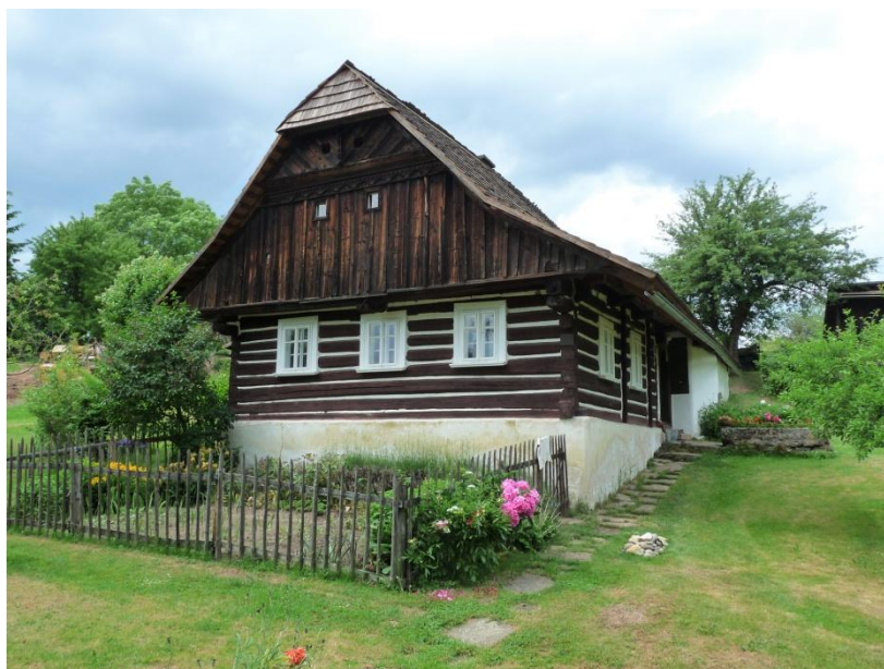
Obrázek 11 - Jedno z roubených stavení