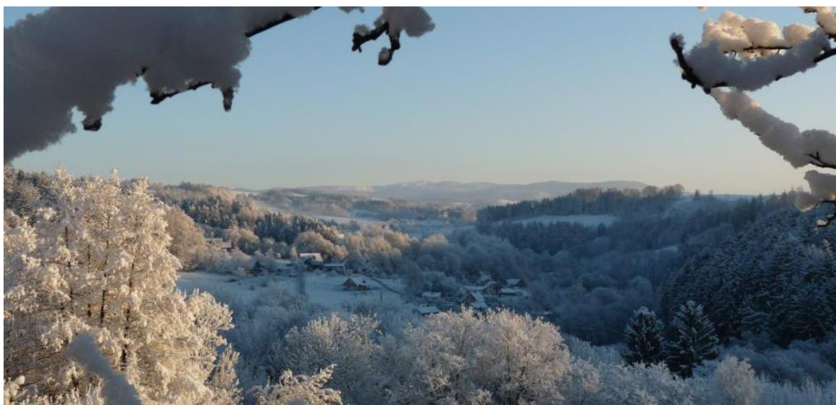
Obrázek 4 - Výhled z Benešova u Semil na Krkonoše (zdroj: foto archiv autorky)

(zdroj: Seznam.cz: Mapy. In: Mapy.cz [online]. OpenStreetMap, 2016 [cit. 2017-06-03]. Dostupné z: https://mapy.cz/zakladni?x=15.3524695&y=50.6101696&z=14&l=0&base=ophoto&source=muni&id=2703 )