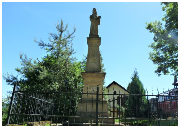
Obrázek 7 - Pomník Mistra Jana Husa