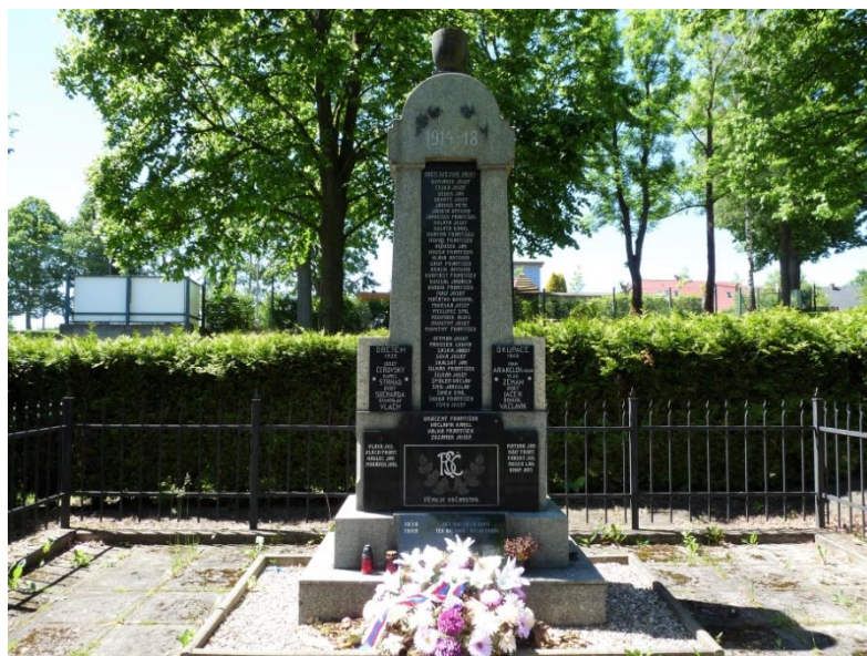
Obrázek 8 - Pomník obětem světových válek a komunismu