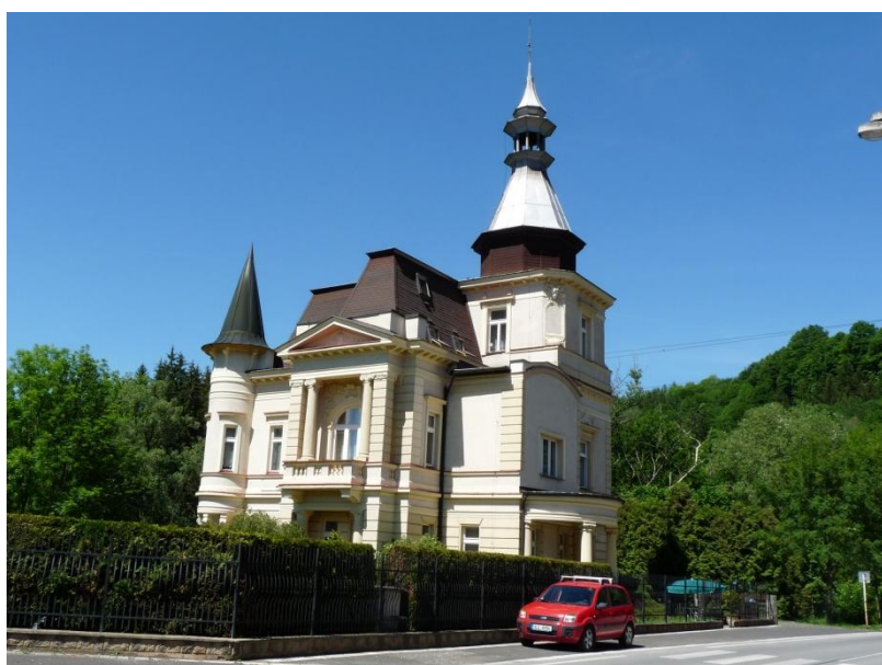
Obrázek 16 - Sídlo Služeb sociální péče Tereza