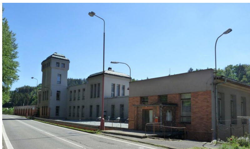
Obrázek 18 - Bývalý textilní závod "Hradišřata"