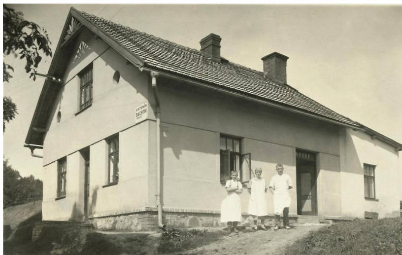
Obrázek 21 - Pekařství Antonín Bachtík