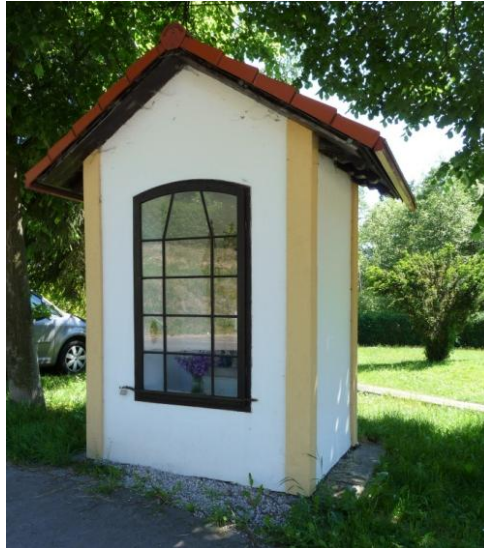
Obrázek 5 - Výklenková kaplička 1