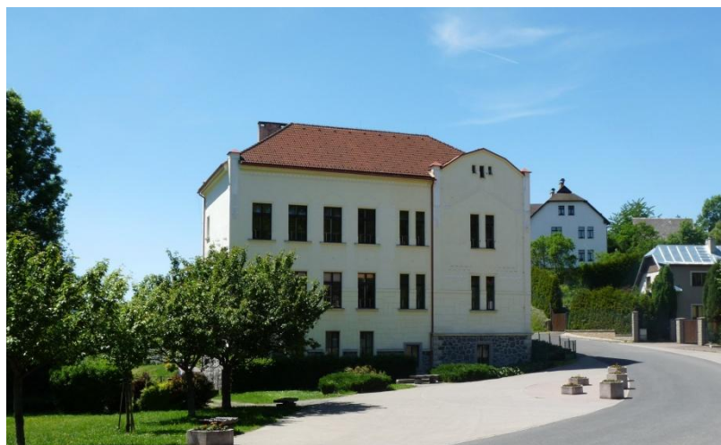
Obrázek 14 – Škola