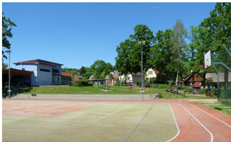
Obrázek 15 - Sportovní areál