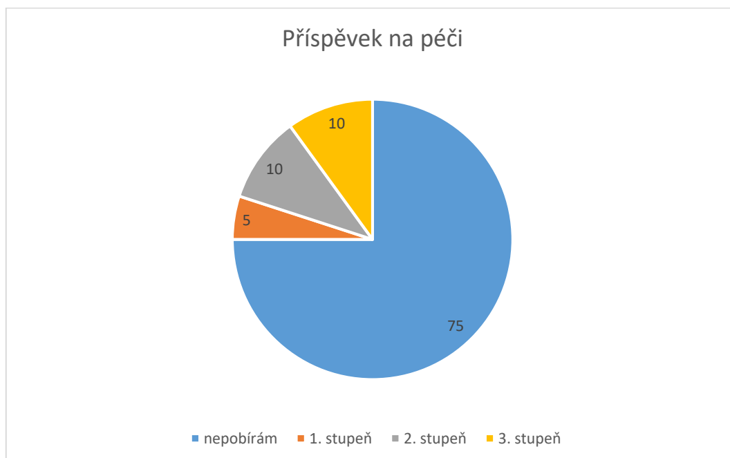
Graf č. 2

O služby denního stacionáře projevilo zájem 30 % respondentů, zatímco o služby týdenního stacionáře pouze 3 %. Odpověď „nevím“ uvedlo u denního stacionáře 21 % a u týdenního 33 % respondentů.