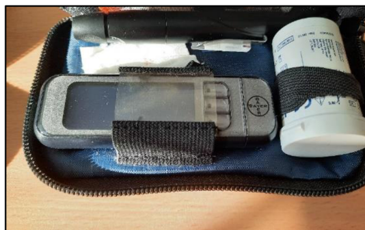
Obrázek 7 – Set žáka Zdroj – vlastní zpracování

Pokud žák onemocní cukrovkou před nástupem do školy, bylo by vhodné informovat paní učitelku o potřebách, které má s cukrovkou. Informační leták s instrukcemi o hyperglykémii a hypoglykémii, aplikaci inzulínu a jiné. by měl zákonný zástupce dodat škole před nástupem. Rodina by se měla domluvit se školní jídelnou, zda budou ochotni jídlo vydat předčasně a navázat přesné množství. Žák by měl každý den nosit tašku s potřebným materiálem (glukometr, dokrmy a pero). Také má malou taštičku, kde se nachází potřebné věci ke každodennímu životu diabetika (obrázek 7).