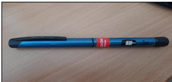
Obrázek 2 – Inzulínové pero

Glukometr je přístroj, který umožňuje měření glykémie. „V současnosti je měření založené na převedení množství cukru v kapce krve na elektrický impulz“. (David Neumann, 2017, str.41) Do glukometru se zasune proužek, který má v sobě napuštěn měřící enzym. Všechna měření glykémie se ukládají do paměti glukometru. Na diabetologické kontrole si doktor může tyto měření prozkoumat, protože glukometry mají v sobě Bluetooth nebo přes USB kabel.