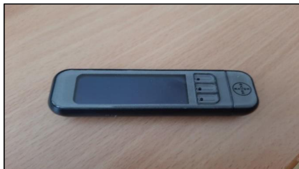
Obrázek 3 – Glukometr

Selfmonitoring v českém překladu znamená vlastní kontrola. K úspěchu léčby je nutná znalost povinností při glykémii.