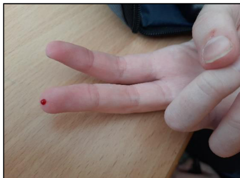
Obrázek 6 – Vpich do prstu

na prostředníčku nebo prsteníčku (obrázek 6). Prst se nedezinfikuje, protože to může zkreslovat hodnoty. prst se umyje mýdlem. Kapka krve je přiložena na připravený proužek. Žák se měří sám, pokud se necítí dobře, při sportovních aktivitách (po intenzivním výkonu se měří v noci častěji) nebo když se nachází ketolátky v moči. (Neumann, 2017)