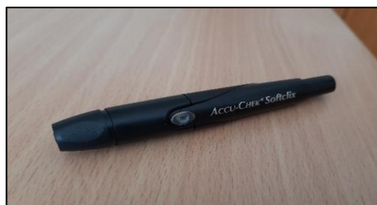
Obrázek 4 – Autolanceta

Při měření glykémie se používají měřící proužky (obrázek 4). Pokud žák chce lepší hodnoty glykémie, tak se denně přeměřuje (např. 6x denně). Jinak se tento způsob používá pouze při názaku hypoglykémie nebo hyperglykémie. Zjišťuje se to pomocí vpichu do prstu pomocí autolancety (obrázek 5). Vpich do prstu bývá nejčastěji prováděn