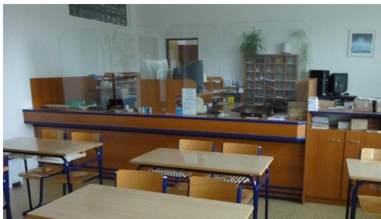
Obr. 7 Učebna praktického vyučování

Výuka oboru Logistické a finanční služby probíhá ve speciálně upravených učebnách tzv. dílnách (obr. 7). Učebna je uzpůsobena jak k teoretické výuce, tak k praktickým činnostem prováděnými žáky.