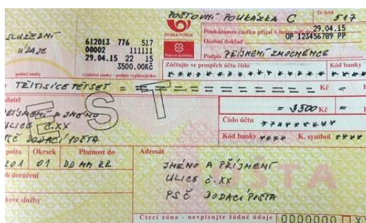
Obr. 8 Vzor poštovní poukázky vytvořené žáky v praktickém vyučování