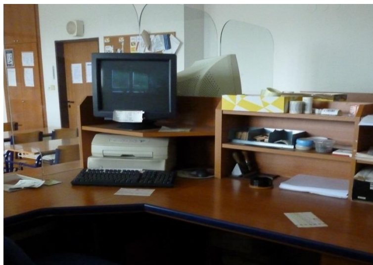
Obr. 12 Ukázka poštovní přepážky pro výplaty poštovních poukázek

Popis: učitel praktického vyučování rozdělí žáky na 2 pracovní skupiny tak, aby obě viděly, na předváděnou činnost u přepážky (obr. 12).