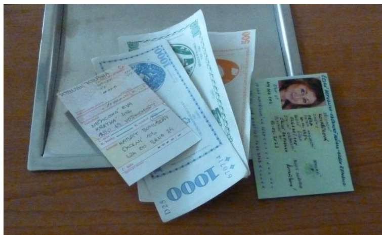
Obr. 13 Dokončení výplaty poštovní poukázky

Učitel praktického vyučování kontroluje postupně práci žáků u přepážek, opravuje nepřesnosti.