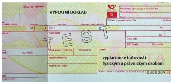
Obr. 6 Vzor výplatního dokladu pro hotovostní výplaty poukázek B, C, D