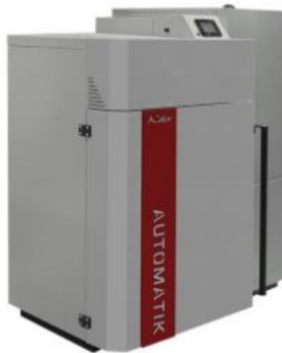
Obrázek 7 Kotel na biomasu/peletky [4]

Stejně jak u plynového kotle, kotel na dřevěné peletky spaluje topný materiál a předává vzniklé teplo do topné vody, která je následně rozvedena po objektu nebo do zásobníků teplé vod. Ke kotli na biomasu je vhodné instalovat akumulční zásobník tepla a to z důvodu, že tento kotel nedokáže spínat podle potřeby.