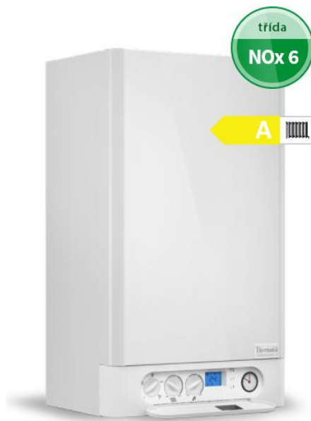
Obrázek 3 Nástěnný plynový kondenzační kotel. [2]

Plynové kotle se nechají dělit podle umístění na stacionární a závěsné. Rozdíl je spíše ve vzhledu a velikosti, kde stacionární kotle nahrazují starší modely v kotelnách, zatím co závěsné bývají často prostorově úspornější a vzhledově přitažlivější, protože často bývají součástí interiéru.