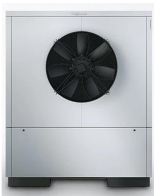
Obrázek 5 Tepelné čerpadlo vzduch/voda. [3]

Tepelné čerpadlo získává energii z venkovního vzduchu a získané teplo pak využívá k ohřevu vody v topném systému. Tepelná čerpadla nejčastěji používají k pohonu kompresor. Pracuje na principu Carnotova cyklu, který je obrácený. Kompresor stlačuje chladivo a pak je puštěno do kondenzátoru, kde odevzdá své skupenské teplo a zkondenzuje. Zkondenzované chladivo je vpuštěno přes expanzní trysku do výparníku, zase skupenské teplo přijme a následně dojde k odpaření. Následně se chladivo vrací zpět do kompresoru a proces se opakuje.