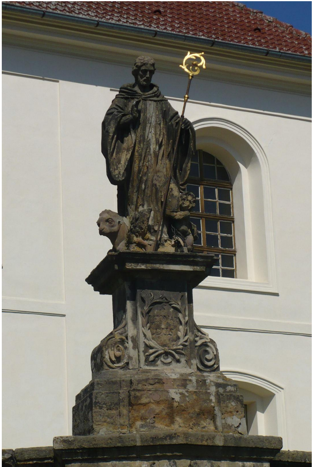
11. Sv. Leonard