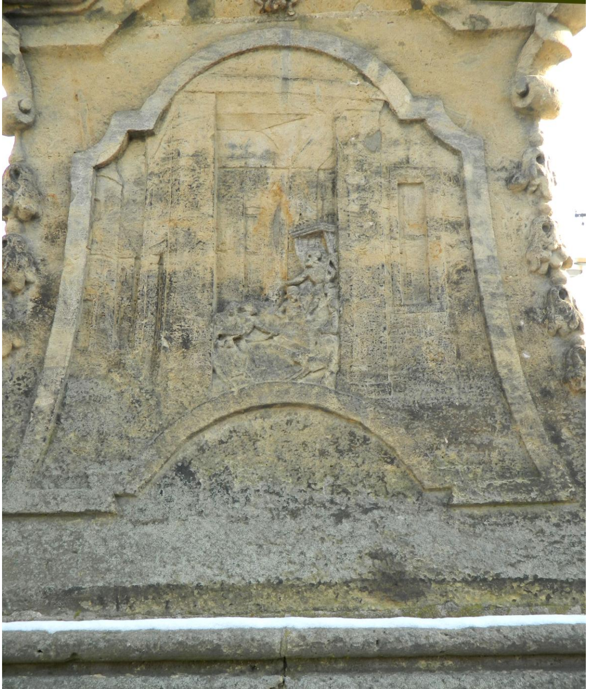
7. Sv. Jan Nepomucký je vyslýchán králem Václavem IV.