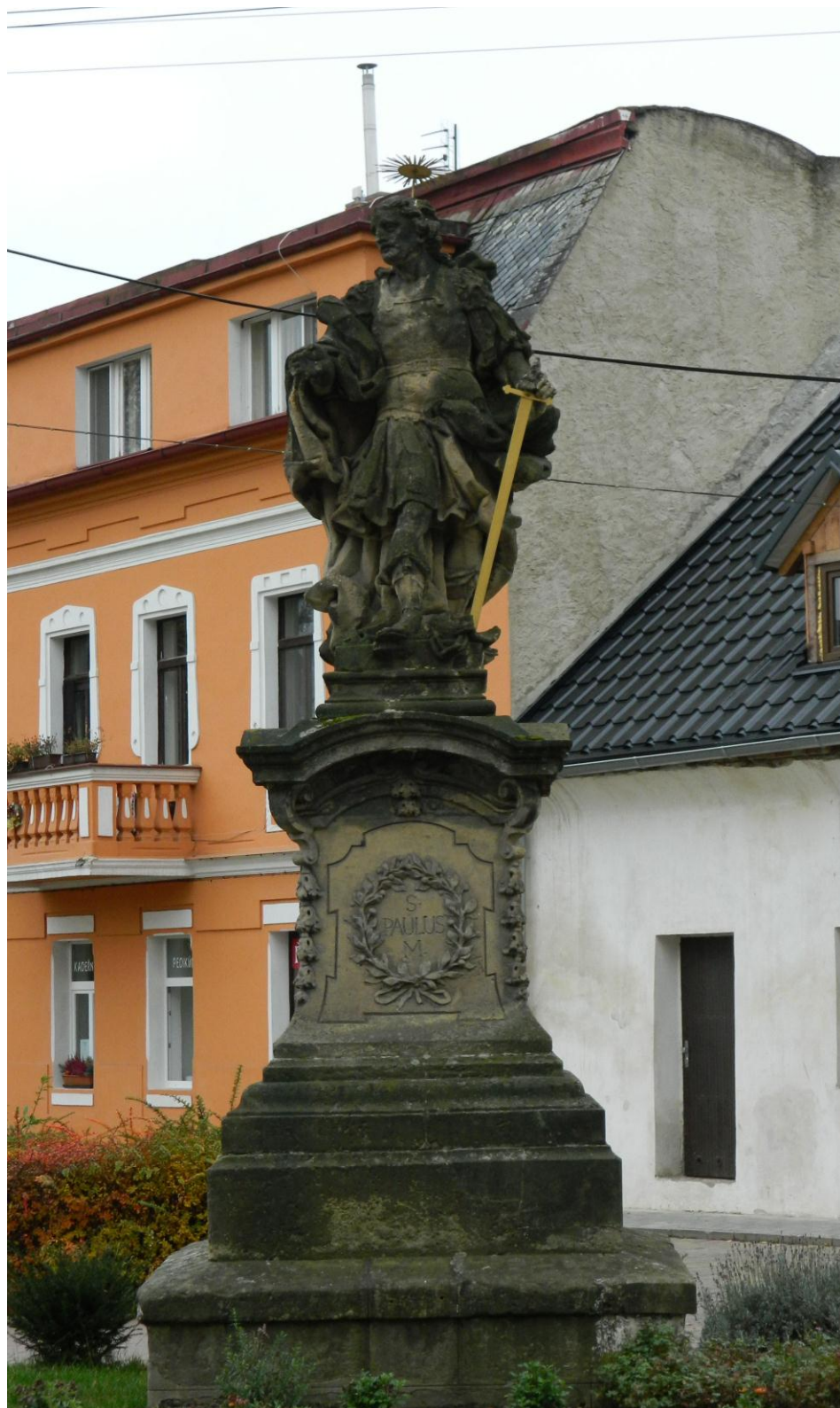
9. Sv. Pavel Mučedník