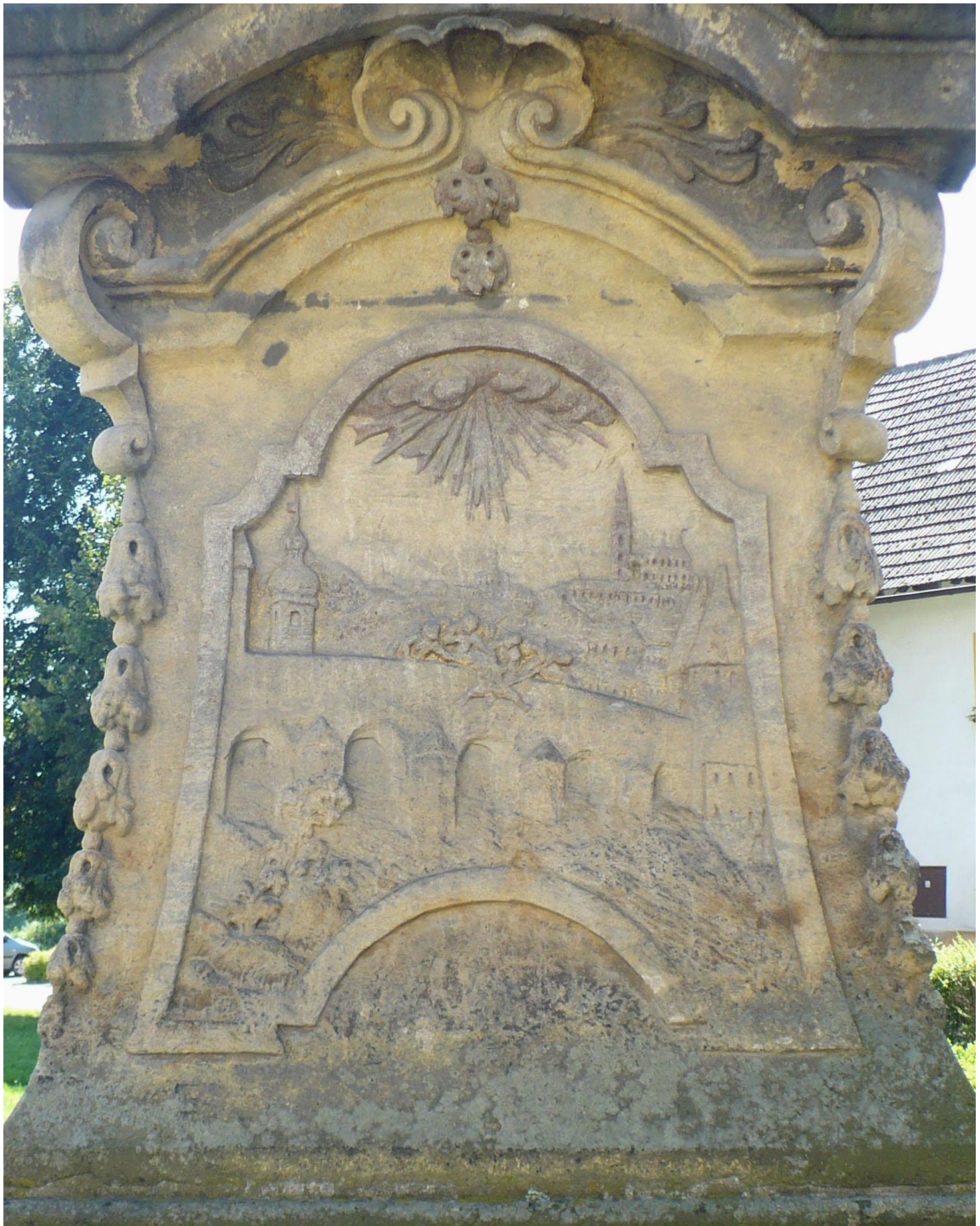
6. Sv. Jan Nepomucký je svržen z Karlova mostu