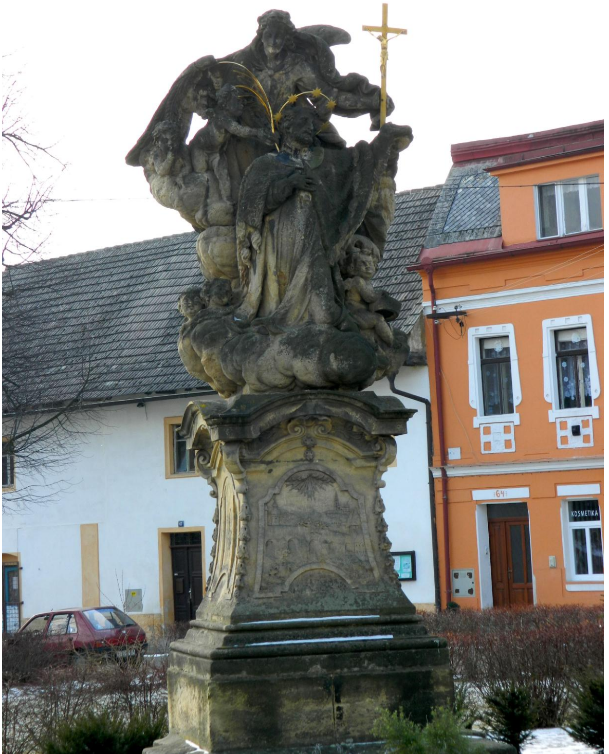
4. Sv. Jana Nepomucký mezi anděly: tzv. svatojánské oratorium