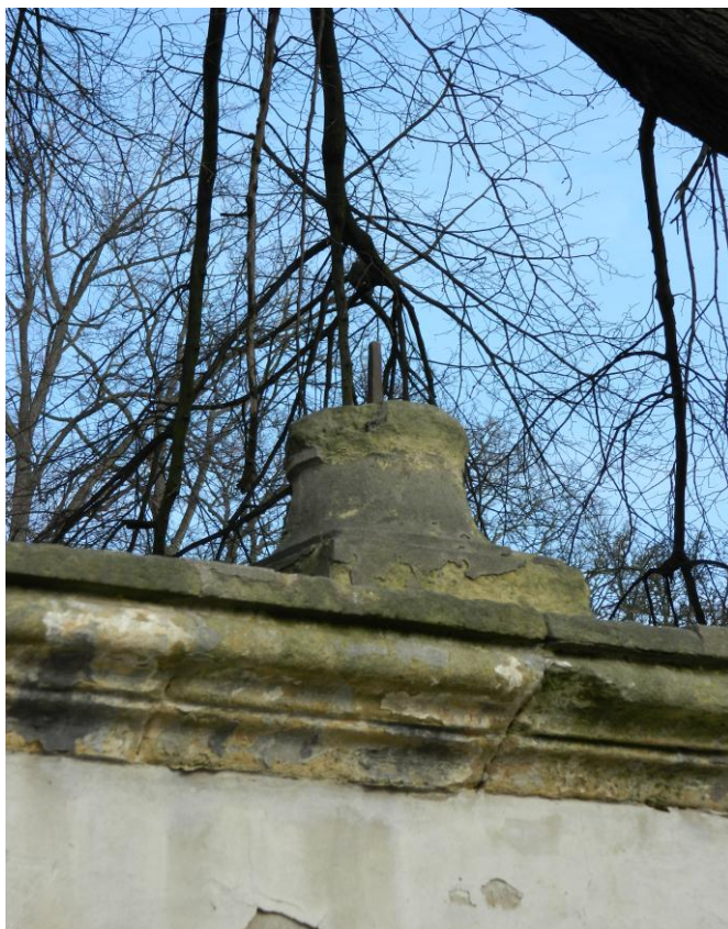
27. Fragment ornamentální vázy