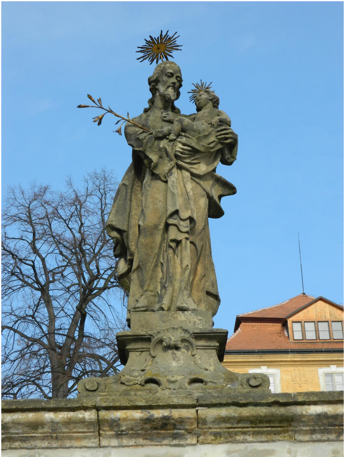
25. Sv. Josef s Ježíškem