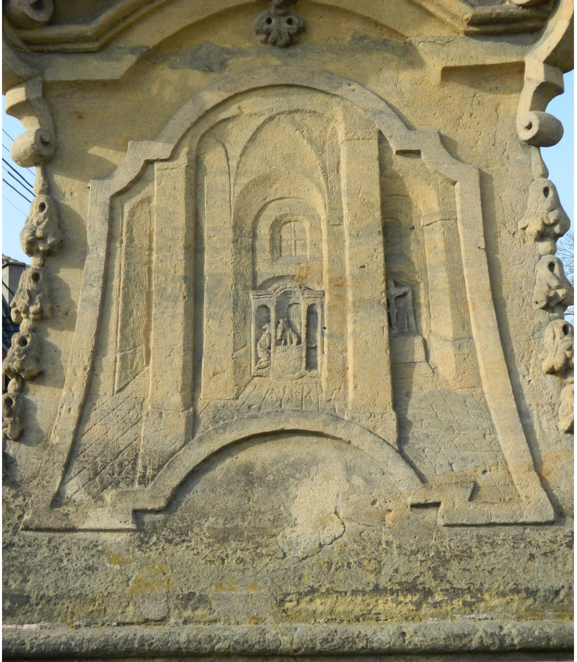
5. Sv. Jan Nepomucký zpovídá královnu Žofii