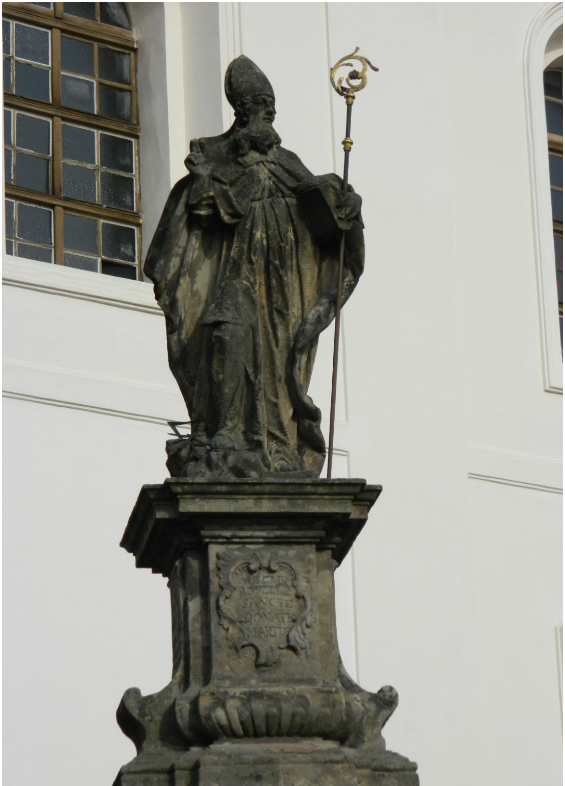
12. Sv. Donát