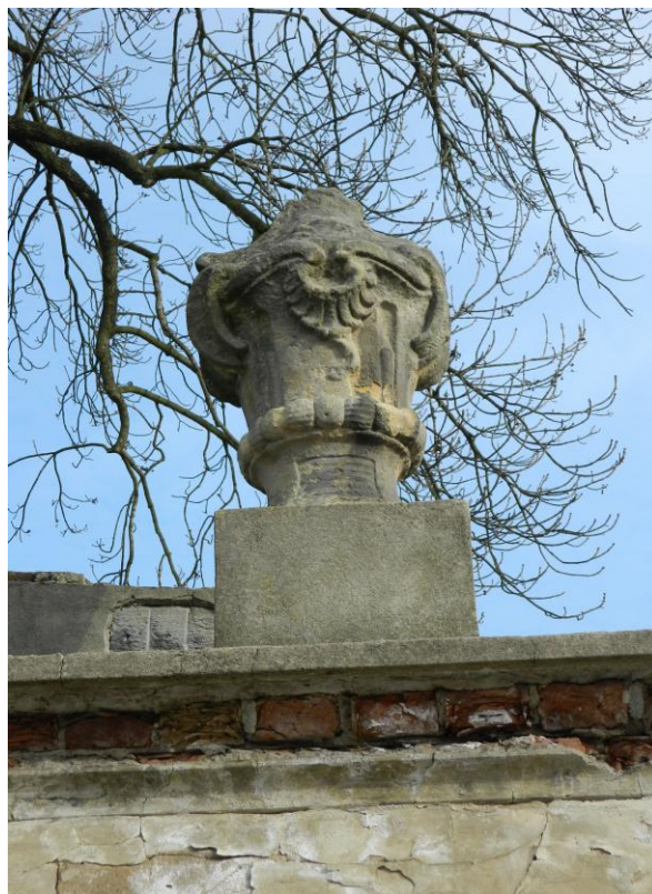
30. Ornamentální váza