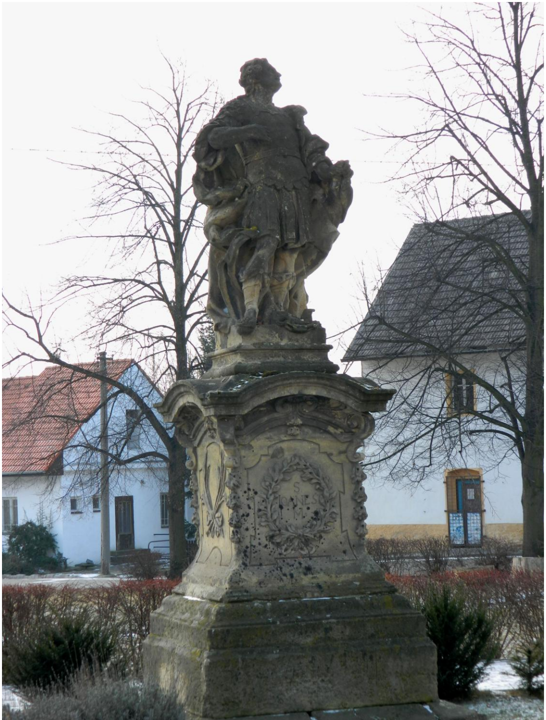
2. Sv. Jan Mučedník