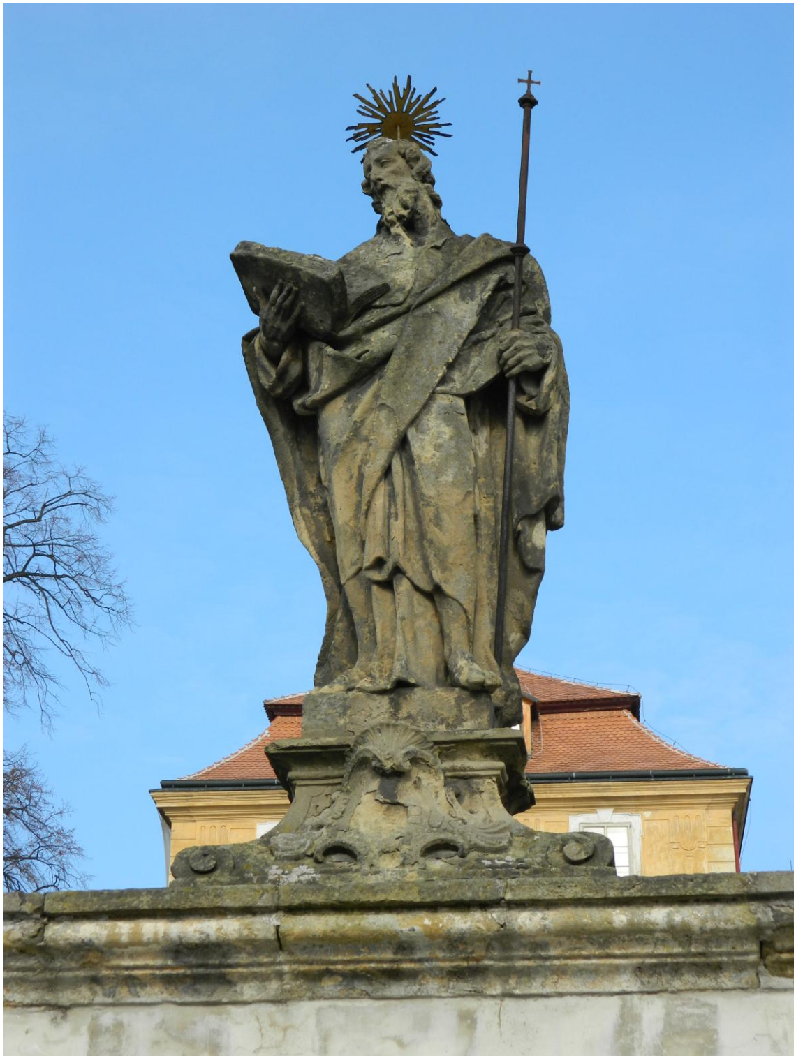
23. Sv. Jakub Větší