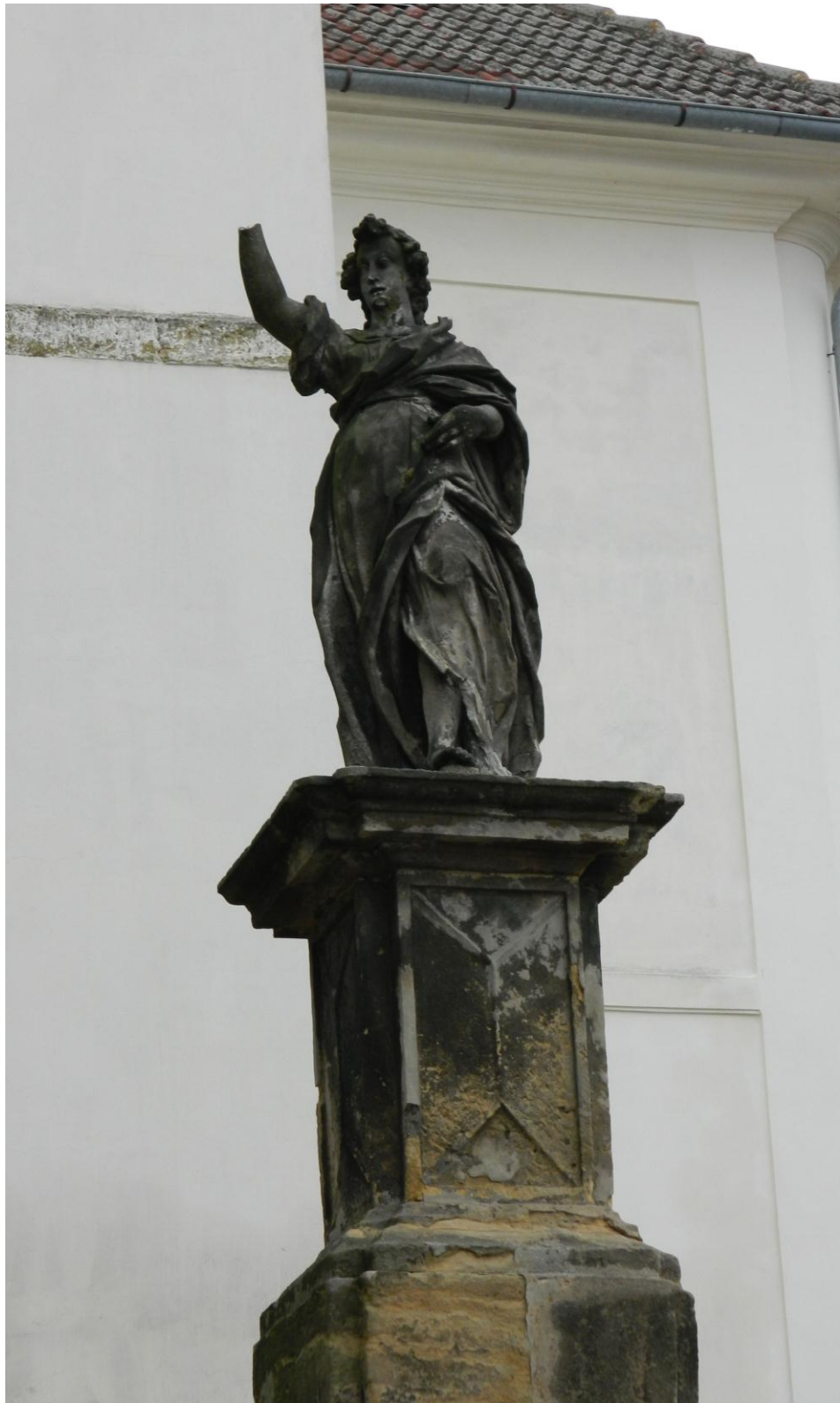
15. Archanděl Gabriel