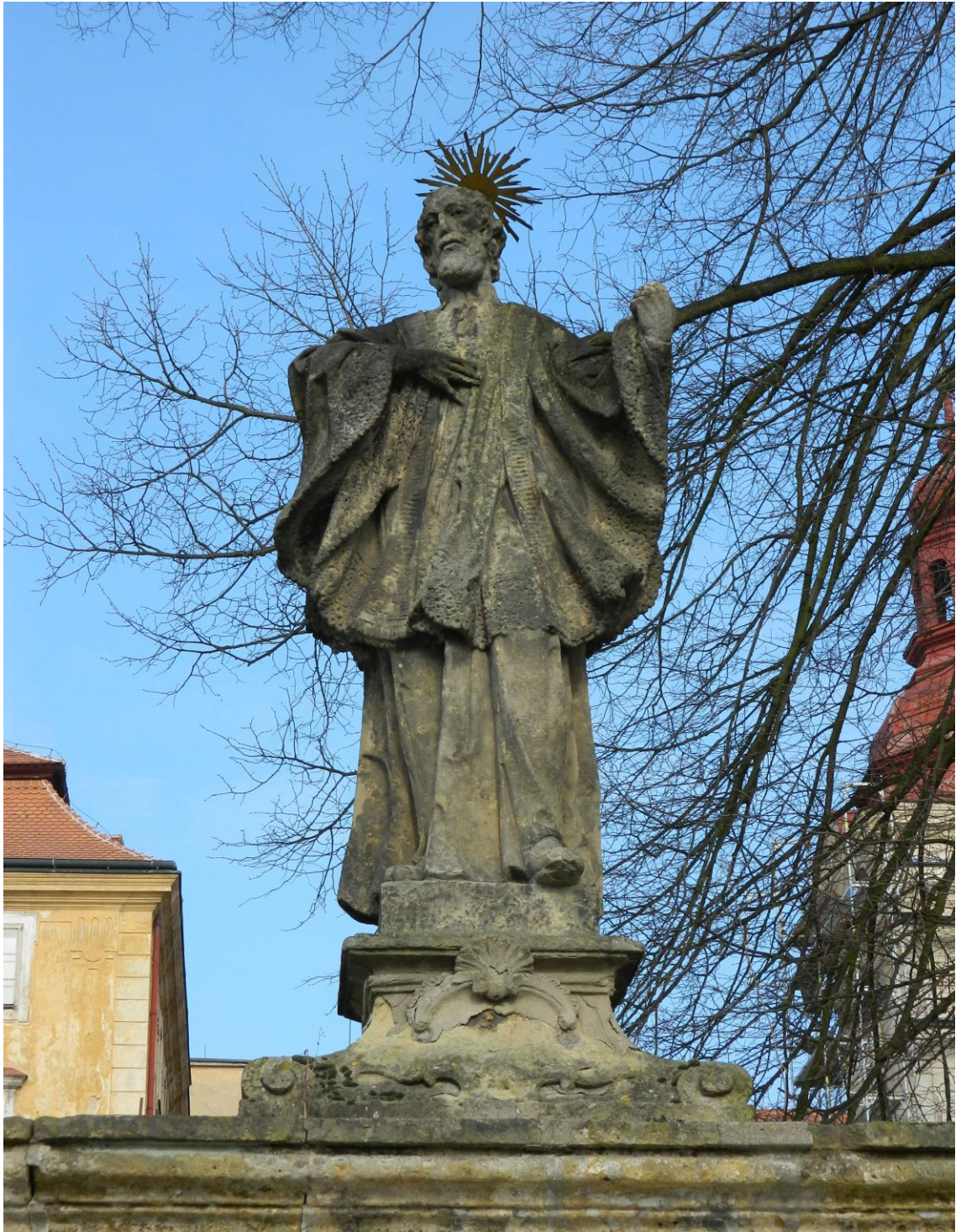
22. Sv. František Xaverský