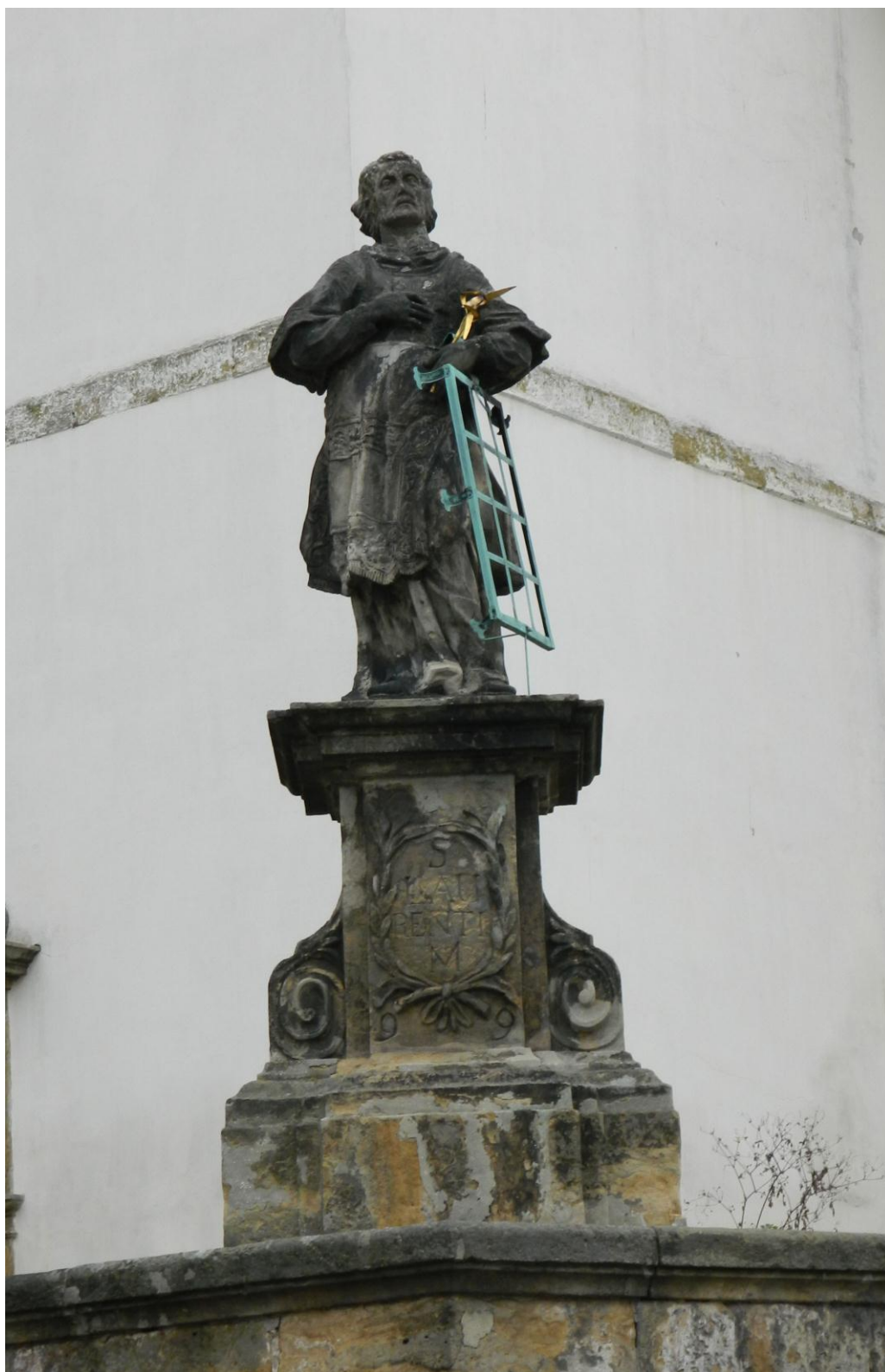
13. Sv. Vavřinec