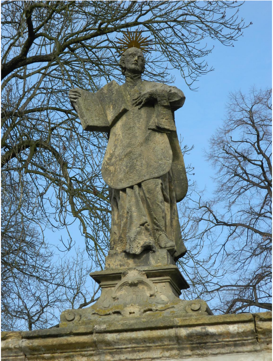
26. Sv. Ignác z Loyoly