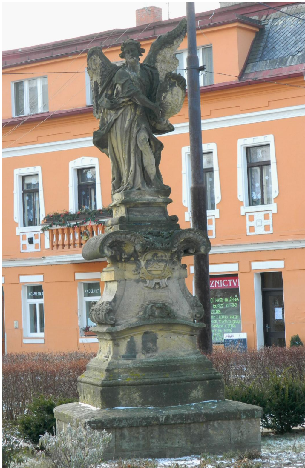
8. Anděl s medailonem se sv. Stanislavem Kostkou