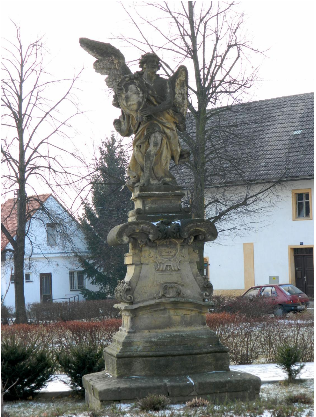
3. Anděl s medailonem se sv. Aloisem Gonzagou