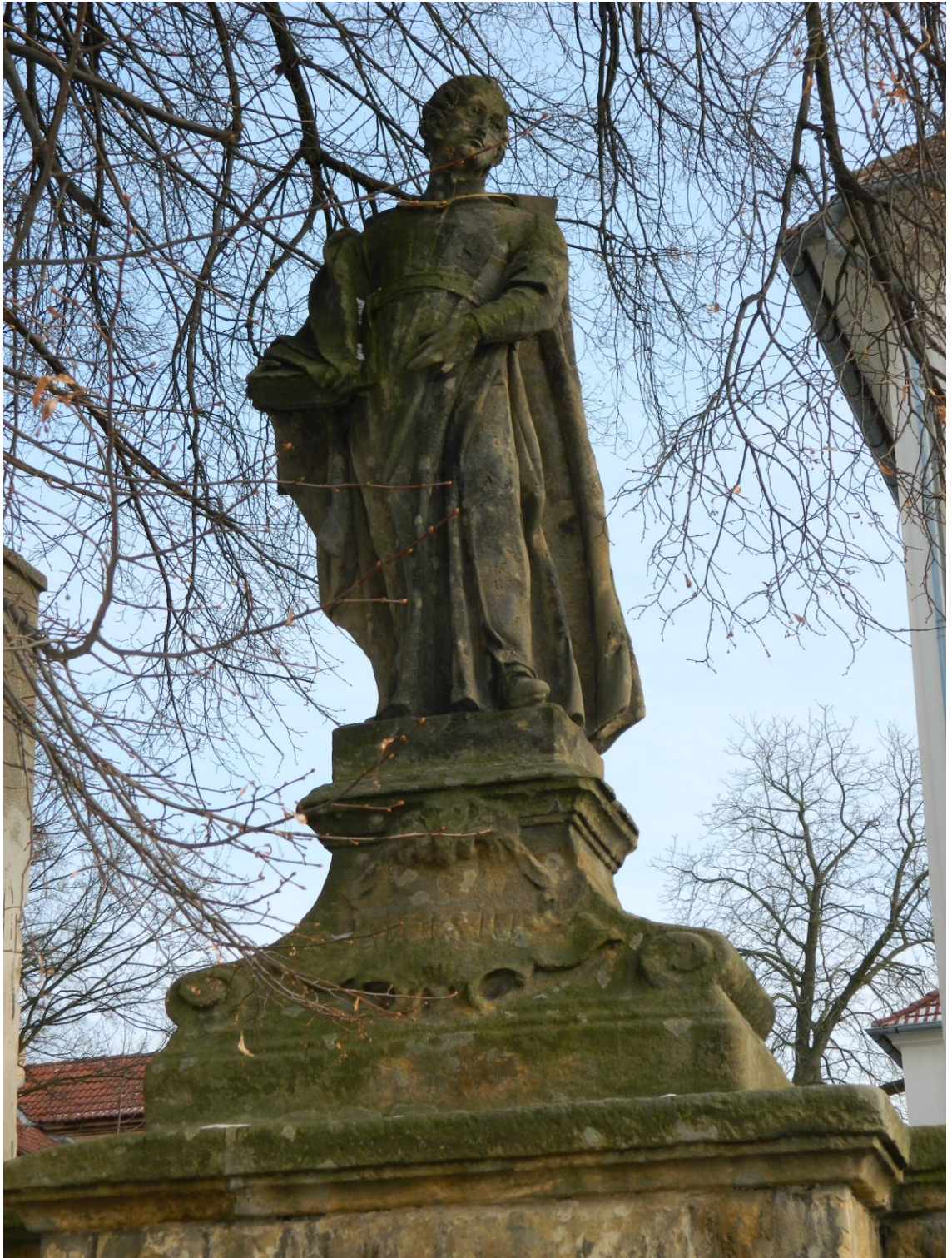
17. Sv. Alois Gonzaga