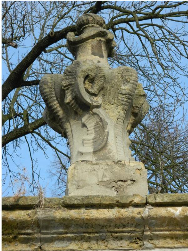
29. Ornamentální váza