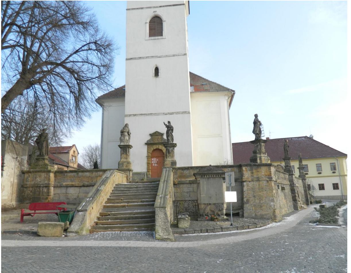
10. Skupina soch u kostela Nanebevzetí Panny Marie