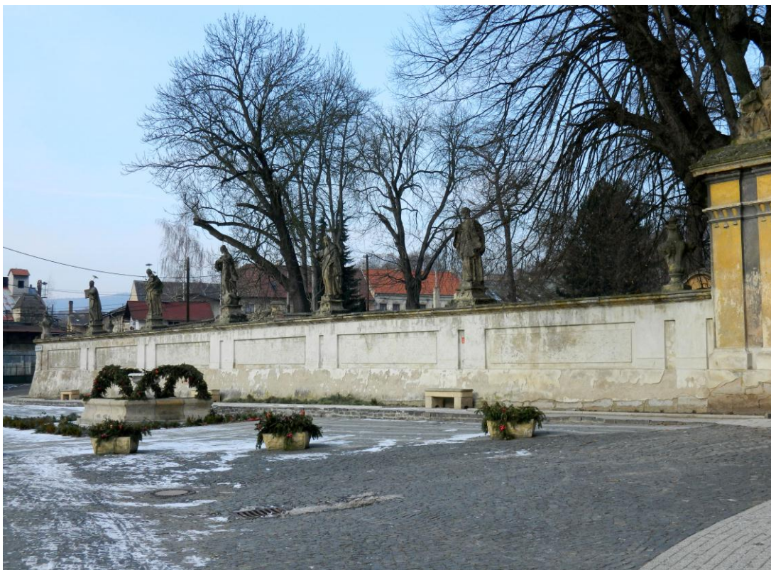
18. Skupina soch na zámecké ohradní zdi