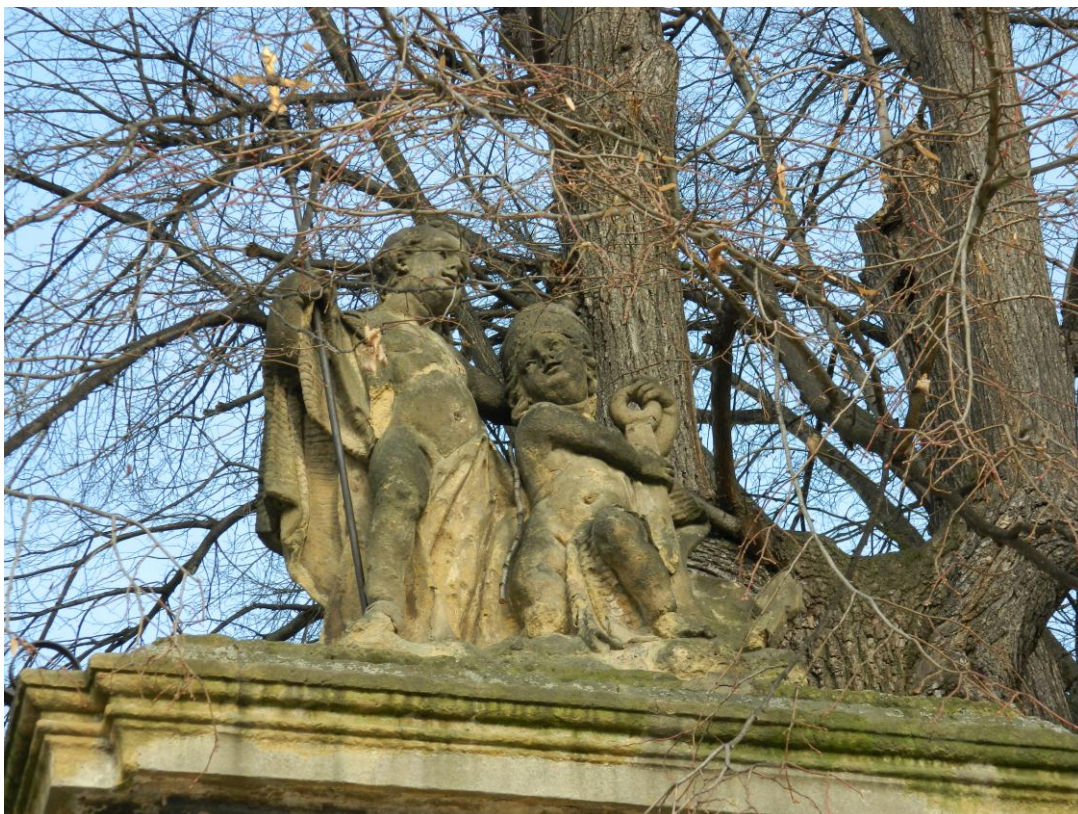
20. Pravá strana sousoší s putti