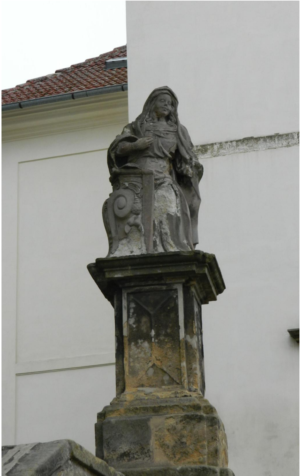
16. Panna Marie