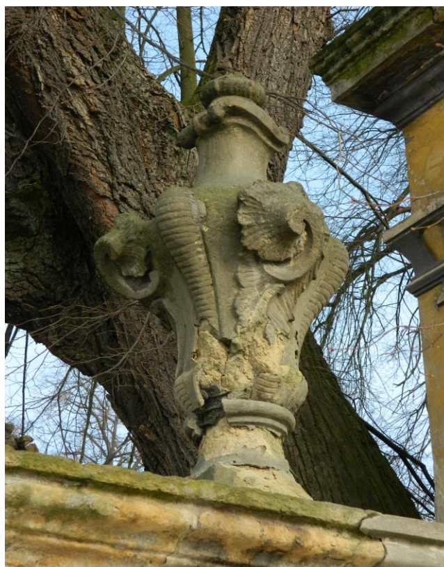
28. Ornamentální váza