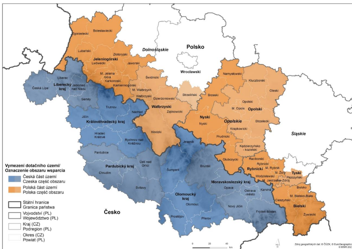
OBRÁZEK Č.1 Území česko-polské přeshraniční spolupráce

Zdroj: https://www.cz-pl.eu/mapa-programoveho-uzemi