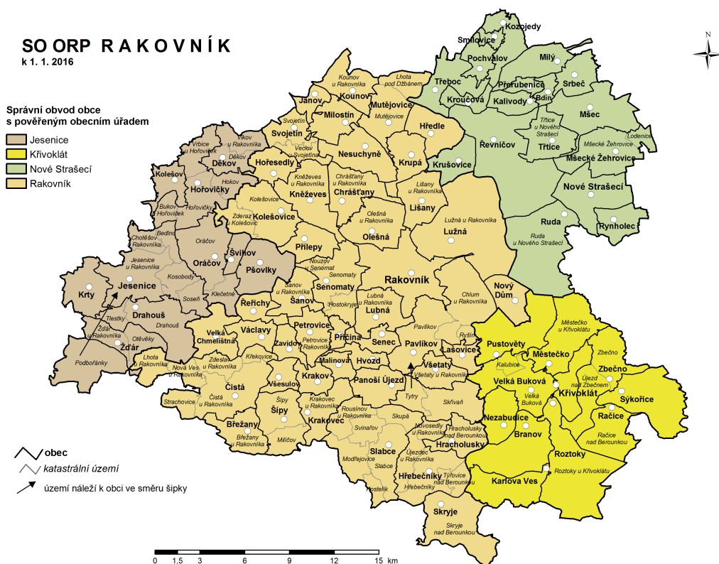
Obrázek č. 1: Správní obvod ORP Rakovník