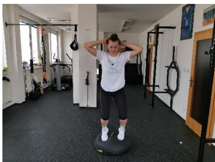
Obrázek 51. Cvik 28 - výchozí pozice.