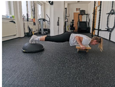
Obrázek 66. Cvik 37 - výsledná pozice.