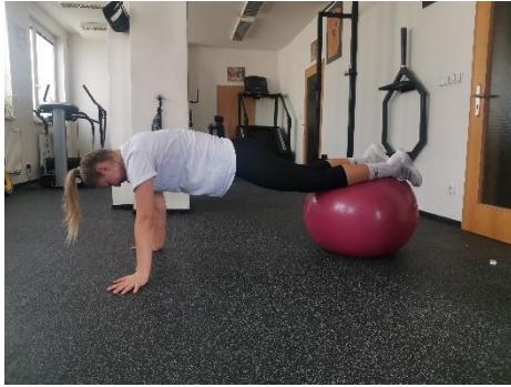
Obrázek 39. Cvik 22 - výchozí pozice.