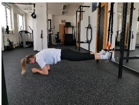
Obrázek 27. Cvik 15 - výchozí pozice.

Poznámka: pánev, páteř, hlava v jedné rovině.