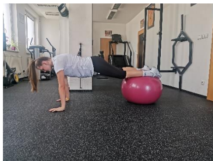
Obrázek 38. Cvik 21 - výchozí pozice.

Poznámka: další varianty cviku 21. jsou nohy na špičkách, stoj na 1 noze.