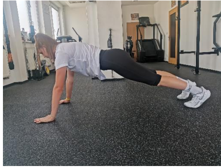
Obrázek 2. Cvik 2 - výchozí pozice.