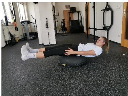
Obrázek 68. Cvik 39 - výchozí pozice.