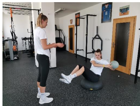
Obrázek 76. Cvik 43 - výsledná pozice.