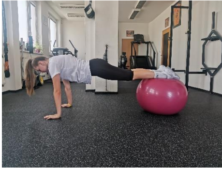
Obrázek 43. Cvik 24 - výchozí pozice.