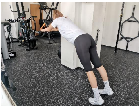
Obrázek 25. Cvik 14 - výchozí pozice.