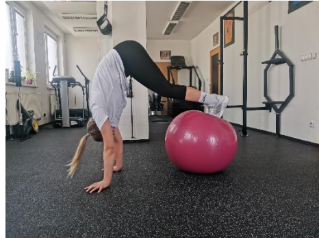
Obrázek 42. Cvik 23 - výsledná pozice.