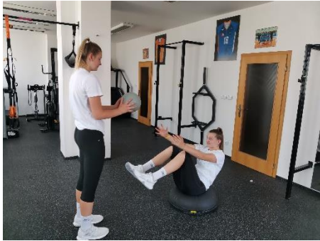
Obrázek 73. Cvik 42 - výchozí pozice.