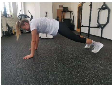
Obrázek 7. Cvik 5 - výchozí pozice.

Poznámka: pravá dolní končetina se nevytáčí dovnitř ani ven.