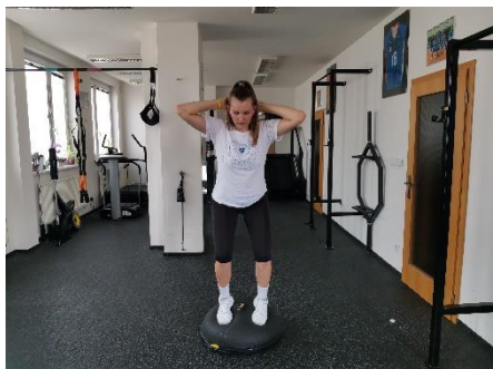
Obrázek 54. Cvik 31 - výchozí pozice.

Poznámka: rovná záda, dřep na celých chodidlech.