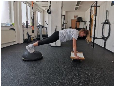
Obrázek 65. Cvik 37 - výchozí pozice.

Poznámka: varianty cvičení můžeme provádět i zapojením dvou pomůcek.