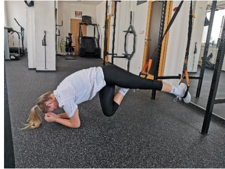
Obrázek 29. Cvik 16 - výsledná pozice.