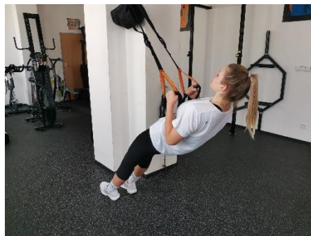
Obrázek 22. Cvik 12 - výsledná pozice.