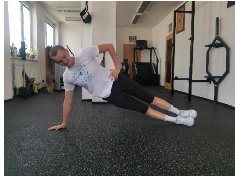
Obrázek 14. Cvik 8 - výsledná pozice.