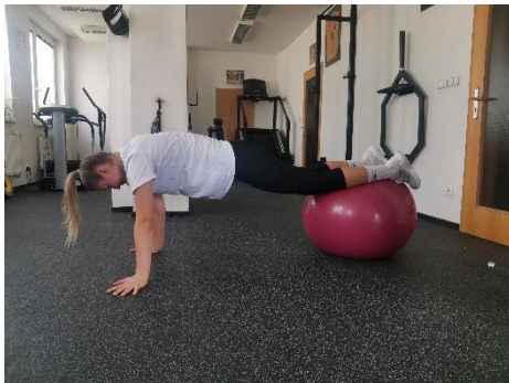
Obrázek 41. Cvik 23 - výchozí pozice.

Poznámka: primárně zapojeny břišní svaly.