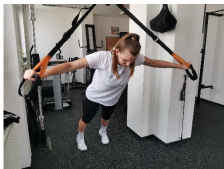
Obrázek 24. Cvik 13 - výsledná pozice.