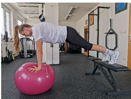
Obrázek 49. Cvik 27 - výchozí pozice.

Poznámka: varianta zvednutí jedné dolní končetiny.