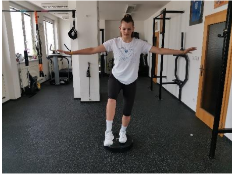
Obrázek 60. Cvik 34 - výchozí pozice.