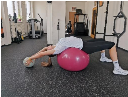
Obrázek 36. Cvik 20 - výchozí pozice.