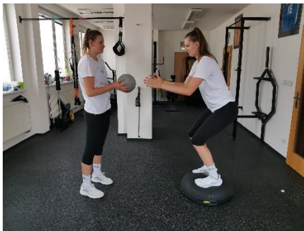
Obrázek 71. Cvik 41 - výchozí pozice.

Poznámka: primární zapojení šikmých břišních svalů.