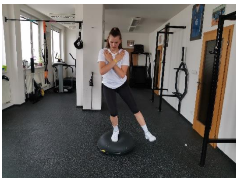
Obrázek 52. Cvik 28 - výchozí pozice.