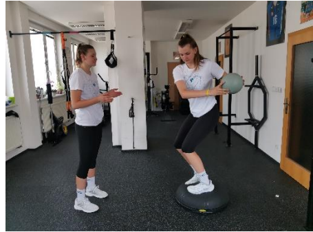
Obrázek 72. Cvik 41 - výsledná pozice.