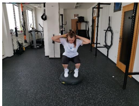
Obrázek 55. Cvik 31 - výsledná pozice.