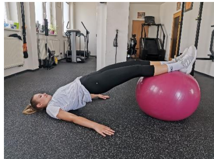
Obrázek 35. Cvik 19 - výsledná pozice.