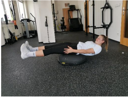
Obrázek 69. Cvik 40 - výchozí pozice.