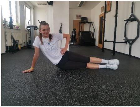
Obrázek 13. Cvik 8 - výchozí pozice.