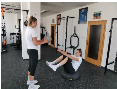
Obrázek 75. Cvik 43 - výchozí pozice.

Poznámka: zapojeno šikmé břišní svalstvo.