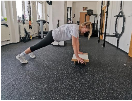
Obrázek 63. Cvik 36 - výchozí pozice.