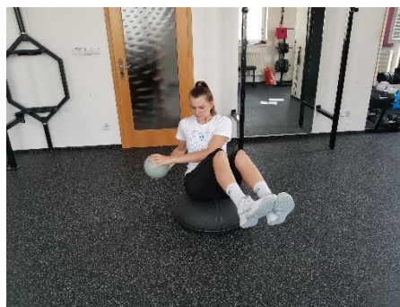
Obrázek 79. Cvik 44 - výsledná pozice.