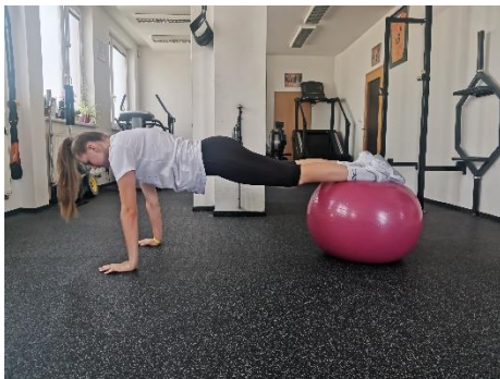
Obrázek 45. Cvik 25 - výchozí pozice.

Poznámka: tento cvik může být další variantou cviku 18.