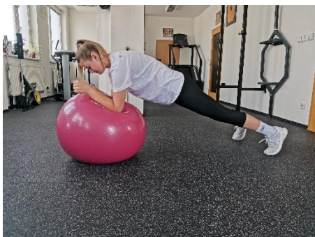
Obrázek 47. Cvik 26 - výchozí pozice.