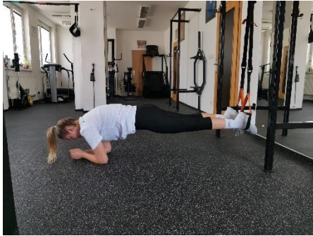
Obrázek 28. Cvik 16 - výchozí pozice.