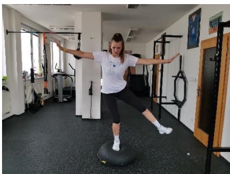
Obrázek 53. Cvik 30 - výchozí pozice.