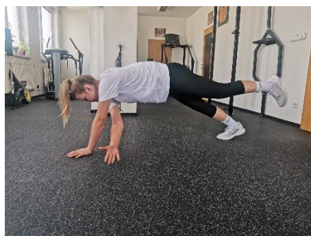
Obrázek 8. Cvik 5 - výsledná pozice.