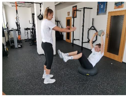
Obrázek 74. Cvik 42 - výsledná pozice.