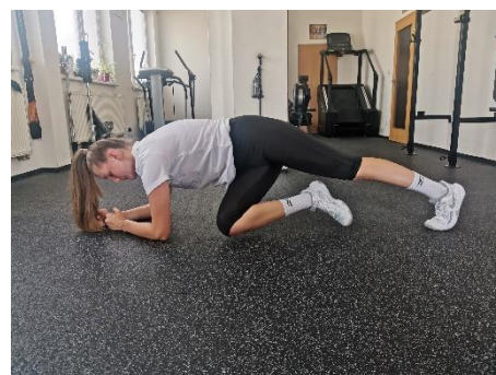
Obrázek 4. Cvik 3 - výsledná pozice.