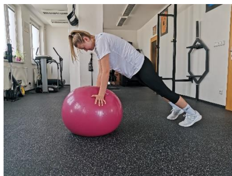
Obrázek 48. Cvik 26 - výsledná pozice.