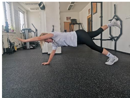
Obrázek 6. Cvik 4 - výsledná pozice.