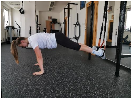
Obrázek 30. Cvik 17 - výchozí pozice.

Poznámka: primárně zapojené břišní svalstvo.