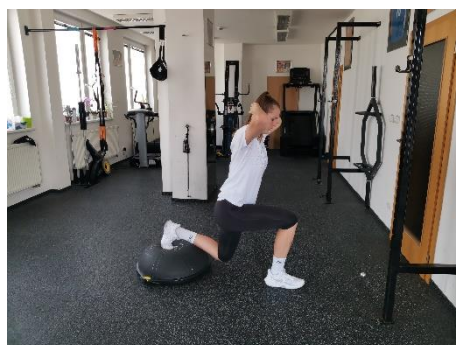
Obrázek 59. Cvik 33 - výsledná pozice.