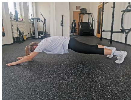
Obrázek 10. Cvik 6 - výsledná pozice.