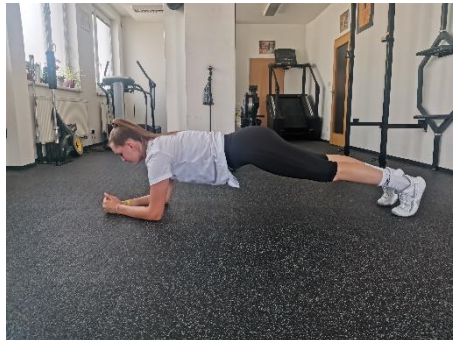
Obrázek 1 Cvik 1 - výchozí pozice.

Poznámka: dolní končetiny nataženy, hlava v prodloužení páteře.