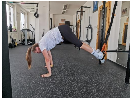
Obrázek 31. Cvik 24 - výsledná pozice.