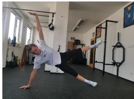
Obrázek 16. Cvik 9 - výsledná pozice.