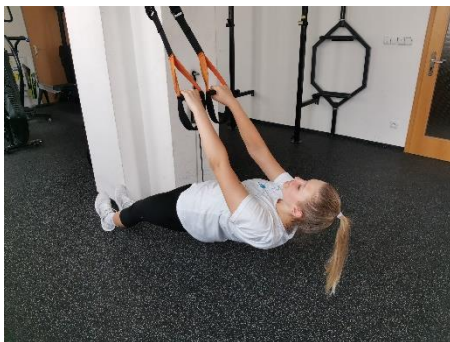
Obrázek 19. Cvik 11 - výchozí pozice.

Poznámka: hlava se nepředklání, zůstává v prodloužení páteře.