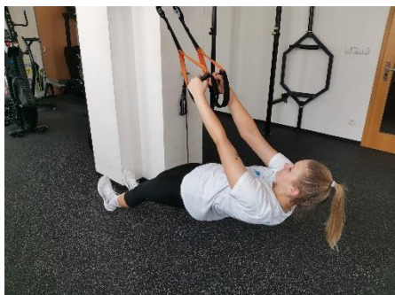
Obrázek 21. Cvik 12 - výchozí pozice.