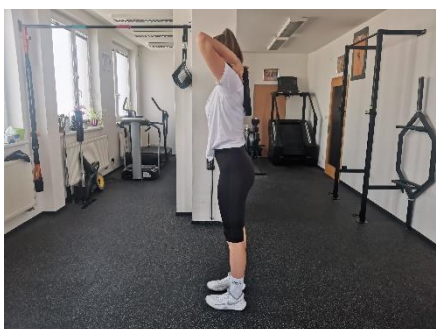
Obrázek 11. Cvik 7 - výchozí pozice.

Poznámka: primárně zapojeny zádové svaly.