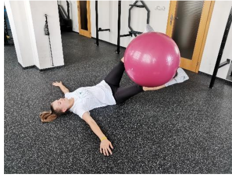
Obrázek 33. Cvik 18 - výsledná pozice.