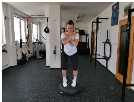
Obrázek 57. Cvik 32 - výsledná pozice.