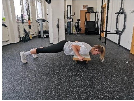
Obrázek 64. Cvik 36 - výsledná pozice.