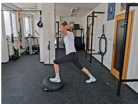
Obrázek 58. Cvik 33 - výchozí pozice.

Poznámka: rovná záda, varianta i s činkou.