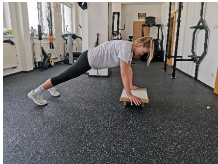
Obrázek 62. Cvik 35 - výchozí pozice.

Poznámka: dolní končetiny mírně od sebe kvůli stabilitě.