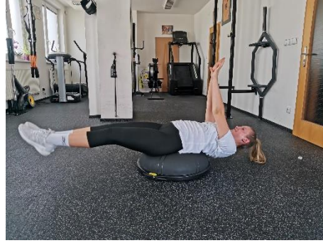
Obrázek 70. Cvik 40 - výsledná pozice.