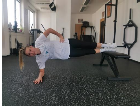
Obrázek 18. Cvik 8 - výsledná pozice.