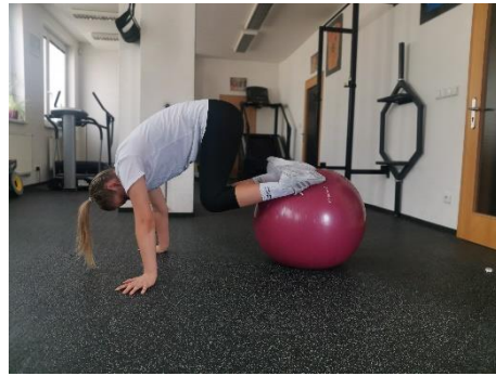
Obrázek 40. Cvik 22 - výsledná pozice.