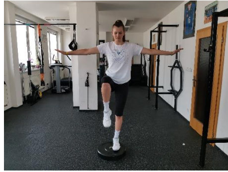
Obrázek 61. Cvik 34 - výsledná pozice.