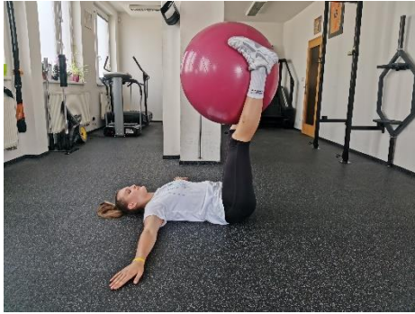
Obrázek 32. Cvik 18 - výchozí pozice.