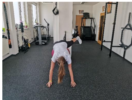
Obrázek 46. Cvik 25 - výsledná pozice.