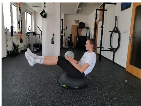
Obrázek 78. Cvik 44 - výchozí pozice.