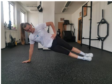
Obrázek 15. Cvik 9 - výchozí pozice.