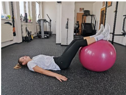
Obrázek 34. Cvik 19 - výchozí pozice.

Poznámka: primárně zapojeny břišní svalstvo a svaly pánevního dna.