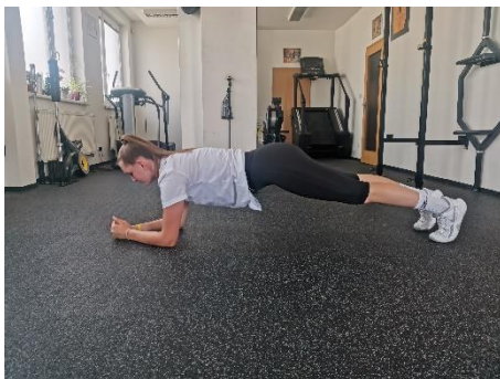
Obrázek 3. Cvik 3 - výchozí pozice.

Poznámka: cvik lze provádět i na fitballu.