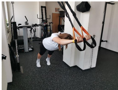
Obrázek 26. Cvik 14 - výsledná pozice.