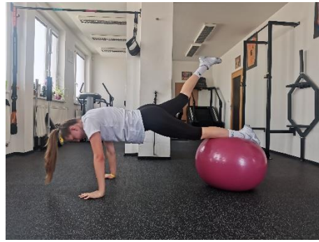
Obrázek 44. Cvik 24 - výsledná pozice.