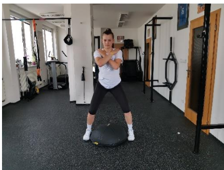
Obrázek 56. Cvik 32 - výchozí pozice.