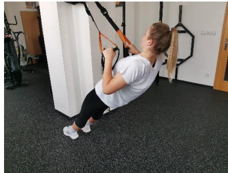
Obrázek 20. Cvik 11 - výsledná pozice.