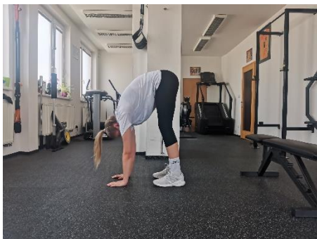
Obrázek 9. Cvik 6 - výchozí pozice.