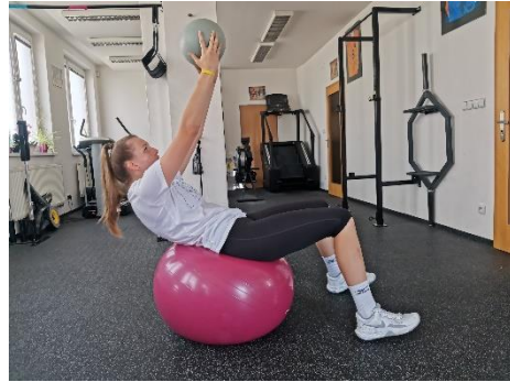
Obrázek 37. Cvik 20 - výsledná pozice.