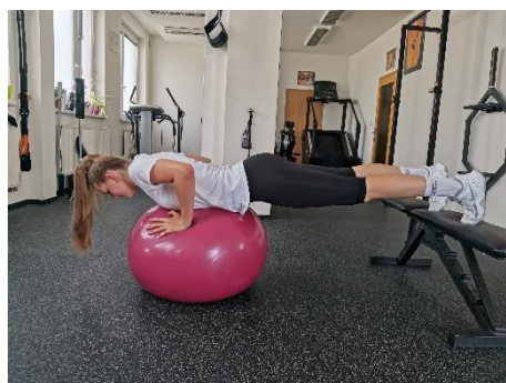
Obrázek 50. Cvik 27 - výsledná pozice.