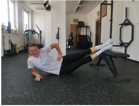
Obrázek 17. Cvik 8 - výchozí pozice.