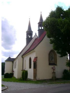
Obr. 18. Kostel svatého Havla