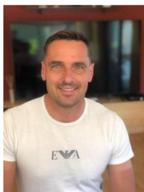
Obr. 13. Roman Šebrle

Roman Šebrle, televizní moderátor, atletický vícebojař, olympijský vítěz