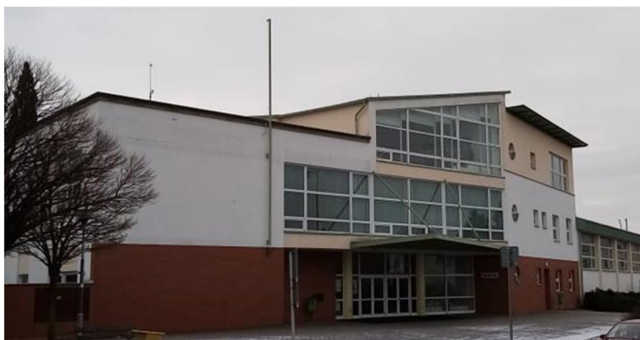
Obr. 5. Nová budova školy Javornická