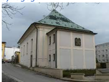
Obr. 15. Synagoga