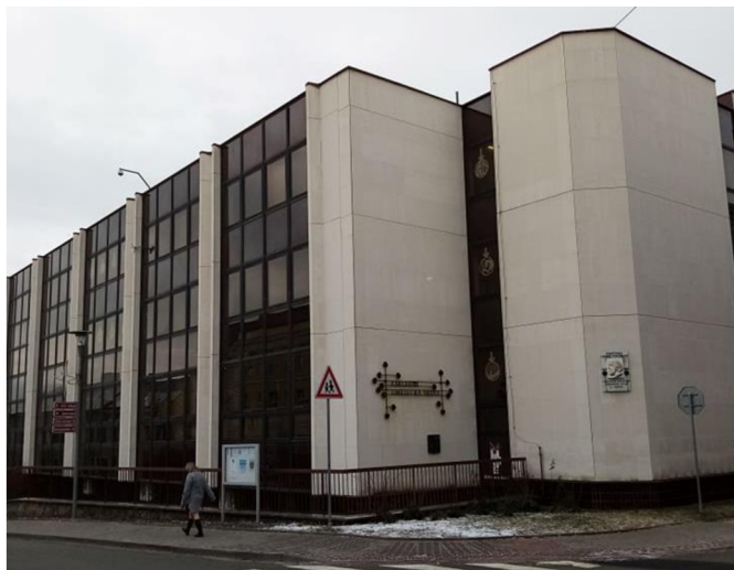
Obr. 6. Budova současné Základní umělecké školy

Škola pořádá řadu akcí, kromě plesu také vystupuje na každoroční výstavě Betlémů, pořádá celoškolní soutěž MÚZY a DNY ZUŠ, které nabízejí koncerty, vystoupení, výstavy, divadelní představení. Škola připravuje také koncerty pro seniory s názvem „Hrajeme pro radost“, výchovné koncerty pro školy, pravidelné žákovské koncerty, divadelní představení a výstavy v různých prostorách města. Škola se každoročně účastní mnoha soutěží u nás i v zahraničí.