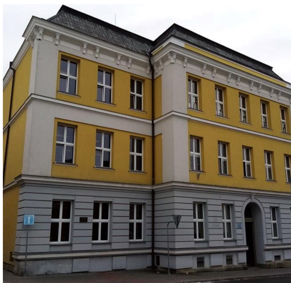
Obr. 4. Stará budova školy dívčí