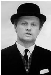
Obr. 12. Jiří Šlitr

Jiří Šlitr, hudební skladatel, zpěvák, instrumentalista, výtvarník