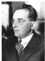
Obr. 10. Karel Poláček

Karel Poláček, spisovatel, humorista, novinář