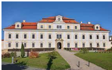
Obr. 16. Zámek