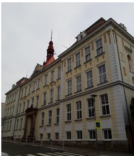
Obr. 2. Budova Chlapecké školy

V současné době využívá škola obě budovy, má dvě tělocvičny, 1 hřiště, učebnu jazykové výchovy, hudební výchovy, dvě počítačové a dvě multimediální učebny, cvičný byt, školní dílny, učebnu s keramickou pecí, učebnu fyziky a chemie, školní pozemek. Školní vzdělávací program je založen na principech činnostního učení a vychází z principů Tvořivé školy. Na škole funguje kroužek šachový, keramický a dopravní výchovy, na druhém stupni kroužek logické výchovy a atletický. Škola pořádá lyžařské a plavecké výchovné výcviky.