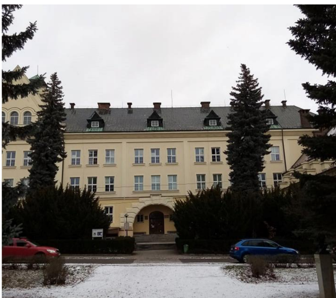
Obr. 1. Budova Gymnazia F. M. Pelcla