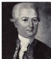
Obr. 9. František Martin Pelcl

František Martin Pelcl, historik, spisovatel