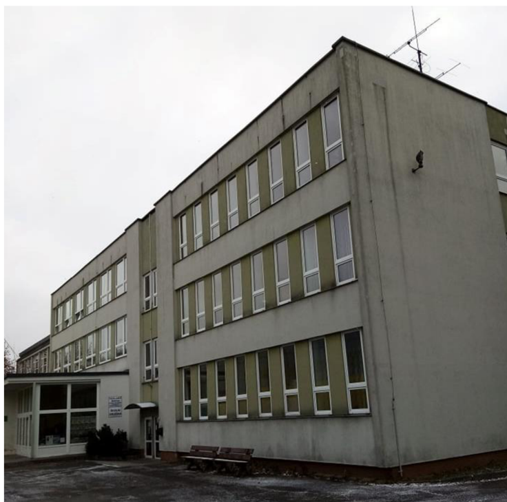
Obr. 3. Nový školní pavilon

Dívčí škola , později Komenského a dnes Javornická , Rychnov nad Kněžnou, sídlila v budově, jejíž základní kámen byl položen 22. května 1881, vysvěcena byla roku 1882. Vyučovalo se ale také v chudobinci. V roce 1913 navštěvovalo obecnou dívčí školu 276 dívek a měšťanskou školu 205 žákyň. 65 V roce 2000 přesídlila do nové budovy na Javornické ulici a nyní využívá obě budovy. Má menší halu, dvě tělocvičny, speciální venkovní hřiště, specializované učebny chemie, fyziky, výtvarné výchovy, hudební výchovy, zeměpisu, jazykovou učebnu, učebnu informatiky, venkovní environmentální učebnu, dílnu, cvičnou kuchyni, zahradu s přípravnou, školní družinu, školní jídelnu, žákovskou knihovnu a keramickou dílnu. Pořádá také mnoho akcí pro děti, žáky i rodiče i pro širokou veřejnost, jako vánoční jarmark, projektové dny Den země, Den her, Den bez rozvrhu a další. Žáci se zúčastňují olympiád, vědomostních soutěží. Škola pořádá lyžařské, cyklistické, turistické a vodácké kurzy, také sběrové akce a vydává školní časopis. 66