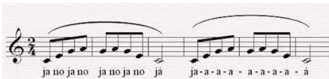
Obr. 5 Rozezpívání jano, jano

Rozezpívání: děti se rozezpívají s doprovodem akordeonu. Učitelka na klaviatuře střídá tóny c, e, g, a, g, a, g, e, c. Hraje nahoru a dolů. Rozezpívání se několikrát opakuje.