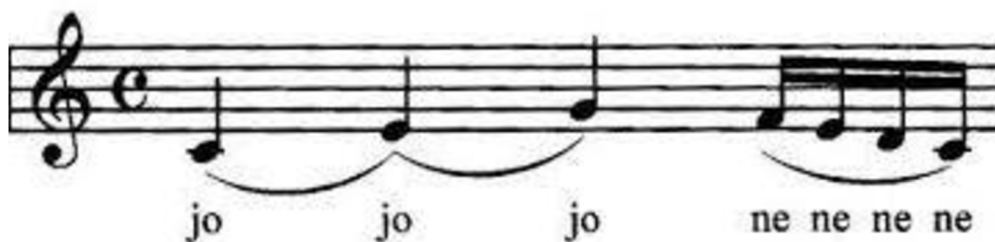
Obr. 1 Rozezpívání jo, jo,jo

Rozezpívání: rozezpívání je vedeno za doprovodu akordeonu na klaviatuře, střídáním tónů c, e, g, f, e, d, c. Rozezpívání se několikrát opakuje.