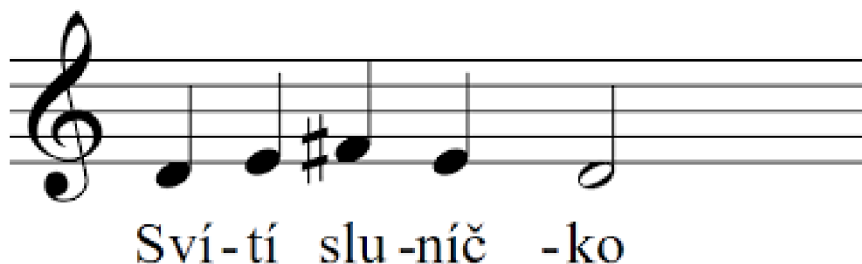
Obr. 10 Rozezpívání svítí sluníčko

Rozezpívání: rozezpívání je opět za doprovodu akordeonu na klaviatuře, a to pomocí střídání tónů d, e, fis, e d. Rozezpívání se několikrát společně opakuje.