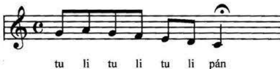
Obr. 8 Rozezpívání tulipán

Nácvik písně s dramatizací a doprovodem Orffových nástrojů: zopakování nacvičené písně z minulé hodiny. Děti, které chtějí, se obléknou do kostýmů. Dvě děti představují nevěstu a ženicha, mají věneček se závojem a cylindr. Ostatní děti se rozdělí na dvě skupiny. První skupina představuje svatebčany, druhá skupina kapelu. Nejprve všichni nacvičují hru s nástroji (stále máme děti ve dvou skupinách), přičemž jsou využity zkušenosti z minulé hodiny. Některé děti mají ozvučná dřívka, jiné zase drhla (v každé skupině je poměrově stejné zastoupení Orffových nástrojů). Děti s ozvučnými dřívky hrají liché takty, děti s drhly hrají sudé takty.