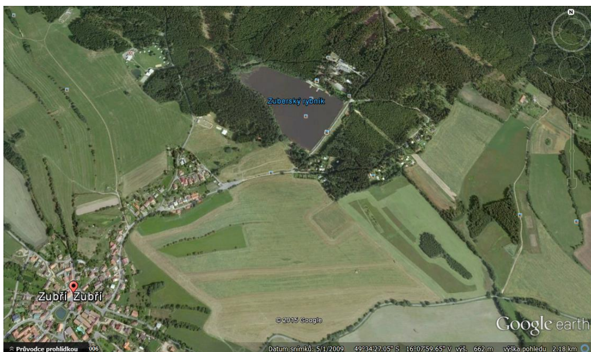
Obrázek č. 3: Lokalita Zubří

Vesnice, která leží asi 3 kilometry od Nového Města na Moravě, se nachází uprostřed lesů a polí. Kousek za vesnicí, vedle Zuberského rybníka se ve zdejších lesích schovává poměrně rozsáhlá chatová osada. Z té mi poskytla rozhovor jedna příjemná chatařka a posléze druhá, která ovšem není přímo z osady. Nad osadou je zalesněný kopec, na němž se tyčí menší zděná chata. Právě z té pochází druhá respondentka mého výzkumu.