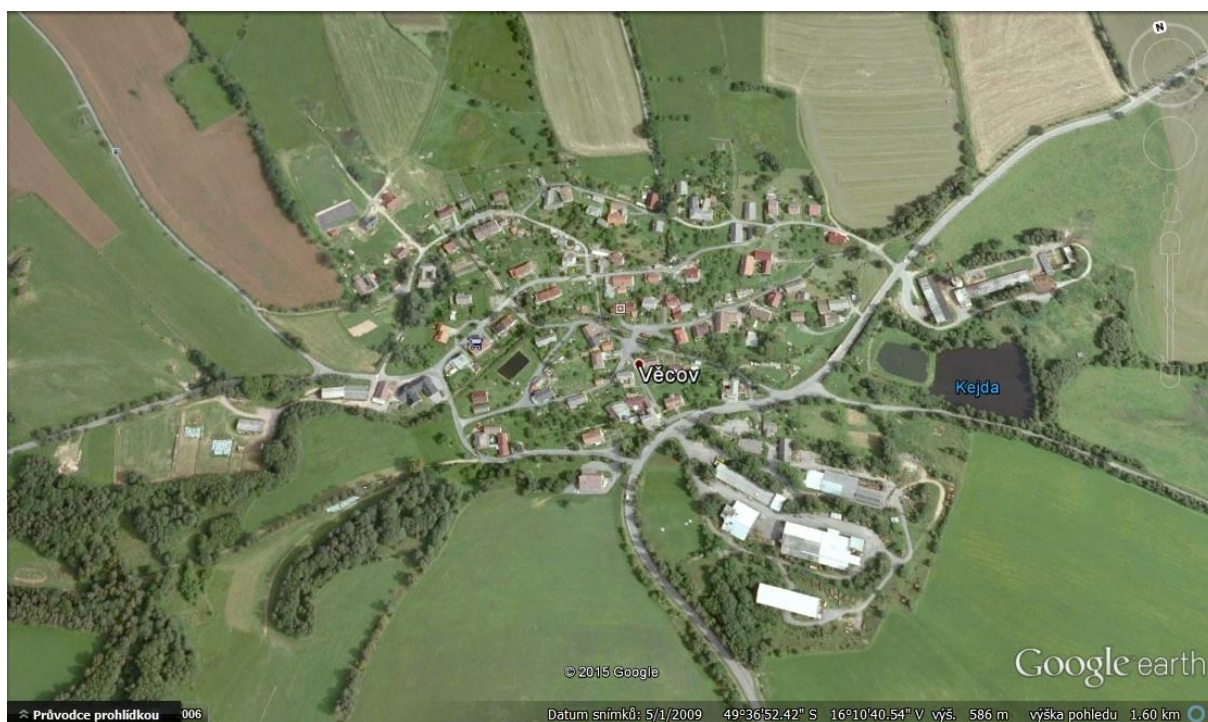
Obrázek č. 6: Lokalita Věcov

Věcov je malá vesnice, která se nachází severovýchodně od Nového Města na Moravě. Obec je krajině rozrůzněná. Najdeme zde kopce, lesy, louky i rybník. Při okrajích se nachází právě rekreační chalupy. Z jedné z nich pochází můj respondent, se kterým jsem rozhovor uskutečnila mimo vesnici.