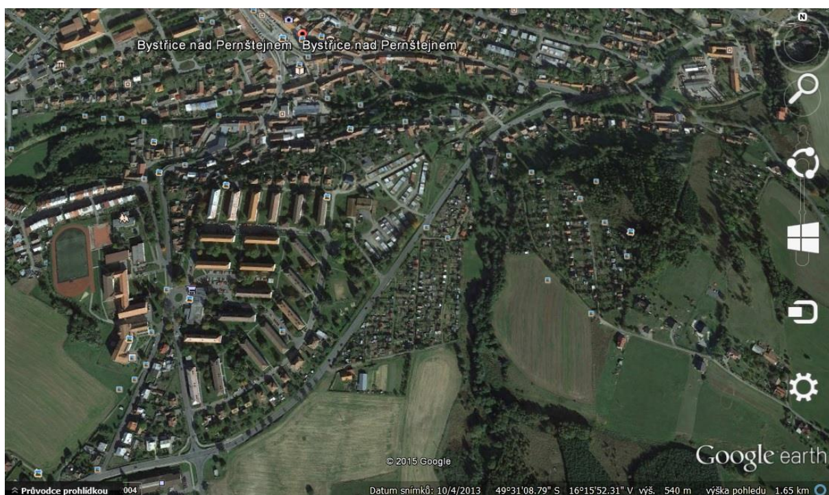
Obrázek č. 7: Lokalita Bystřice nad Pernštejnem

Město velikostně podobné Novému Městu na Moravě. Zde jsem se zaměřila na jednu, zato podstatně větší, chatovou oblast. Oblast se nachází na okraji Bystřice nad Pernštejnem, při výjezdu směr vesnice Zvole. Hned přes silnici je postaveno sídliště, kde je jistě mnoho zahrádkářů a chatařů, kteří to mají na zahrady blízko tak, jako jeden z mých respondentů. Je to velká osada, kterou tvoří zejména zahrádkářské chaty a která je poměrně hustě obydlená. Pro výzkumné šetření jsem z osady vybrala dva respondenty.