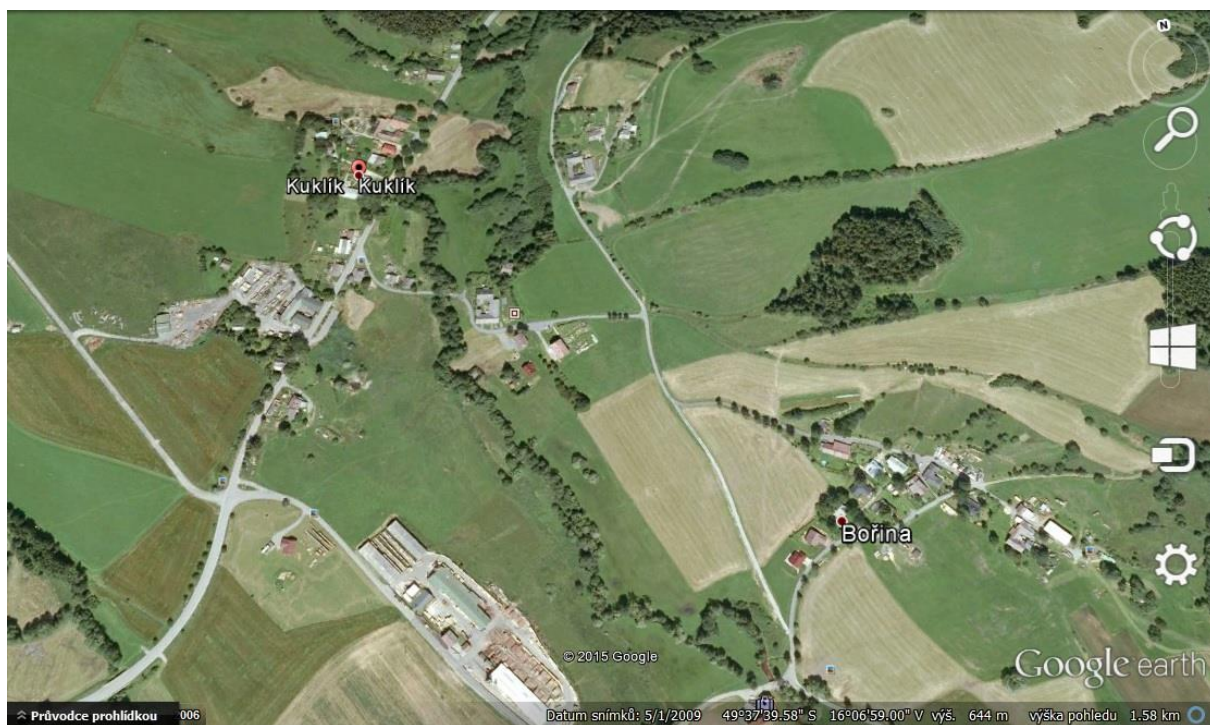
Obrázek č. 4: Lokalita Kuklík

Kuklík je vesnice spíše chalupářského charakteru, která leží asi 8 km od Nového Města na Moravě. Její součástí jsou různé části, které obývají jak místní, tak chalupáři. Moje respondentka je z části Bořina, vysoko na kopci, s krásným výhledem na údolí.