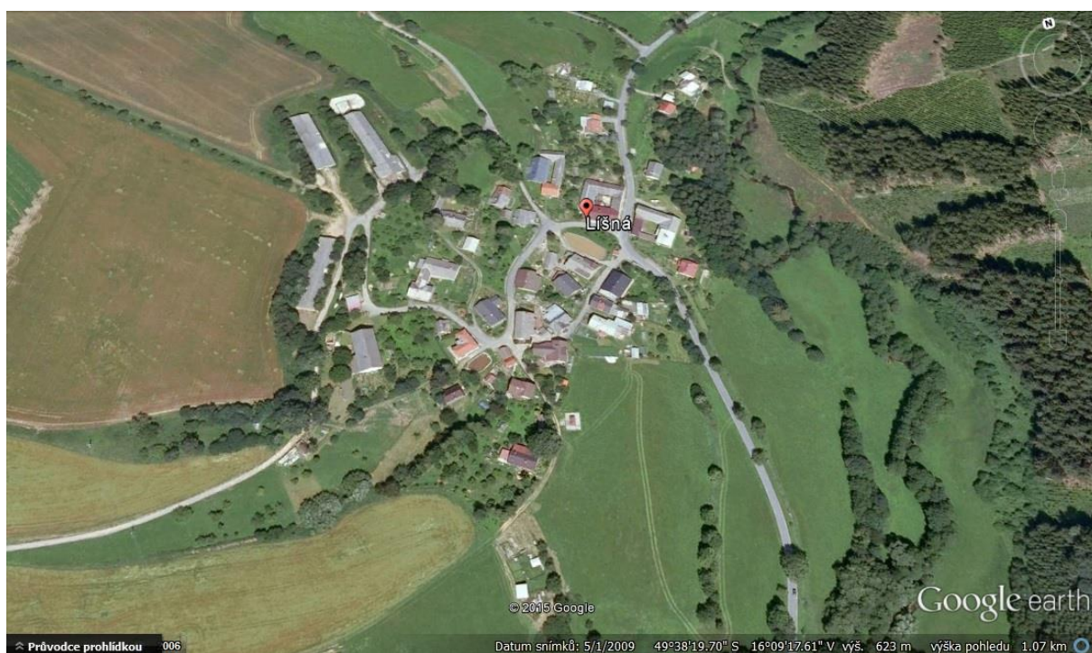
Obrázek č. 5: Lokalita Líšná

Líšná je opravdu malá vesnice blízko obcí Sněžné a Jimramov. Nachází se v údolí obklopeném kopci. Nenachází se zde ani obchod s potravinami. Je zde velmi málo obyvatel a můžeme tam pozorovat velké množství rekreačních chalup. I rozhovor s majitelkou části jedné chalupy jsem se mohla dozvědět, že chalupáři vesnici doslova zachraňují a udržují v ní život.