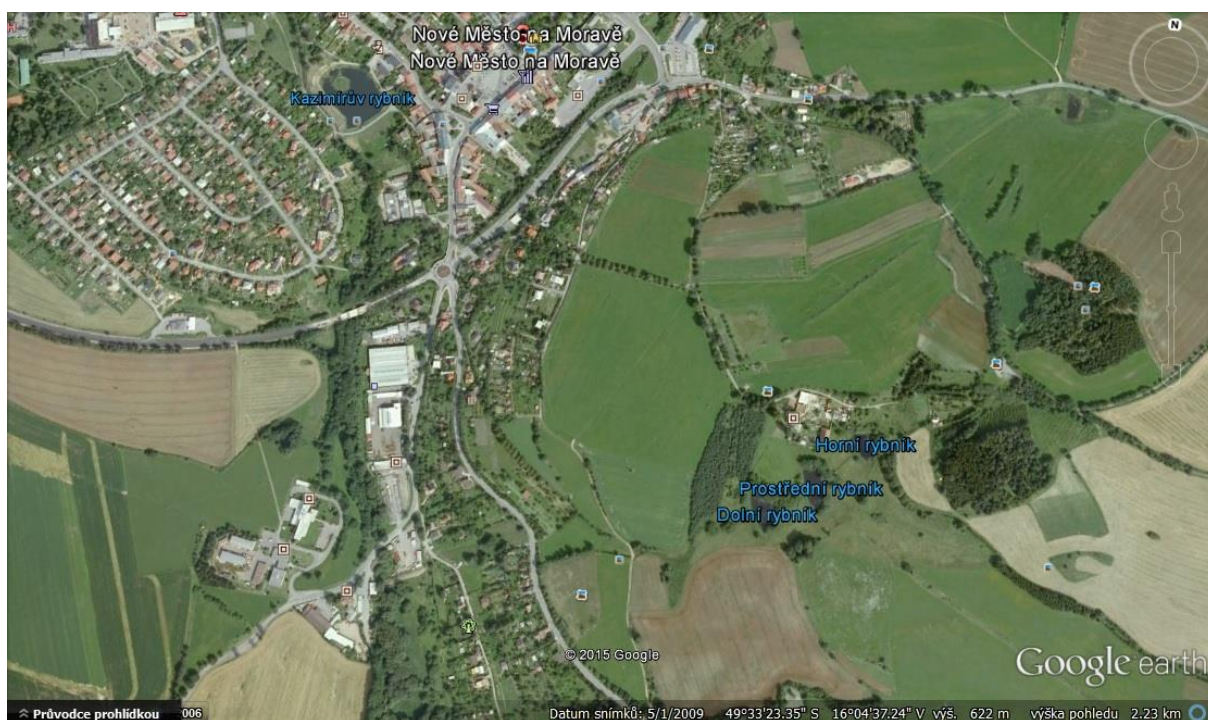
Obrázek č. 2: Lokalita Nové Město na Moravě

Nové Město na Moravě je malé, hezké město, kolem kterého je hned několik míst, které lze označit za chatové osady. Jsou zde čtyři největší. Jsou vždy umístěny při výjezdech z města. Moje dvě respondentky zastupují každá jinou chatařskou oblast. První chatová osada se nachází při silničním výjezdu z města, směrem na vesnici Nová Ves. Druhá menší zahrádkářská osada se nachází na „Zasranci“, což je místní kopec nad městem.