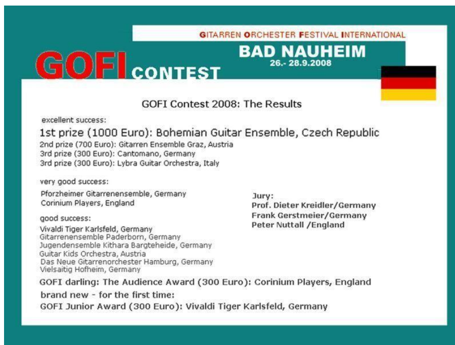
Obr. 7: Výsledková listina z Mezinárodního soutěžního festivalu kytarových orchestrů GOFI v Bad Neuheimu 26. – 28. 2008