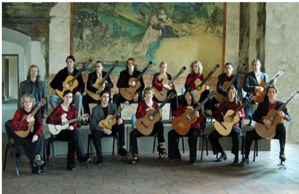
Obr. 3: Fotografie Bohemian Guitar Orchestra v roce 2005