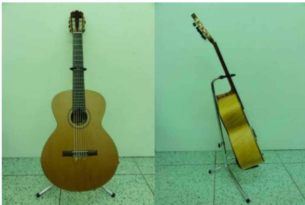
Obr. 17: Basová kytara – cedr – výrobce Petr Matoušek