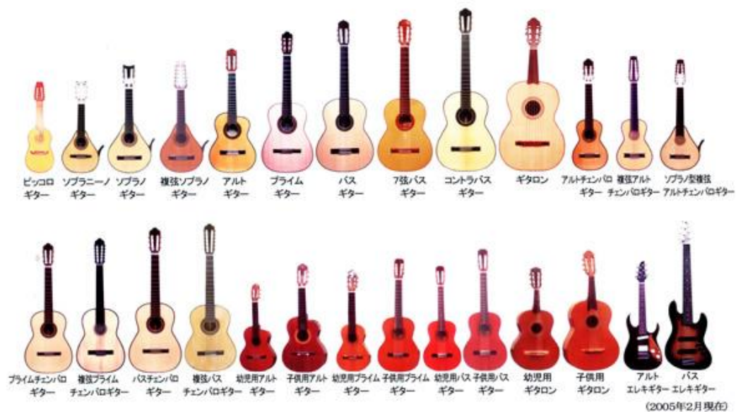
Obr. 1: Niiboriho kytary