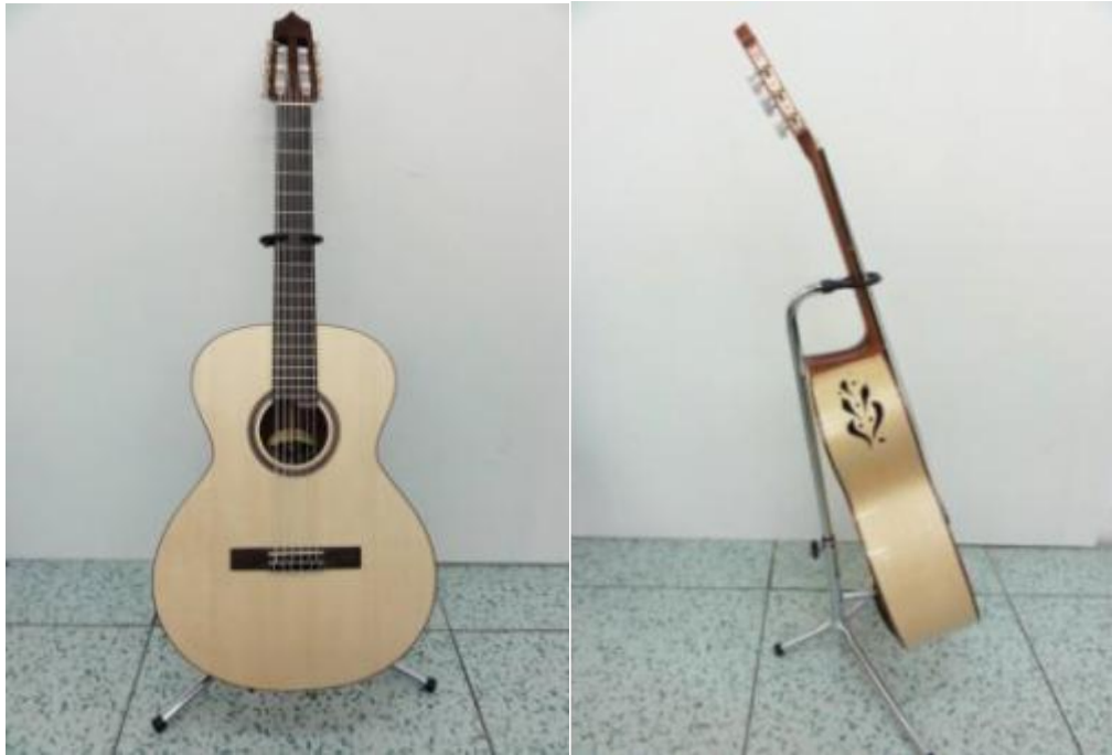
Obr. 16: Basová kytara – smrková – výrobce Jaroslav John