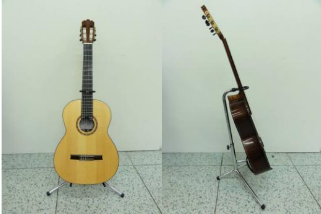
Obr. 12: Klasická kytara – výrobce Petr Matoušek