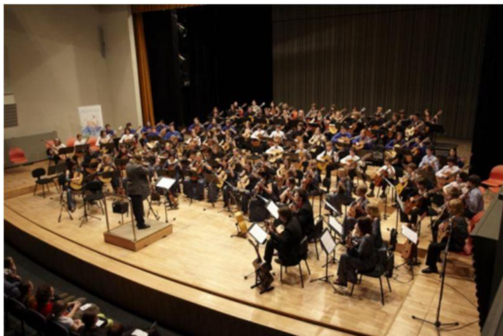
Obr. 10: Fotografie z koncertu Spojených orchestrů ve filharmonii v Hradci Králové 21. 4. 2010