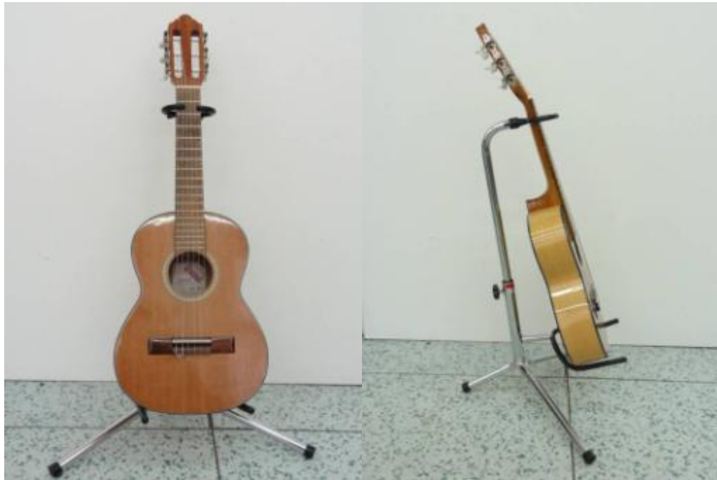
Obr. 13: Sopránová kytara – výrobce Strunal