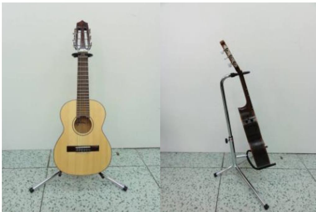
Obr. 15: Sopránová kytara – smrková – výrobce Jaroslav John