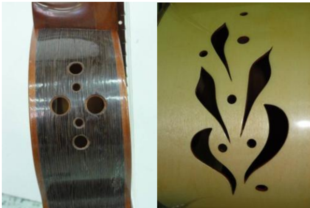
Obr. 21: Detail bočních otvorů