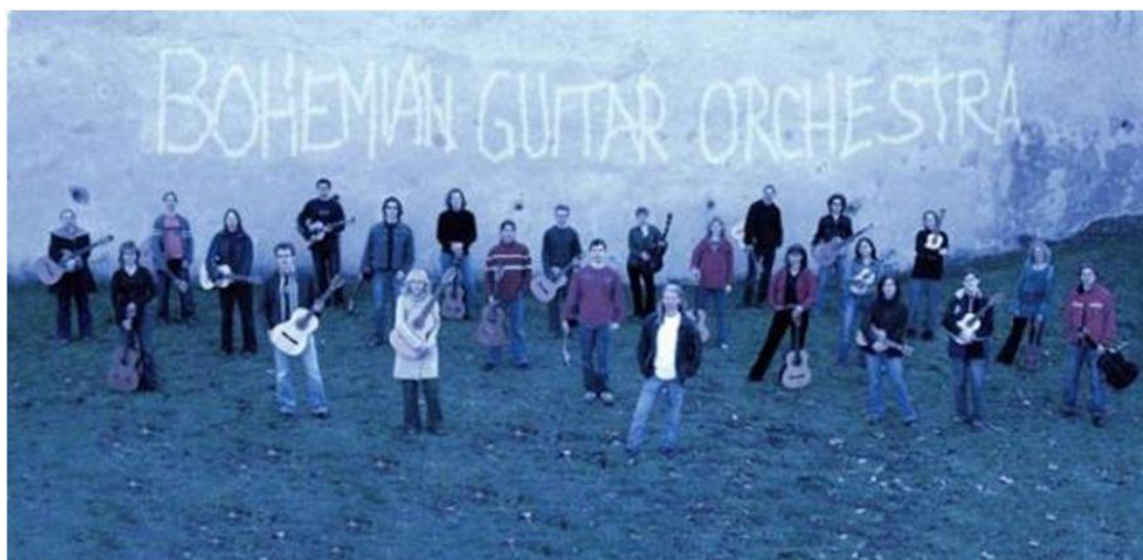
Obr.4: Fotografie BGO v roce 2006