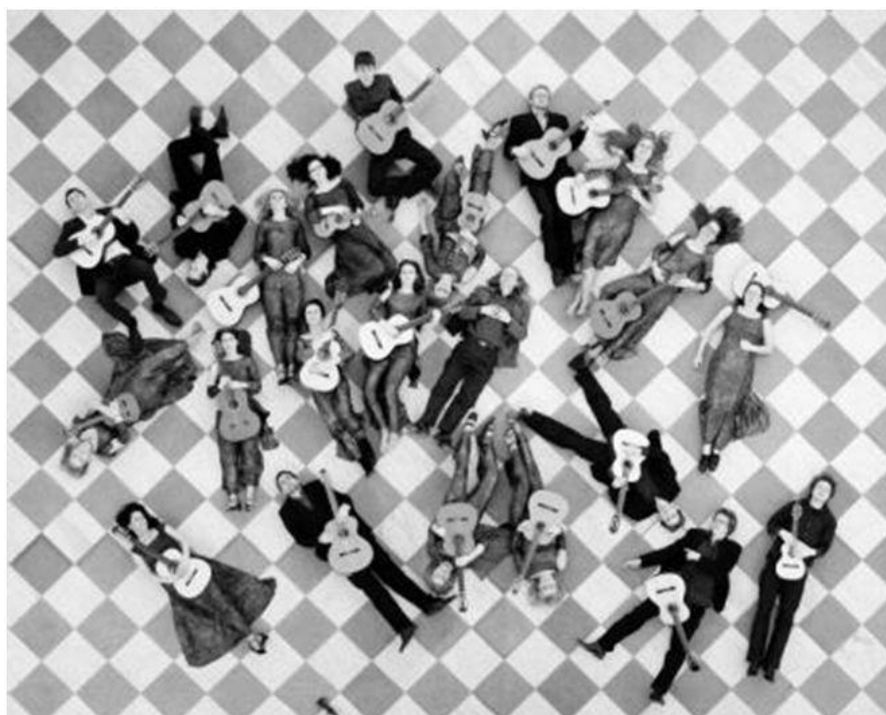
Obr. 8: Fotografie BGOz koncertu v Českém muzeu hudby v Praze 11.12. 2009