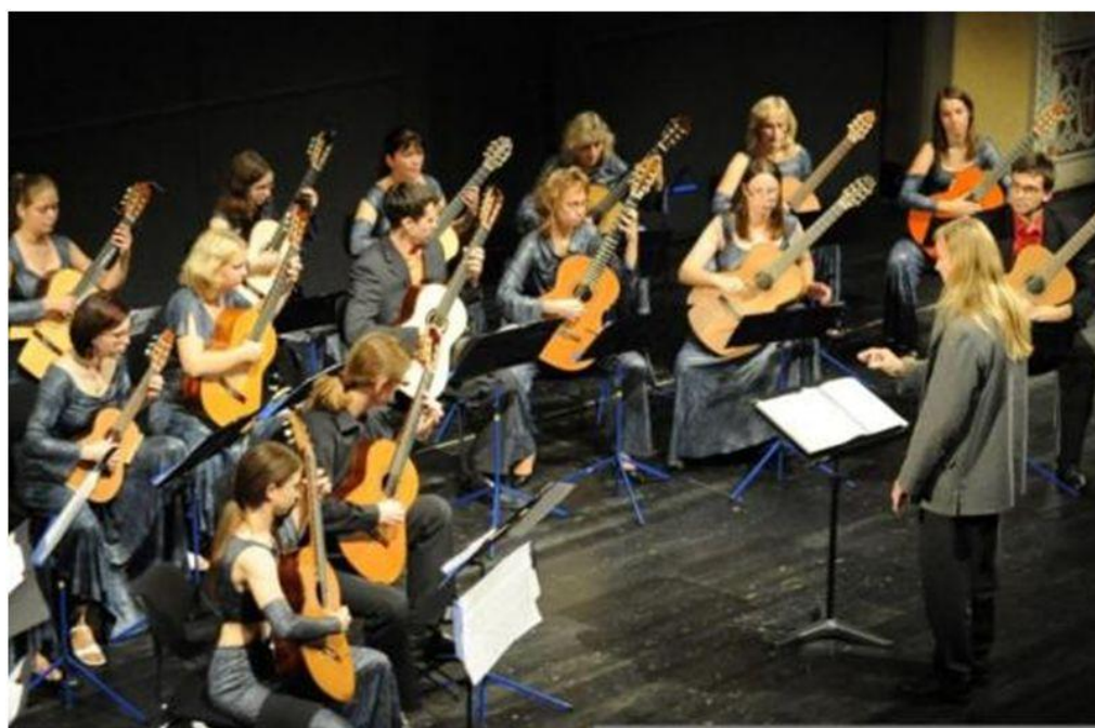
Obr. 6: Fotografie BGO na Mezinárodním soutěžním festivalu kytarových orchestrů GOFI v Bad Neuheimu 28.9. 2008