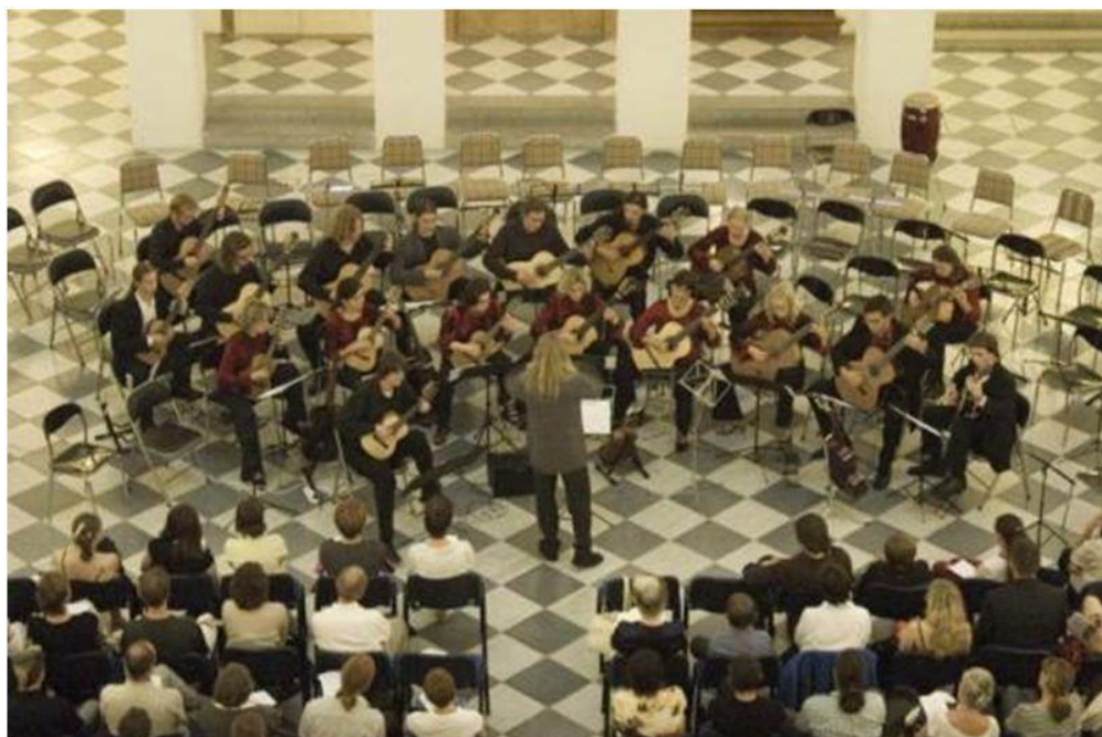
Obr. 5: Fotografie BGO při koncertu v Českém muzeu hudby v Praze 21. 6. 2007