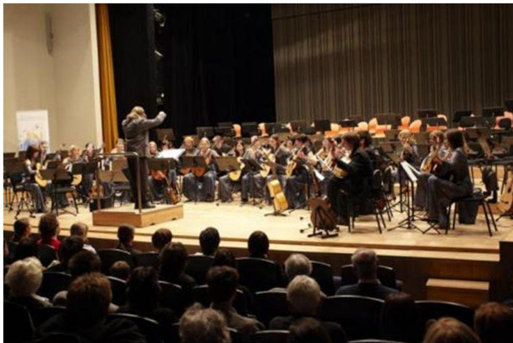
Obr. 9: Fotografie BGO při koncertu z filharmonie v Hradci Králové 21. 4. 2010