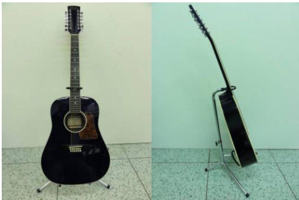
Obr. 18: 12-ti strunná kytara – výrobce Ibanez