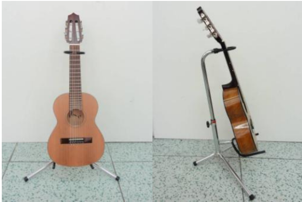
Obr. 14: Sopránová kytara – cedrová – výrobce Jaroslav John