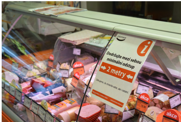
Abbildung 5: Hinweis auf den einzuhaltenden Abstand von 2 Metern an der Fleischtheke.

Informationsmaterial, das wir in dem Laden aufhängen mussten. Nach unserer Entscheidung haben wir sie beim Gebäck- und Wurstabschnitt sowie der Kassenzone platziert. Unsere Strategie war also, Materialien dort abzulegen, wo sich oft Warteschlangen bildeten. Die Kunden respektierten die neue Regel überhaupt nicht und im Geschäft entstanden dieselben Menschengruppen wie früher.