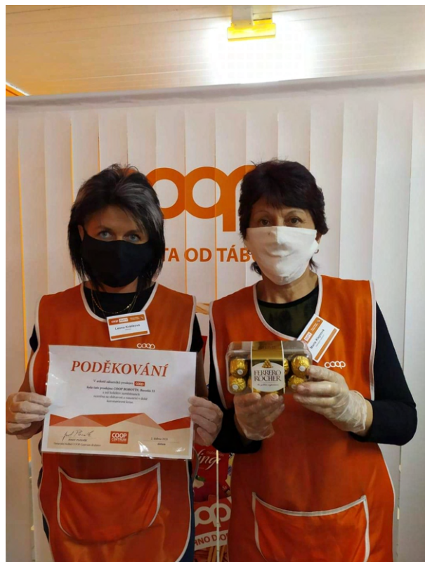
Abbildung 8: Die Filialleiterin und die stellvertretende Filialleiterin zeigen die Auszeichnung aus einer Kundenumfrage, in welcher die Opferbereitschaft der Belegschaft von COOP in Borotín gewürdigt wurde.

Zum Glück ist diese Zeit schon vorbei und ich glaube, dass die Pandemie nie wieder so stark sein wird.