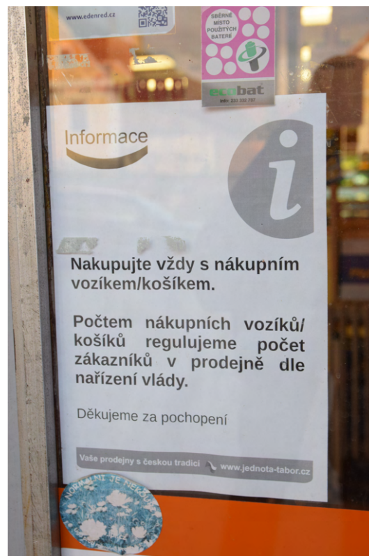
Abbildung 4: Aushang über die Pflicht zum Mitführen eines Einkaufswagens oder eines Einkaufskorbes am Eingang der Verkaufsstelle von COOP in Borotín.

Es war in dieser Zeit nicht möglich, also wir mussten sie ständig ermahnen. Die neue Maßnahme gefiel nicht nur den Schülern nicht, sondern auch anderen Kunden nicht. Die meisten von ihnen sahen keinen Sinn, einen Einkaufskorb zu nehmen, wenn sie nur eine Sache wollten. Auch mit diesen Kunden hatten wir kleine Probleme und es hat lange gedauert, bis sie anfangen, diese Regel zu respektieren. Aber es gab auch solche Kunden, die damit kein Problem hatten. Wenn sie sahen, dass kein Korb frei war, warteten sie automatisch vor dem Geschäft, bis einer frei war.