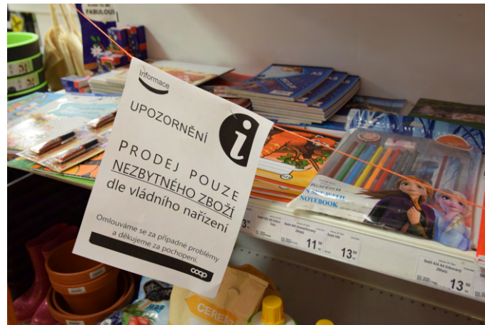
Abbildung 6: Hinweis auf das Verkaufsverbot von nicht notwendigen Produkten, im konkreten Fall Schulmaterialien.

möglich, die Ware im Lager verstecken. Trotz dieser Regelung haben Kunden einige Ware bei uns nachgefragt. Es ging hauptsächlich um Schulmaterial (z.B. Hefte, Stifte, Lineale etc.). Einige Kunden ignorierten das Schild sogar, hoben die Schnur und legten die verbotene Ware in ihren Korb. Die Kassiererin schloss natürlich diese Ware vom Kauf aus und der Kunde entschuldigte sich für seine Unaufmerksamkeit. Kunden kamen auch mit dem Vorschlag zu uns, dass sie die Ware bezahlen, wenn das Verbot endet. Auf diese Idee sind wir jedoch nie eingegangen. Auch wenn es den Kunden so vorkam, als könnten wir die Waren heimlich verkaufen, war das wirklich nicht möglich, weil unsere Arbeitgeber alle verkauften Waren im zentralen System sehen können. Kunden wollten auch oft, dass wir ihnen Socken verkaufen. Sie beschwerten sich, dass sie nichts mehr zum Anziehen haben und immer noch alte Stücke nähen. Das Interesse an Socken war so groß, dass wir das Regal im Lager verstecken mussten. Wegen der zeitweiligen Sortimentseinschränkung in unserem Geschäft hatten wir zwar weniger Arbeit, aber der Umsatzrückgang ließ uns nicht kalt - also wir waren über diese Situation nicht glücklich.