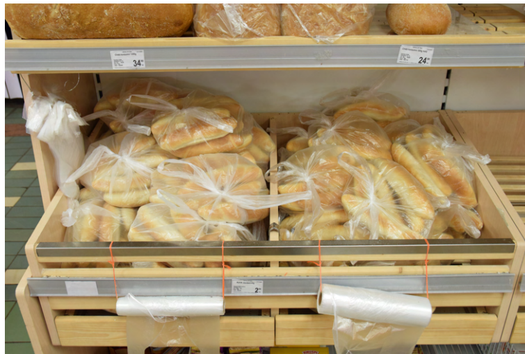
Abbildung 2: Gebäck (Hörnchen, Brot und Brötchen) wurden für eine gewisse Zeit nur vorabgepackt verkauft, damit die Kunden die Waren nicht berühren und der Verkauf somit hygienisch einwandfrei verlaufen kann. (alle Abbildungen von Lukáš Králík)

wurde immer von dem Geschäftsleiter entschieden, basierend auf der Einstellung der Kunden zur Einhaltung der Sicherheitsmaßnahmen. Das war jedoch die beste Lösung für uns. Die meisten Kunden lobten diese Änderung, weil wir ihren Einkauf beschleunigten und dazu ihre Anwesenheit im Geschäft verkürzten. Für die Mitarbeiter war es jedoch Mehrarbeit und im normalen Betrieb des Ladens hat es uns sehr verlangsamt.