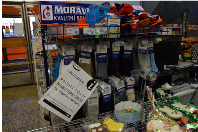
Abbildung 7: Hinweis auf das Verkaufsverbot von nicht notwendigen Produkten, im konkreten Fall Wäsche.