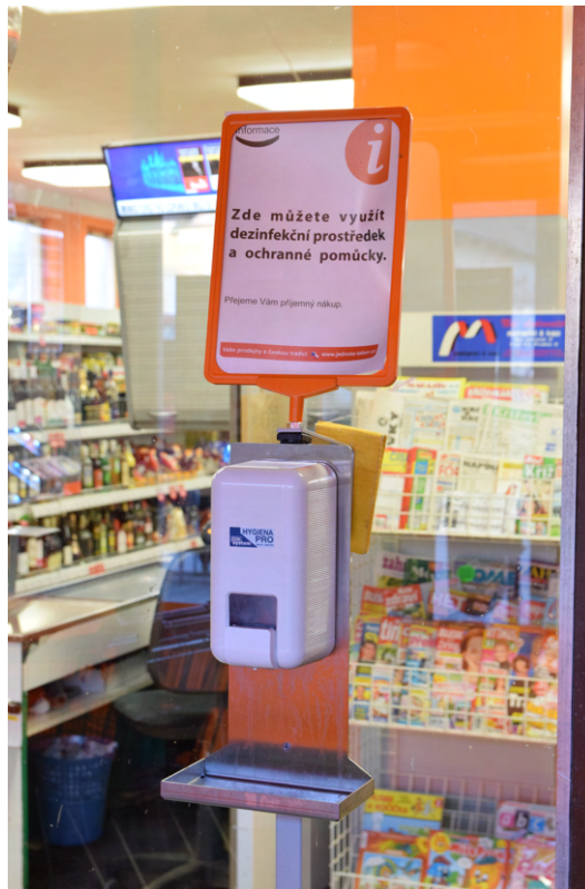
Abbildung 3: Desinfektionsgelhandspender im Eingangsbereich der Filiale von COOP in Borotín.

Kunden zählt. Dies könnte jedoch niemals funktionieren, weil wir eine Arbeitskraft verlieren würden, was den normalen Betrieb des Ladens stören würde. Deshalb haben wir von diesem Plan abgesehen. Zuletzt haben wir uns von einem anderen unserer Geschäfte aus Tábor inspirieren lassen. Dort lösten sie das Problem mit einer begrenzten Anzahl von Körben. Nun musste jeder Kunde beim Einkaufen einen eigenen Einkaufswagen oder Einkaufskorb dabei haben. Diese Regel gefiel besonders den Schülern nicht, die bei uns gewöhnlich nur Kleinigkeiten kauften (z.B. Chips, Getränke, Kaugummi etc.). Die größten Probleme traten jedoch gegen Mittag auf, wenn die Schüler eine Mittagspause in der Schule hatten. Sie kommen in dem Geschäft in Gruppen (z.B. bis zu 20 Kinder auf einmal). In diesem Moment mussten einige der Kinder vor dem Laden warten und sich dort abwechseln. Es war auch üblich, dass die Kinder keinen Einkaufskorb benutzen oder nur einen für die ganze Gruppe hatten.