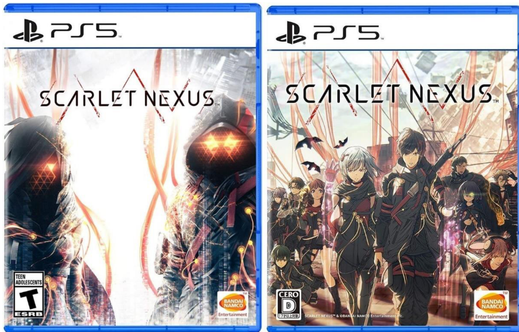
Abbildung 9: US cover vs Japanese cover