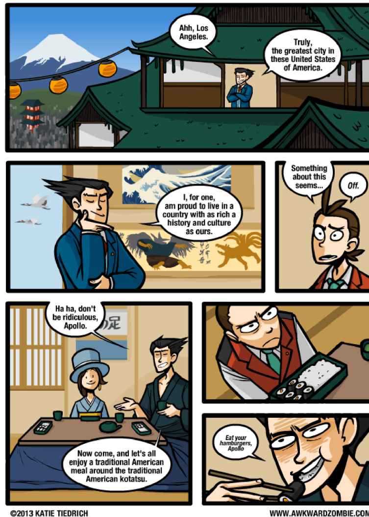
Abbildung 7: Cultur Schlock