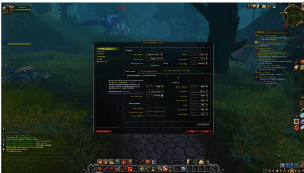
Abbildung 2: World of Warcraft Graphics

UI – „The user interface (UI) is the point of human-computer interaction and communication in a device. This can include display screens, keyboards, a mouse and the appearance of a desktop. It is also the way through which a user interacts with an application or a website.“ (Churchville, 2021) UI (übersetzt Benutzerschnittstelle) ist bei Videospielen alles, womit der Spieler mit dem Spiel interagieren kann.