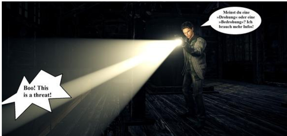
Abbildung 3: Warum Spieleübersetzung schwer ist – Das stochern im Dunkeln.

Übersetzer sowie von Indie so auch von AAA Spielen müssen sich mit einigen für Videospiele einzigartigen Problemen befassen. Diese Probleme verlaufen durch den gesamten Übersetzungsprozess. Der Übersetzer kann zum Beispiel vom Entwickler den Text in hunderten von kleinen Dateien die auch nur zwei Sätze enthalten können bekommen. Eine übliche Strategie von Übersetzern ist es diese Dateien in andere Einfacher zu verstehende Formate umzuformatieren. Diese Dokumente müssen aber, bevor sie der Übersetzer wieder zum Entwickler zurückschicken kann, wieder in die ursprünglichen Formate zurückformatiert werden. Das größte Problem bei der Übersetzung ist eng mit diesen Dokumenten verbunden. Es handelt sich um die sogenannte „Blinde“ Übersetzung. Die Textdokumente enthalten den zu Übersetzenden Text, sie verraten dem Übersetzer jedoch nicht den Kontext. Diese Texte können Wörter enthalten, bei denen sich der Übersetzer nicht sicher sein kann, was für eine Wortgruppe hier gemeint ist. Bei gesprochenen Sätzen kann es wieder dazu kommen, dass dank dem fehlenden Kontext der Charakter verwechselt wird, der diesen Satz gerade spricht. Ein weiteres Problem ist, dass die zu übersetzenden Texte nicht in chronologischer Reihenfolge sind. Man kann also nicht von allein erfahren, ob es sich hier um einen Teil handelt, der am Anfang des Spiels stattfindet, oder ob es ein Abschnitt aus dem Ende ist. Es lässt sich also nur sehr schwer entschlüsseln, ob der Charakter,