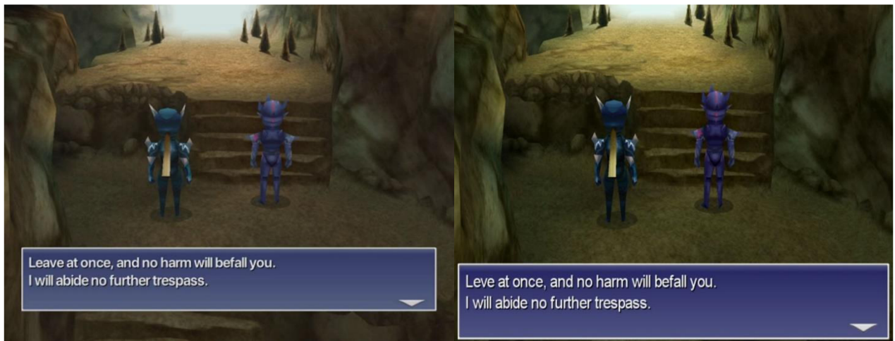
Abbildung 5, 6: Final Fantasy IV mobile version, Final Fantasy IV PC version