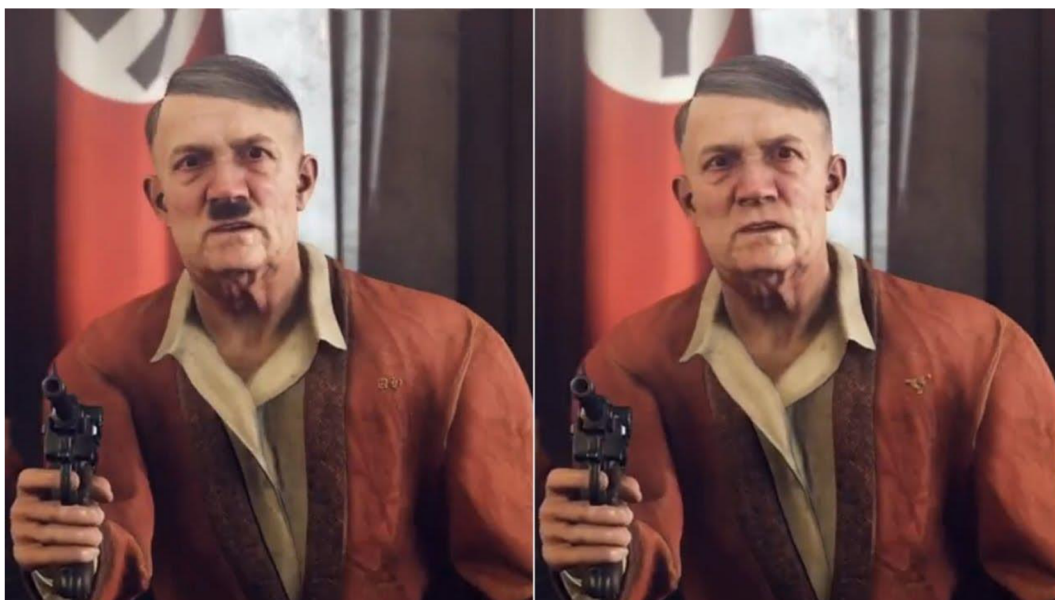
Abbildung 10: Zensur in Wolfenstein

Hier sieht man die Spielehülle des Spiel Scarlet Nexus, die in den USA rauskam und daneben sieht man das japanische Original. Das Original wurde in dem für Japan typischen Anime Stil angefertigt. Für die US-Version wurde auf einen traditionellen Stil gesetzt, wo nur die beiden Hauptfiguren zu sehen sind.