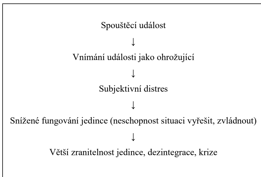
Tabulka č. 5: Vzorec procesu formování krize