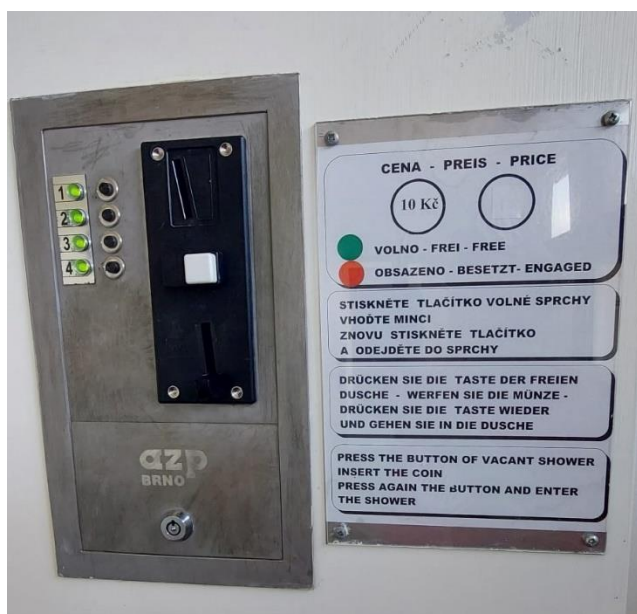
Obrázek 11 Automat na sprchy Foto: Vlastní fotografie, 2023

konvice...). Dále uvedl, že autokemp má svůj vlastní zdroj pitné vody z vrtu a díky tomu mají dostatek vody nejen pro všechny návštěvníky, ale i pro provoz koupaliště. V šetření zdroji má však autokemp ještě svoje mezery. Protože má autokemp svůj vlastní vrt na vodu, dle pana starosty se šetřením s vodou v autokempu nijak nezabývá. Avšak z předchozího terénního šetření bylo zjištěno, že se v kempu nacházejí automaty na sprchy viz Obrázek 11, které určitě k šetření vodou přispívají. Také se v autokempu nacházejí kohoutky na vodu, které pouštějí vodu jen na určitou dobu, a mají tak na šetření s vodou kladný vliv.