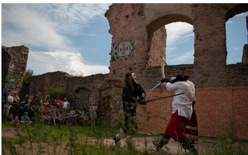
Obrázek 9 Rytířský turnaj

Hrad je zpřístupněn od dubna do září v určité dny a hodiny. Před hradem se nachází parkoviště pro návštěvníky a přímo u parkoviště je zřízena autobusová zastávka. V hlavní sezóně se zde konají nejrůznější akce a zábavy, které lákají velké množství návštěvníků jako například masopust, pouť nebo rytířské turnaje viz Obrázek 9.