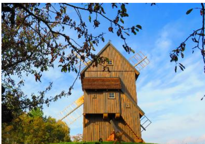
Obrázek 8 Větrný mlýn v Borovnici

výstavba trvala dva roky. Uvádí, že nový mlýn vznikl díky podpoře obce Borovnice, Královéhradeckému kraji, spolku Větrák a díky výpomoci od řemeslníků a vybraných středních škol. O dnešním mlýnu uvádějí, že se celé jeho tělo natáčí ve směru větru a je plně vybaven technologií pro mlynářské řemeslo. Uvádí, že mlýn má dvě patra a skládá se z pravé a levé části viz Obrázek 8. Do prvního patra je možné se dostat po dřevěném schodišti, kde je v pravé části umístěna moučnice a v levé části je zřízen kapsový výtah pro přepravu zrn.