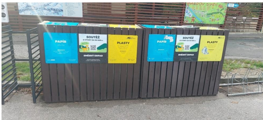
Obrázek 12 Možné řešení košů na tříděný odpad

K udržitelnému rozvoji nejvíce přispívají udržováním přírodního prostředí, rekonstrukcí starých budov, zachováváním životních podmínek pro místní obyvatele, používáním vratného nádobí namísto plastového a pohledem do budoucna, který se vyvíjí v souladu s udržitelností. Pro další podporu své udržitelnosti pracovníci autokempu svým hostům denně zajišťují dostatek dřeva a umožňují jim z biologických zbytků vytvářet kompost. Největším přínosem do budoucna by mohlo být naplánované pořízení fotovoltaiky a košů na tříděný odpad viz Obrázek 12. Bylo by dobré návštěvníky na nové koše upozornit a více je k třídění motivovat různými tabulemi či soutěžemi. Dále by bylo vhodné ukázat jim, jaké mají v třídění odpadů možnosti a jak tím podpoří udržitelný rozvoj autokempu.