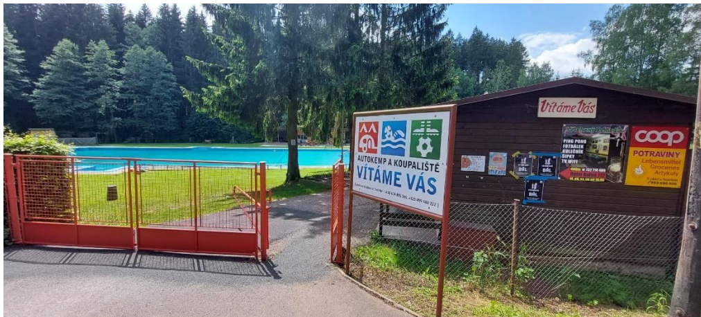
Obrázek 5 Hlavní vstup do autokempu Foto: Vlastní fotografie, 2023

Velké koupaliště patřící k autokempu je pravidelně udržované a chemicky ošetřované, a proto je v něm průzračně čistá voda, která přiláká do autokempu spousty návštěvníků. U koupaliště se nachází malý kiosek s občerstvením a s možností posezení. Vstup na koupaliště je placený a možnost zaparkování je na kamenitém parkovišti u recepcce a na velkém travnatém parkovišti na začátku autokempu.