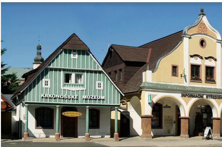
Obrázek 10 Krkonošské muzeum ve Vrchlabí

Součástí muzea je i turistické informační centrum, kde si návštěvníci mohou zakoupit suvenýry. KRNAP (2023) uvádí, že muzeum je otevřené pro návštěvníky celoročně v určité dny a pořádají se zde akce jako například masopust, Velikonoce, muzejní noc, řemeslnické léto či vánoční jarmark.