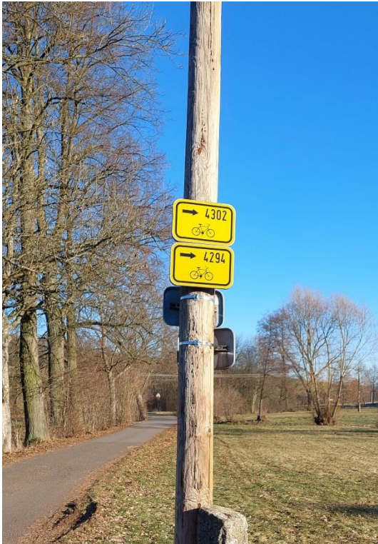
Obrázek 6 Ukazatel směru a čísel cyklotras