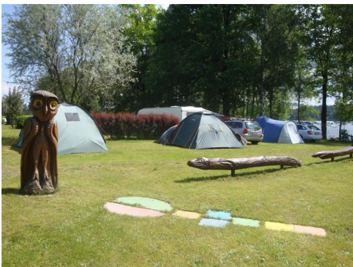
Obrázek 2 Stanovací místa v autokempu Oasa Staňkov

dřevěné prolézačky a sochy, doprovodný zábavný program, nebo půjčení atrakcí na vodní plochu.