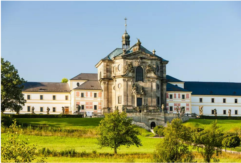
Obrázek 7 Kostel Nejsvětější Trojice

Hospitál Kuks (2022) uvádí, že v určitém období se zde konají komentované prohlídky, kde je možné si vybrat ze čtyř okruhů. První (základní) prohlídkový okruh se dle nich zaměřuje na historický vývoj areálu, ve druhé okruhu je ukázána a představena historie lékáren, třetí okruh se zaměřuje na kostel Nejsvětější Trojice a hrobku rodu Šporků a poslední čtvrtý okruh ukazuje návštěvníkům historii výroby léků a farmaceutické muzeum. Prohlídky jsou dle nich možné i pro zájezdové skupiny, a to i v cizím jazyce (angličtina, němčina). Jako součást areálu uvádějí i bylinkovou zahradu z osmnáctého století, která se nachází za hospitém a obsahuje velké množství záhonů osázených nejrůznějšími bylinkami.