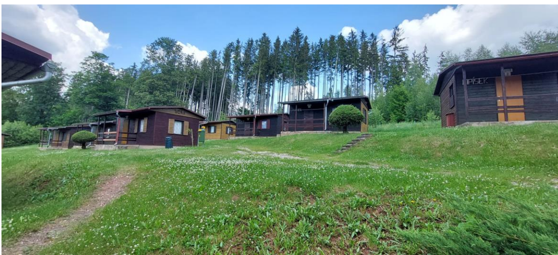
Obrázek 4 Chaty v autokempu

Provoz je pouze sezónní od června do září, neboť autokemp není připraven na podmínky mimo sezónního provozu. Skrz autokemp prochází silnice, která jej dělí na dvě části. V části nad silnicí se nachází parkoviště pro návštěvníky, hlavní budova, ve které sídlí recepce, plně vybavená kuchyň, jídelna a sociální zařízení s toaletami i sprchami. Dále se v této části nachází šestnáct dřevěných chat, které jsou buď čtyřlůžkové s možností přistýlky nebo šestilůžkové viz Obrázek 4. Chaty jsou základně vybaveny, bez sociálního zařízení a přístupu vody a udržovány jsou v původním stylu.