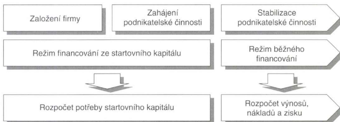
Obrázek 1 Stadia zahájení podnikatelské činnosti, Zdroj: vlastní zpracování