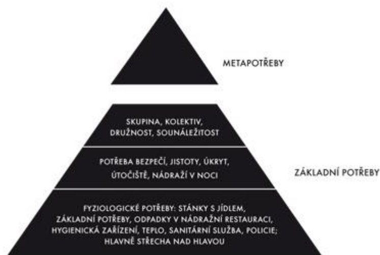
Obrázek 4: Přizpůsobení Maslowovy pyramidy těm nejubožejším 62

pyramidě je zřejmé, že sociální vyloučení může mít vliv na vnímání potřeb. Hierarchie základních potřeb je totožná s původní Maslowovou pyramidou potřeb. Sociálně vyloučení jedinci vnímají potřeby fyziologické, potřeby bezpečí a potřeby náklonnosti a sounáležitosti. Sociálně vyloučené osoby nemají plně uspokojené základní potřeby, proto naplnění potřeb vyšších už ani za potřebu nepovažují. To potvrzuje teorii Maslowa o tom, že vyšší potřeby mohou být naplněny jen v případě, jsou-li naplněny potřeby nižší. 61