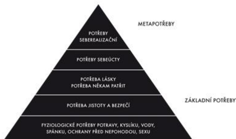
Obrázek 3: Maslowova pyramida potřeb 56

Potřeby člověka nelze chápat pouze jako nedostatek nebo přebytek energie na straně lidského organismu, který má být uveden do stavu rovnováhy, ale i jako vztahový jev směřující k určitému cíli. Potřeba vyjadřuje základní vztahy člověka k vnějšímu světu, způsoby vzájemného působení člověka a světa kolem něj nebo způsob začleňování do vnějšího světa. To, jakým způsobem probíhá uspokojování základních potřeb člověka, poznamenává celkový způsob a kvalitu jeho života. Členěním základních životních potřeb se zabývala a zabývá řada autorů. Jako jeden z prvních autorů uchopil ve své teorii koncept potřeb Henry Murray. 55 Jeho teorii rozpracoval hlouběji americký psycholog Abraham Maslow.