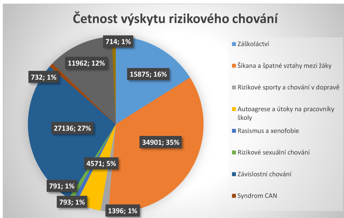
Graf 1- Četnost výskytu rizikového chování

Vzhledem ke kvalitativnímu charakteru praktické části této bakalářské práce její výsledky nebudou v podobě statistického výčtu četnosti výskytu rizikových jevů ve školách. Přijde mi však, že podobný výzkum by v této práci měl být zahrnut a pro tyto účely uvádím celostátní studii s využitím údajů ze Systému evidence preventivních aktivit (SEPA), která představuje informace o stavu prevence rizikového chování ve školách v České republice v průběhu školního roku 2017/18. Z této studie využiji údaje o výskytu rizikového chování zjišťované u celkového počtu 620 614 žáků a studentů, přičemž u tohoto počtu respondentů se objevilo 98 871 jevů. Tyto údaje pro přehlednost převedu do vlastního grafu a rozdělím je do podobných skupin jako u výše uvedeného výčtu typů rizikového chování (Vacek a kol., 2019)