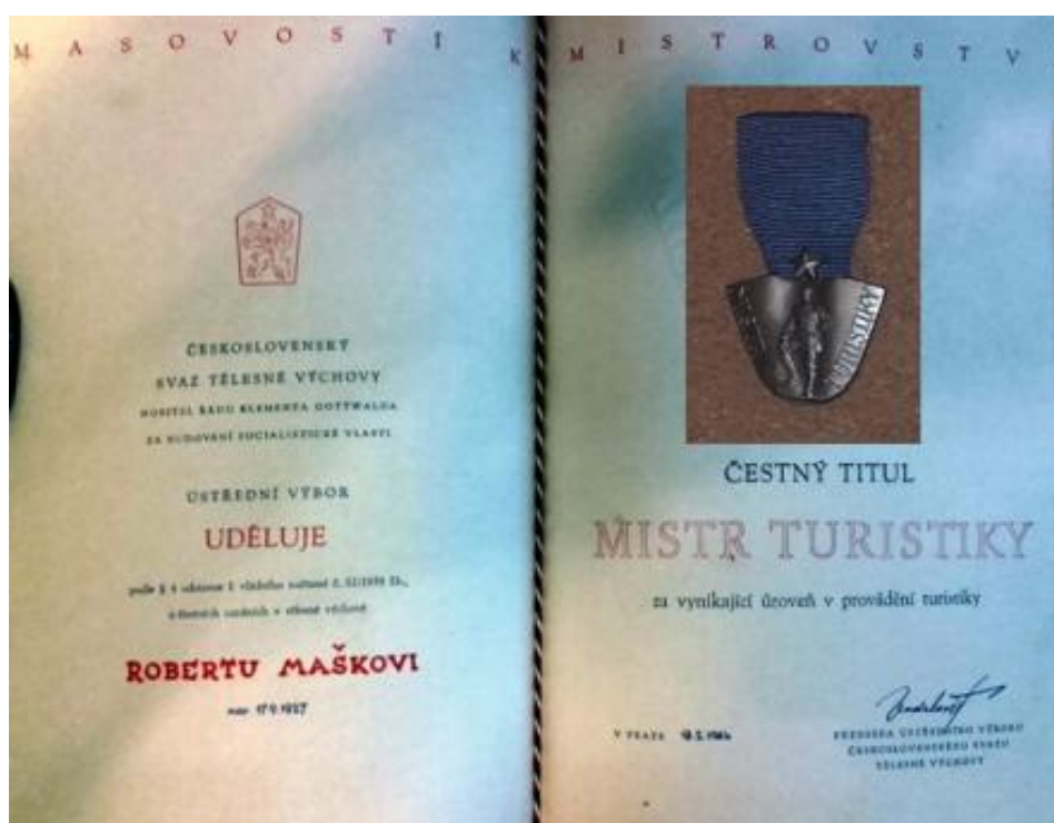
Obrázek 4: Titul mistra turistiky včetně odznaku 76

Dosažení určitého stupně výkonnostních tříd bylo i základem pro získání titulů vedoucího a cvičitele. Všichni pamětníci tedy jsou držiteli alespoň nějakého z nich. Tyto tituly byly spojeny i s množstvím školení, na která ovšem byli připuštěni pouze takoví jedinci, kteří vyhovovali svými dosaženými výkonnostními stupni.