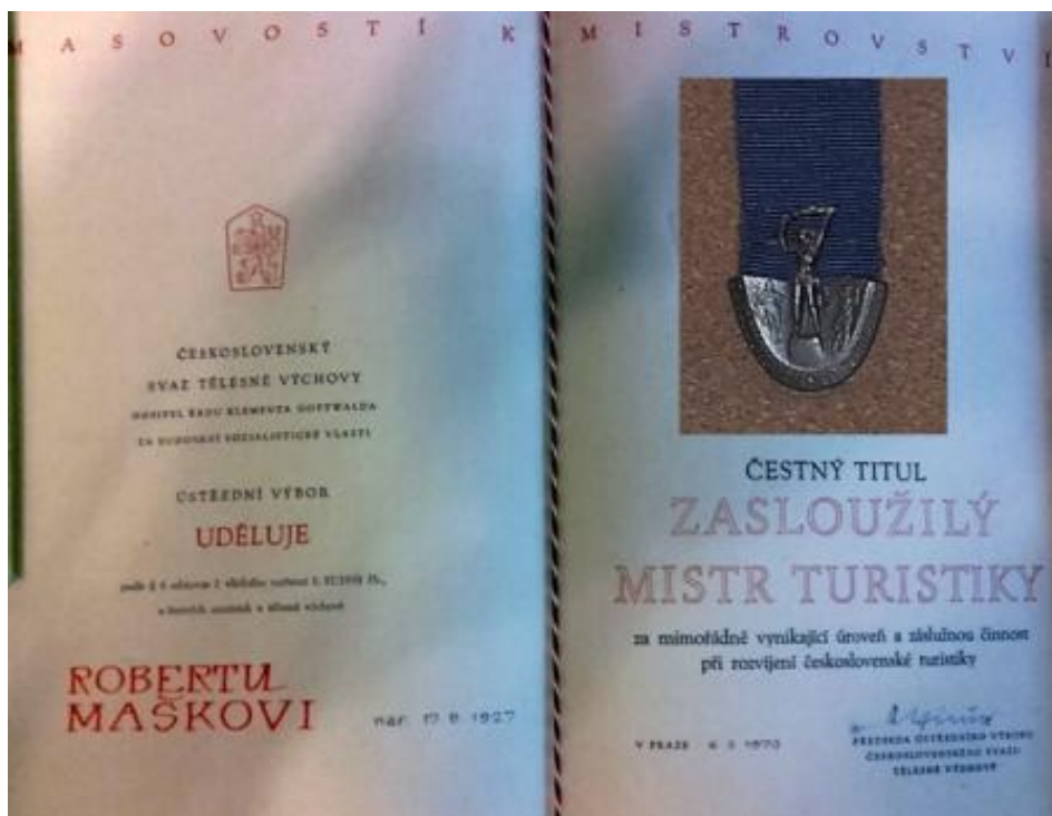
Obrázek 5: Titul zasloužilého mistra turistiky včetně odznaku 77