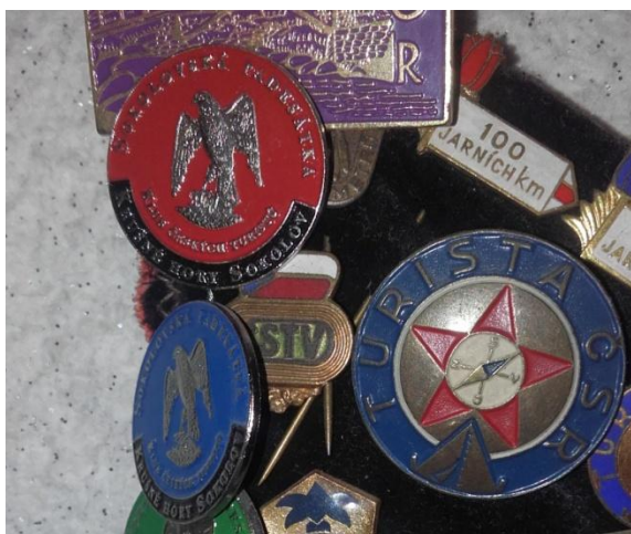
Obrázek 2: Odznak Turista ČSR a Odznak 100 jarních km 69

Na základě příliš přísných pravidel pro získávání odznaků TČSR , jich bylo ze začátku (do roku 1954) uděleno příliš málo (stovky). Byly proto celkově zjednodušeny pravidla jejich udílení. Množství udělených odznaků bylo nejdříve nedostatečné i u udělených výkonových tříd, u nichž byly do roku 1956 snižovány nároky. 68