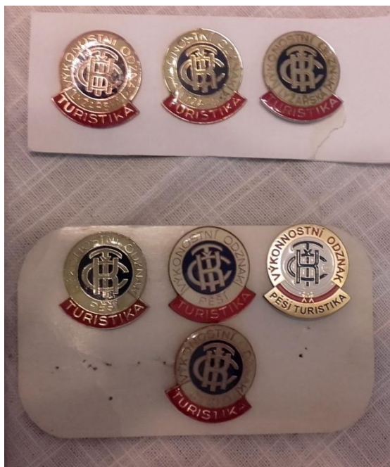
Obrázek 3: Výkonnostní odznaky za lyžařskou, pěší a cykloturistiku (zleva bronzové, stříbrné a zlaté) 70

Po přestupu turistiky do ČSTV byly provedeny změny v udílení odznaků tak, aby jejich získávání bylo ještě jednodušší a lépe na sebe navazovaly. Vznikly tak bronzový, stříbrný a zlatý odznak turistiky – na něž navazují výkonnostní třídy (III., II., a I.) pro sportovněji založené turisty. Dále se objevily i odznaky „100 jarních kilometrů“ (1957) ke stejnojmenné akci propagující turistiku a zavedení odznaku Turista – značkář (1958). 71 Podle získaných odznaků (jejichž udělování bylo možné jednoduše sledovat) a následného rozlišování obtížnosti turistických výprav šlo dobře vybírat, kdo na jakou výpravu kam půjde. Takových výprav se totiž mohl teoreticky zúčastnit jen majitel určitého odznaku. 72 Je nutné ovšem vzít v potaz i to že získání odznaku mělo i praktickou funkci, jež spočívala v tom, že se na nepřiměřeně náročnou výpravu nevydal naprostý amatér. To například prakticky platilo pro tematické zájezdy pořádané Sport-turistem.